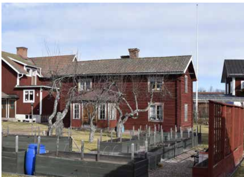
Välbevarad äldre enkelstuga med inbyggd farstuvist mitt i gytret som är södra delen av Djurbyn. Djura 18:7.