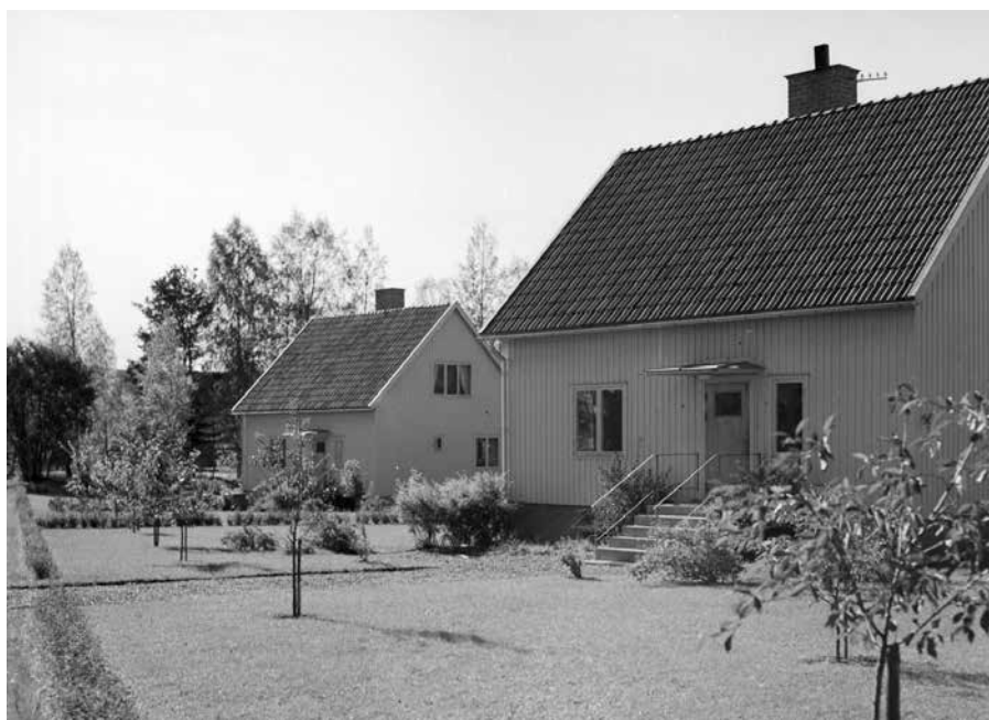
Intilliggande nyuppförda arbetarbostäder. Det var inte ovanligt att större kraftstationer och liknande anläggningar fick arbetarbostäder uppförda intill. Den mönsterpassade enhetliga karkatären är typiskt funktionalistisk. Dalarnas museums bildarkiv/Stora Ensos bildsamling. Foto: Sven Berg 1952.