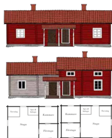
Parstuga på »Djuravis«