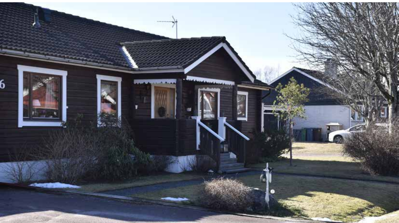
Timmervilla från 1974-75 i östra Djura. Byggnaden uppfördes i ett helt nyetablerat småhusområde, sannolikt som egna hem. Djura 28:26.