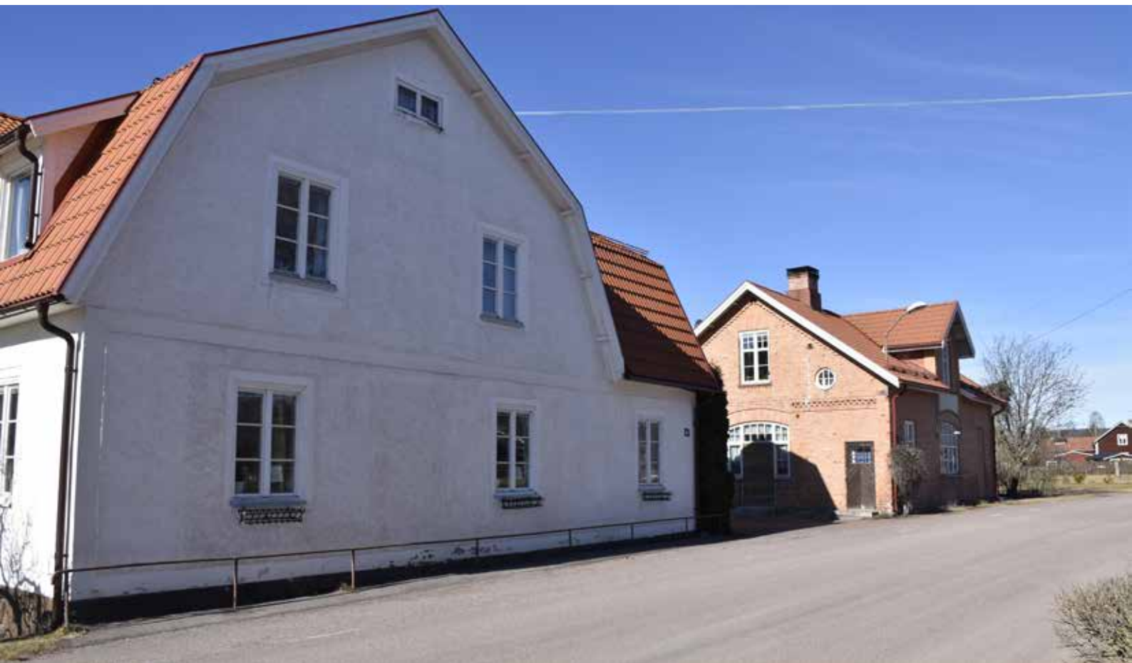
Närmast i bilden syns Per Heds affär (Heperes) som byggdes som affär med slakteri och även taxiverksamhet. Tegelbyggnaden i bakgrunden är mejeriet. Djura 27:8 (Per Heds affär, vänster) och Djura 13:2 (mejeriet, höger).