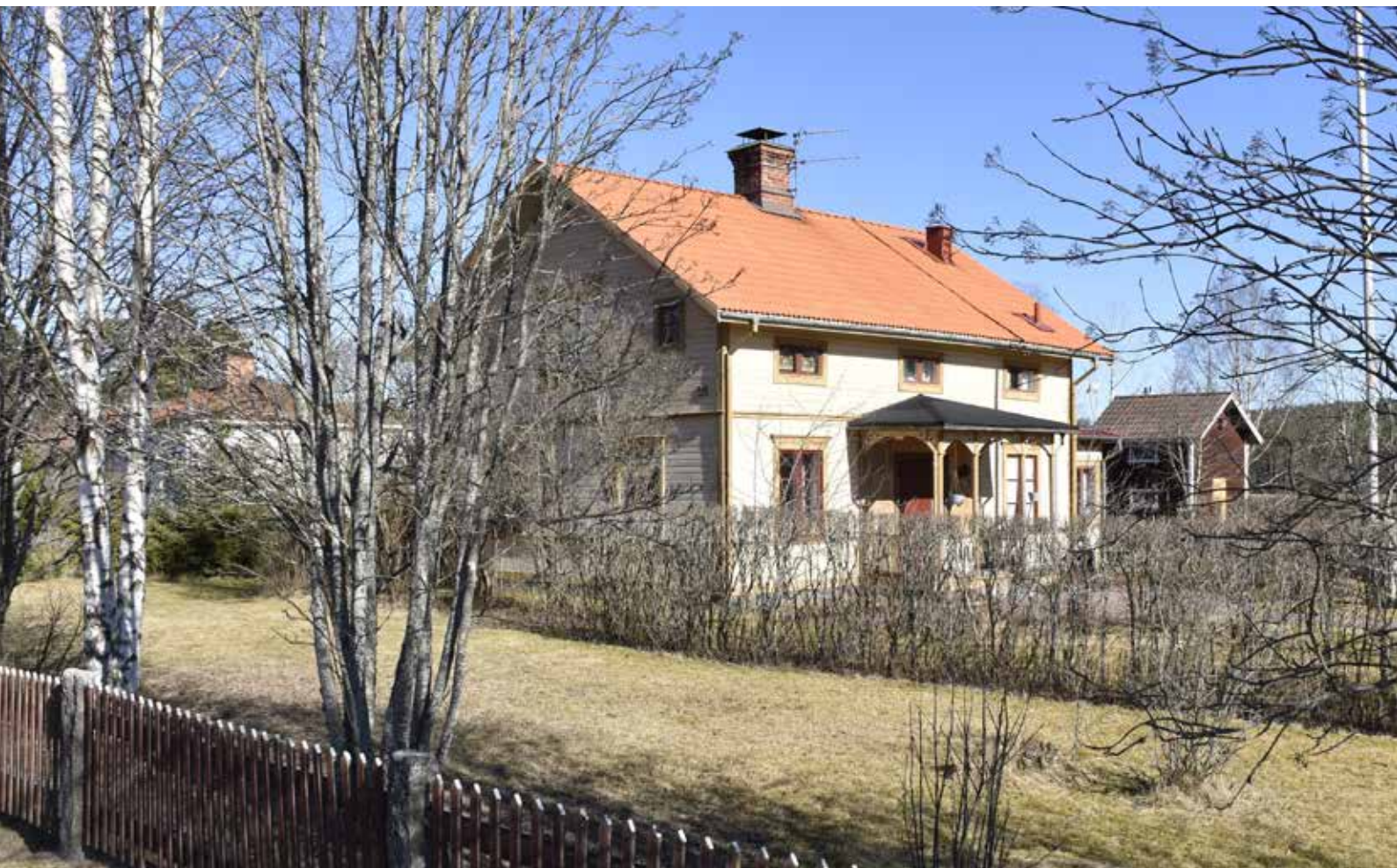
Välbevarat korsplanshus från tiden kring sekelskiftet år 1900 i Djur-Heden. Byggnaden har ett blindfönster till höger om entrén, där trappan till övervåningen är. Fasaden präglas av strikt symmetri. Djura 18:3.