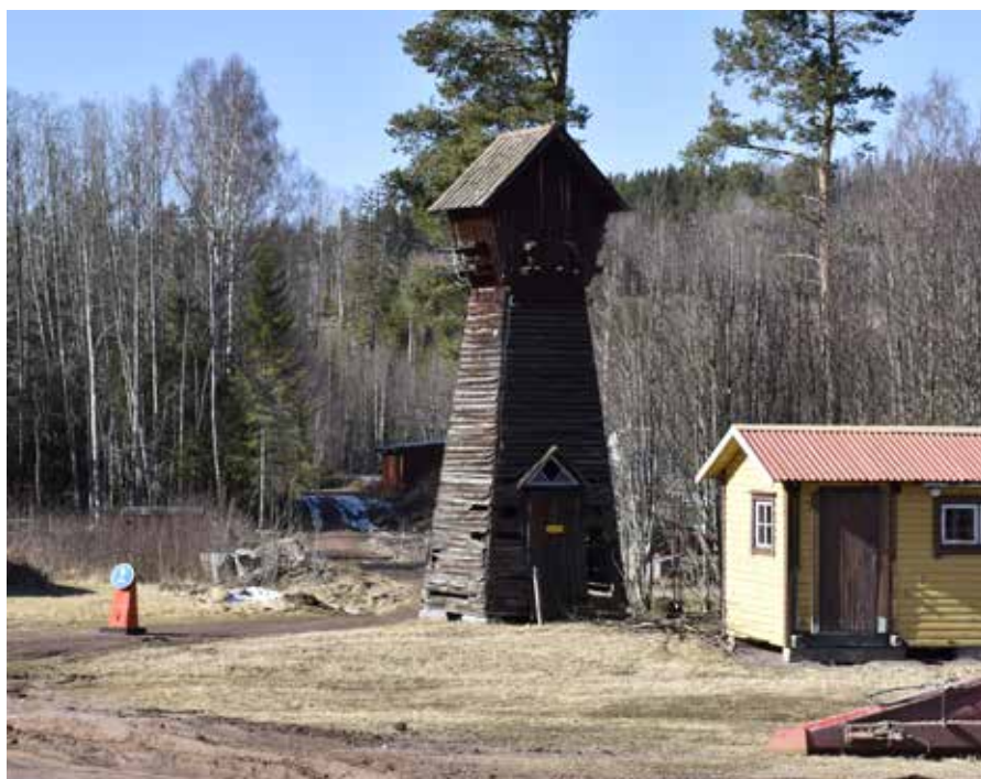
Transformatorstation av typen Dalkulla i Djur-Heden. Djura S:97.