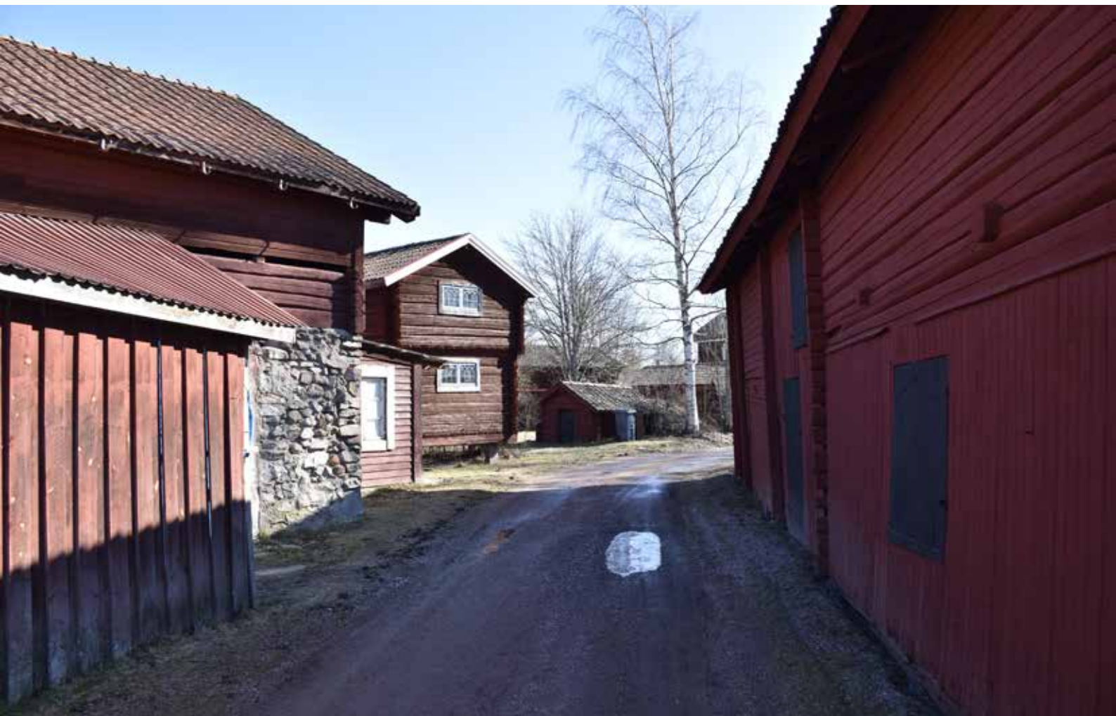
Smal bygata mellan de faluröda timmerhusen norr om Djura kapell. Byggnaden till vänster i bilden har bottenvåning i gjutmur. Djura 35:7, 29:II och 34:23 (till höger).