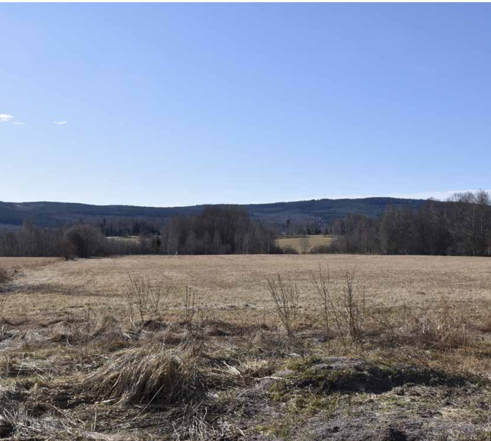
Det stora och öppna betes- och odlingslandskapen söder om Djura. Landskapet genomskärs av Djuraån som omgärdas av rik växtlighet.