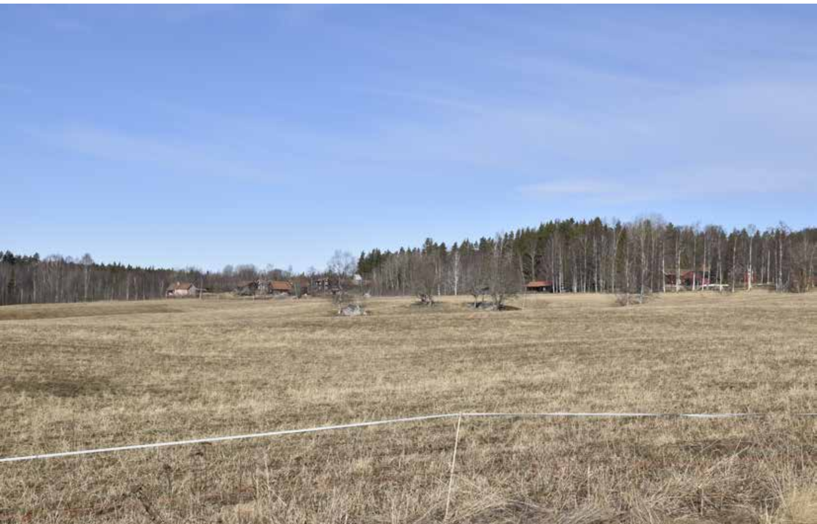
Utblick över det stora och öppna odlingslandskapet mellan Helgsta och Resargårdarna.