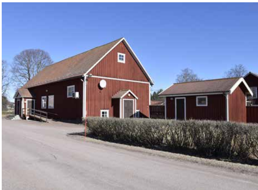
Wasasalen som byggdes 1923. Byggnaden har genomgått vissa förändringar, sannolikt under 1970- och 1980-talen. Djura 27:5.