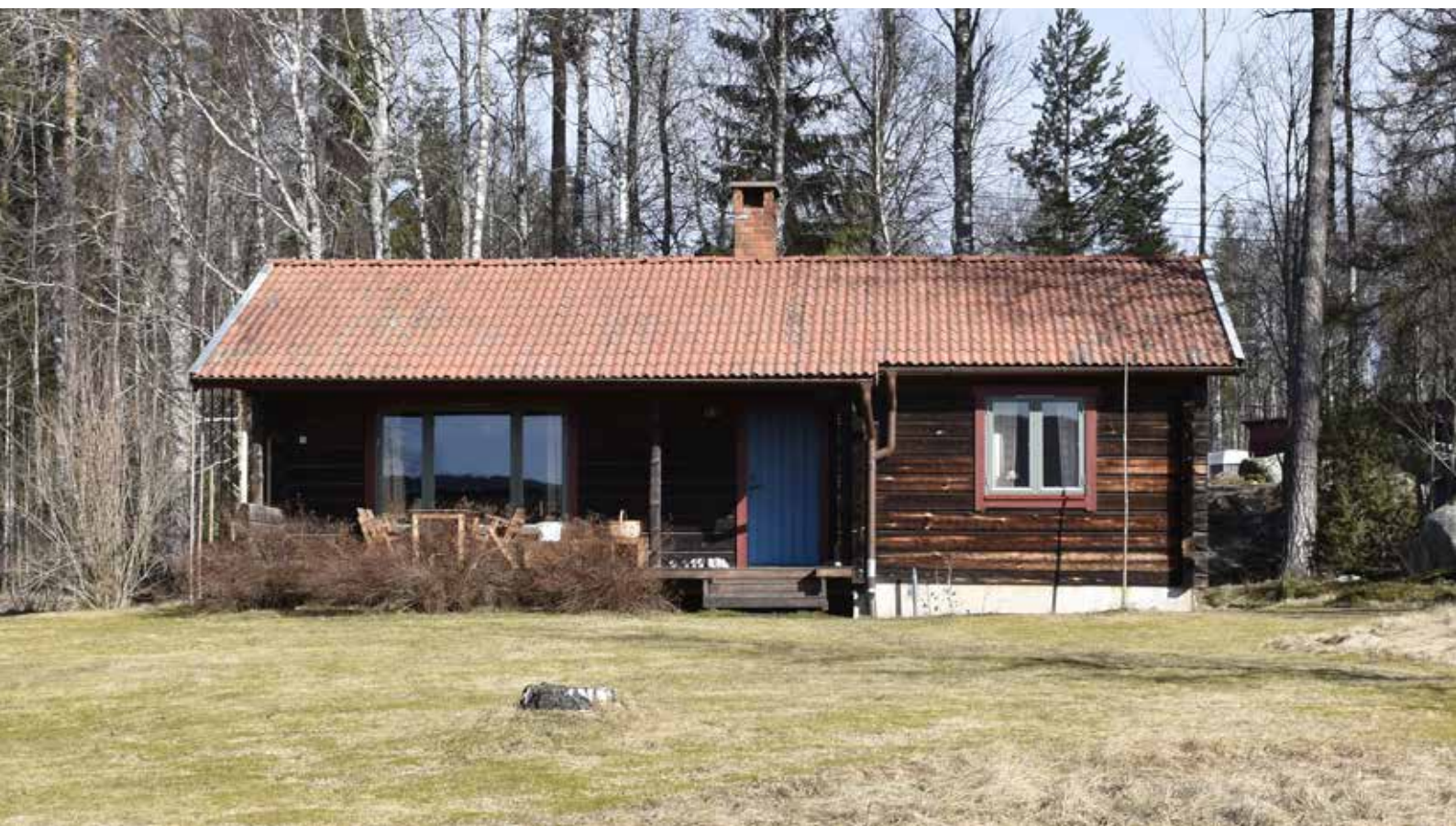
Modernistisk timmervilla sydöst om Resargårdarna. Byggnaden har en utformning som är tidstypisk för tiden kring 1900-talets mitt, med perspektivfönster och indragen veranda. Djura 42:13.

inspiration från stiltypiskt modernistiska villor från samma period. Sådant som form, storlek, takvinkel och planlösning liknade ofta utformningen på andra samtida småhus. Det finns bland annat exempel på timrade suterränghus, något som annars starkt förknippas med 1960- och 1970-talens industrimässiga byggnadskultur. Det förekom även, om än inte alltid, att byggnaderna försågs med detaljer som anspelade på nationalromantiken och idéer om det äldre bondesamhället. På vissa hus förekommer exempelvis fantasifullt tilltagna allmogedetaljer så som fönsterluckor, stora och små blyspröjsade fönster med färgat antikglas, kronskorstenar och farstukvistar med rosmålningsmotiv i triangelfälten och svarvade hörnstolpar. Andra detaljer som tillhör dessa timmerhus är trögärdesgårdar i fåbodstil och gårdsportaler med stolpar i rot. I Djura finns ett fåtal exempel på timmerhus som uppfördes under den moderna epoken 1930–1980. Byggnaderna har särskilt kulturvärde eftersom de är karaktäristiska för Leksandsbygden och kan berätta om hur nya byggnader anpassades till den lokala byggnadstraditionen även i en tid som annars brukar karaktäriseras som hänsynslös i förhållande till lokala särdrag och traditioner inom byggnadskulturen. Några särskilt intressanta exempel finns på fastigheterna Djura 34:22, Djura 42:13, Djura 17:4 och Djura 28:26.