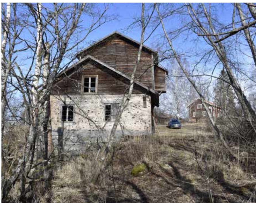
Helgsta tullkvarn med smedjan närmast i bild. I bakgrunden till höger skymtar det tillhörande bostället. Djura 28:2.