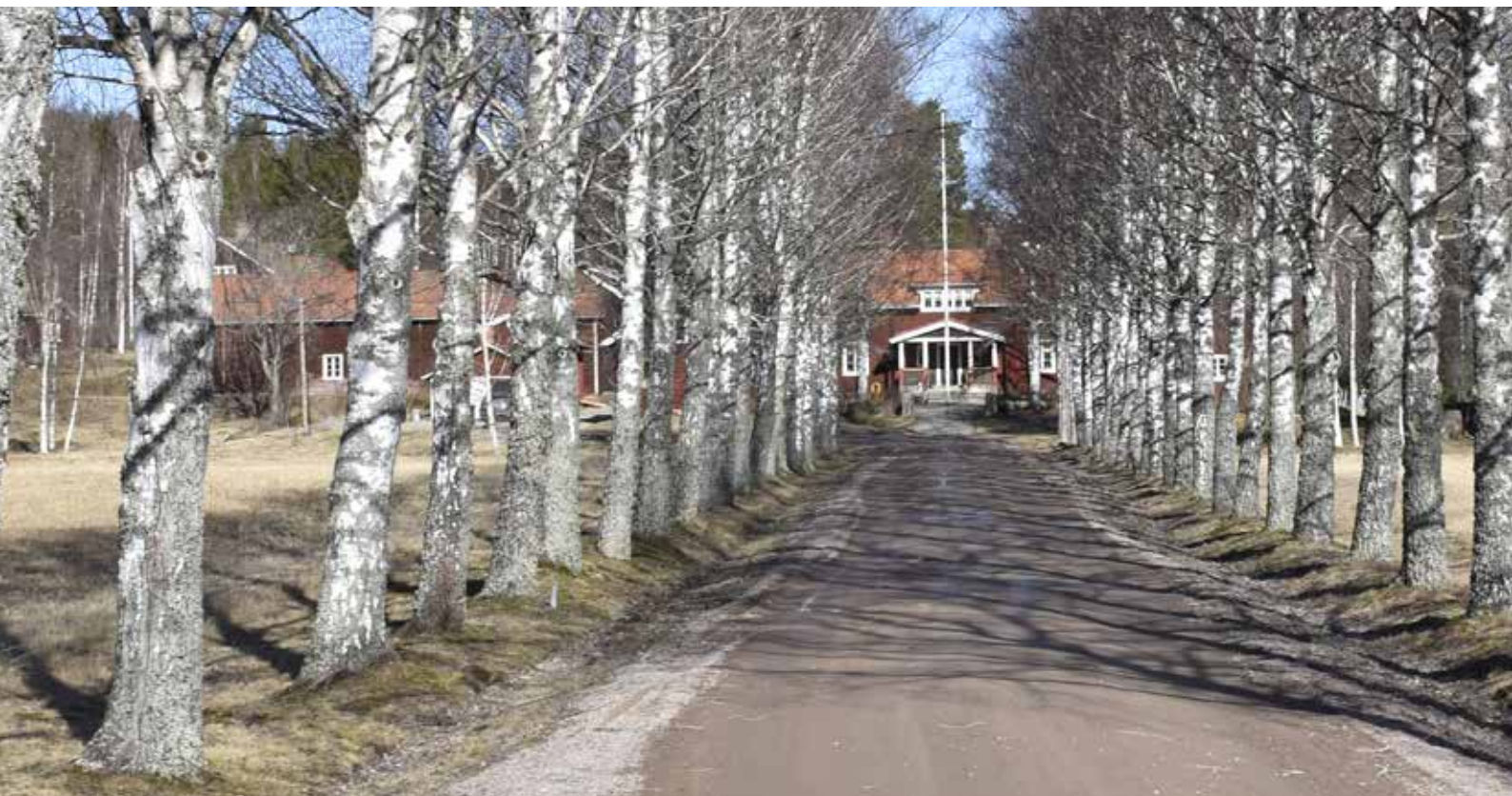
Komministerbostället i Haggårdarna uppfördes 1872. Den karaktäristiska björkallén vid anfarten ger anläggningen en herrgårdslik framtoning som är ovanlig i Leksandsbygden. Djura prästgård 1:1.