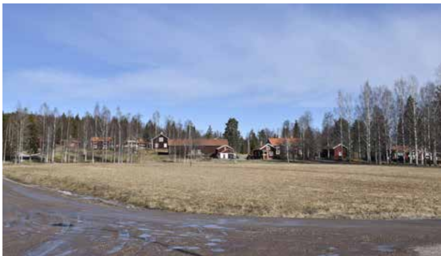
Utsikt mot Haggårdarna från söder. Till höger i bilden syns björkallén som leder upp till komministerbostället i Djura.