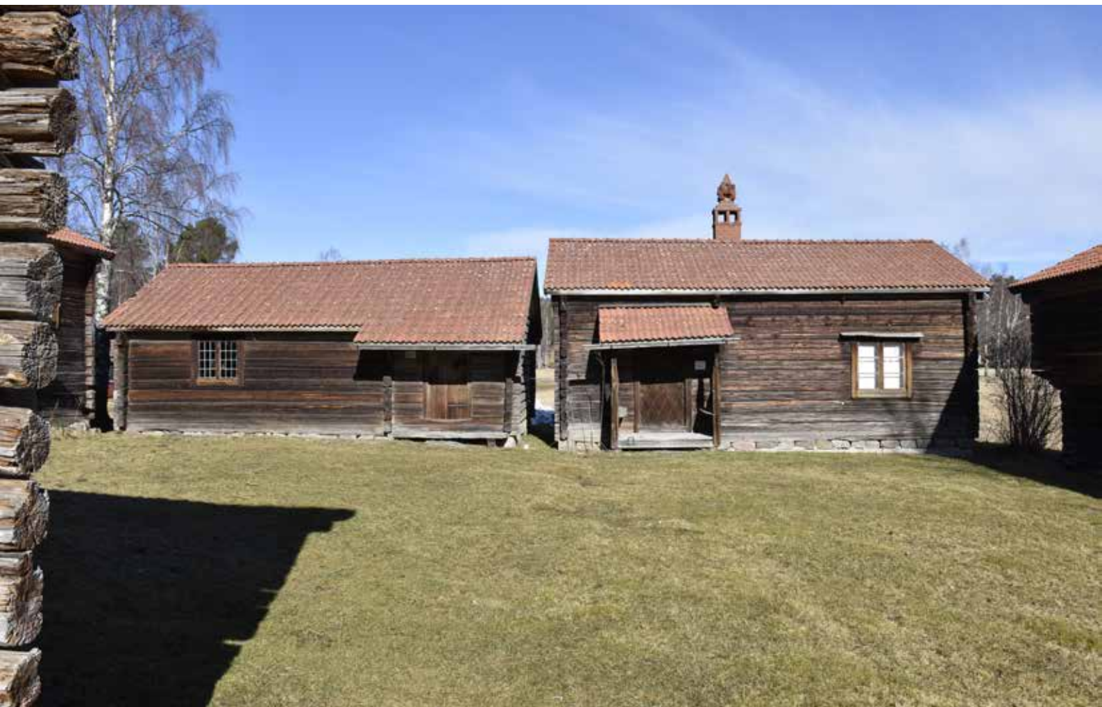
I Djura byggdes sällan regelrätta parstugor historiskt. Istället placerades två enkelstugor tätt intill varandra som på bilden. Bilden är från Djuras hembygdsgård som invigdes 1939. Djura 7:3.