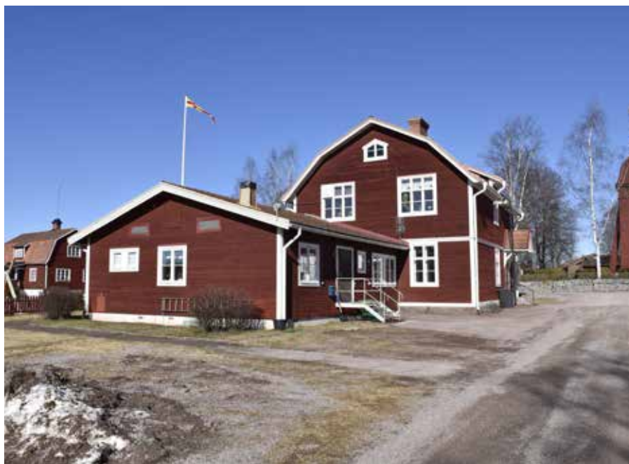
Djuras församlingshem med karaktäristiskt mansardtak. Djura 53:II.