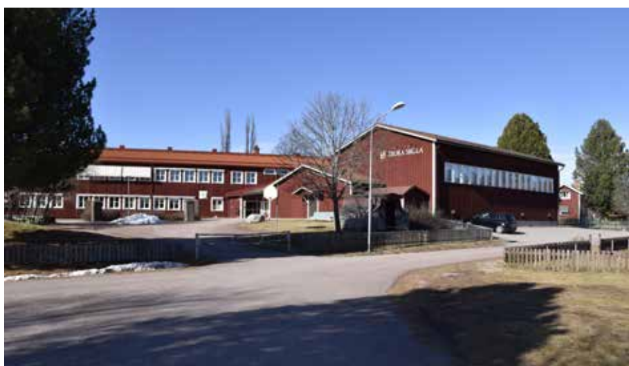
Djura skola uppfördes 1953 men genomgick en omfattande omgestaltning kring 1980. Skolan är storskalig men anpassad till omgivningen genom färgsättning och byggnadsformer. Djura 57:3.