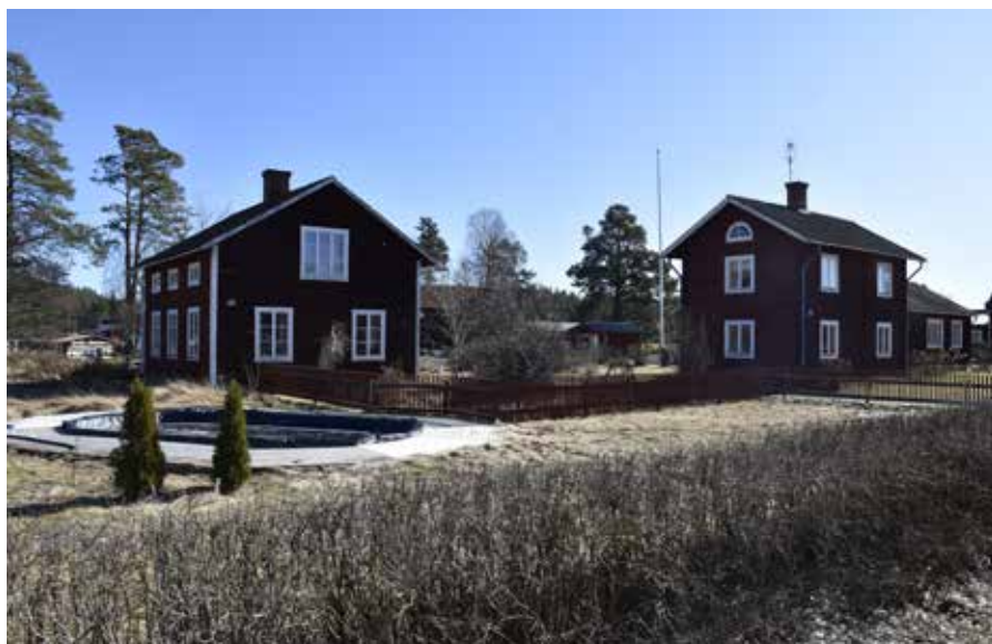
Korsplanshus och enkelstuga om två våningar i Djur-Heden. Djura 34:16 (vänster) och Djura 34:17 (höger).