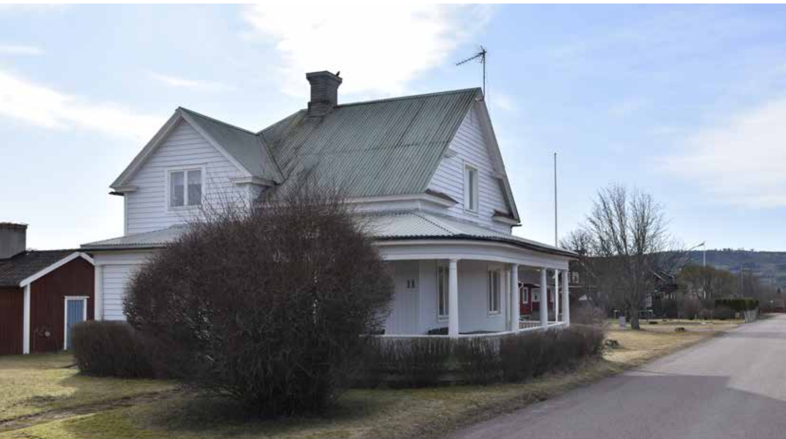
Amerikahuset i södra delen av Djurbyn. Byggnaden har ovanlig form och detaljer inspirerade av amerikansk byggnadskultur. Byggherren hade arbetat som snickare i Amerika. Djura 46:1.