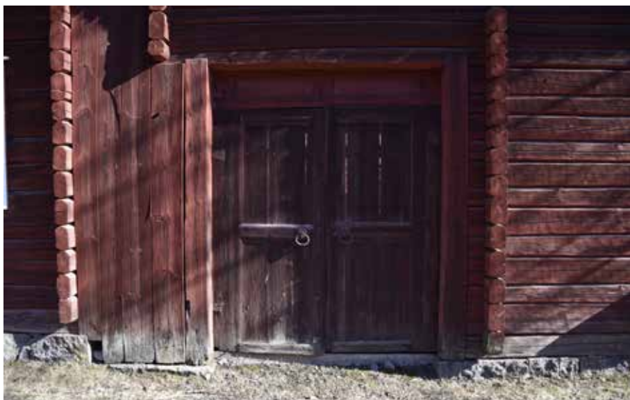
Lider med träportar och vackra smidesdetaljer. Djura 34:25.