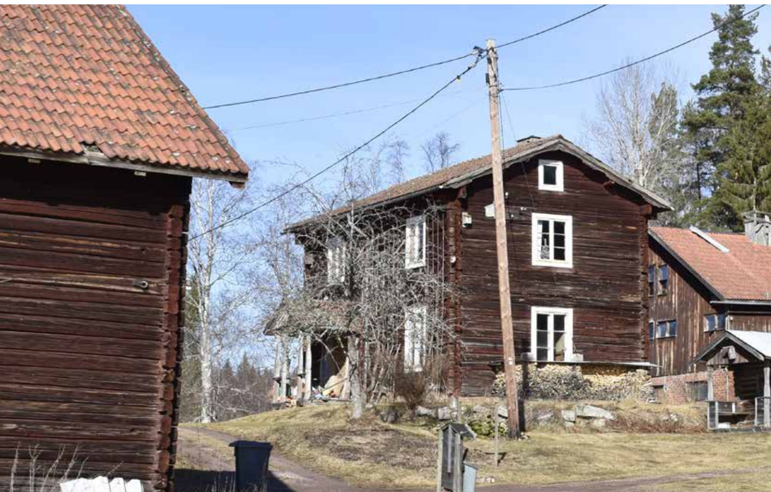
Välbevarad äldre enkelstuga om två våningar i Resargårdarna väster om Djura. Djura 1:6.