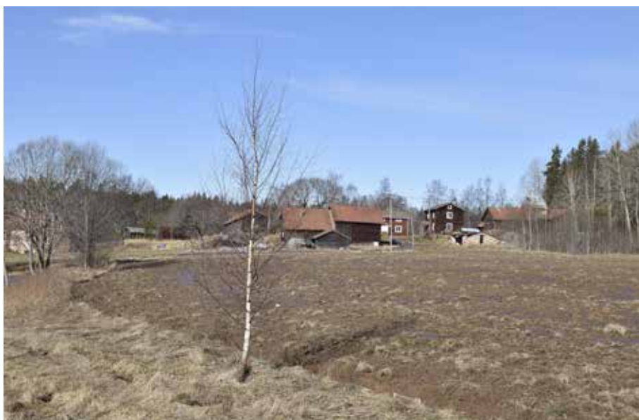
Åkermark vid Resargårdarna. Den öppna och hävdade odlingsmarken är mycket viktig för byarnas karkatär.