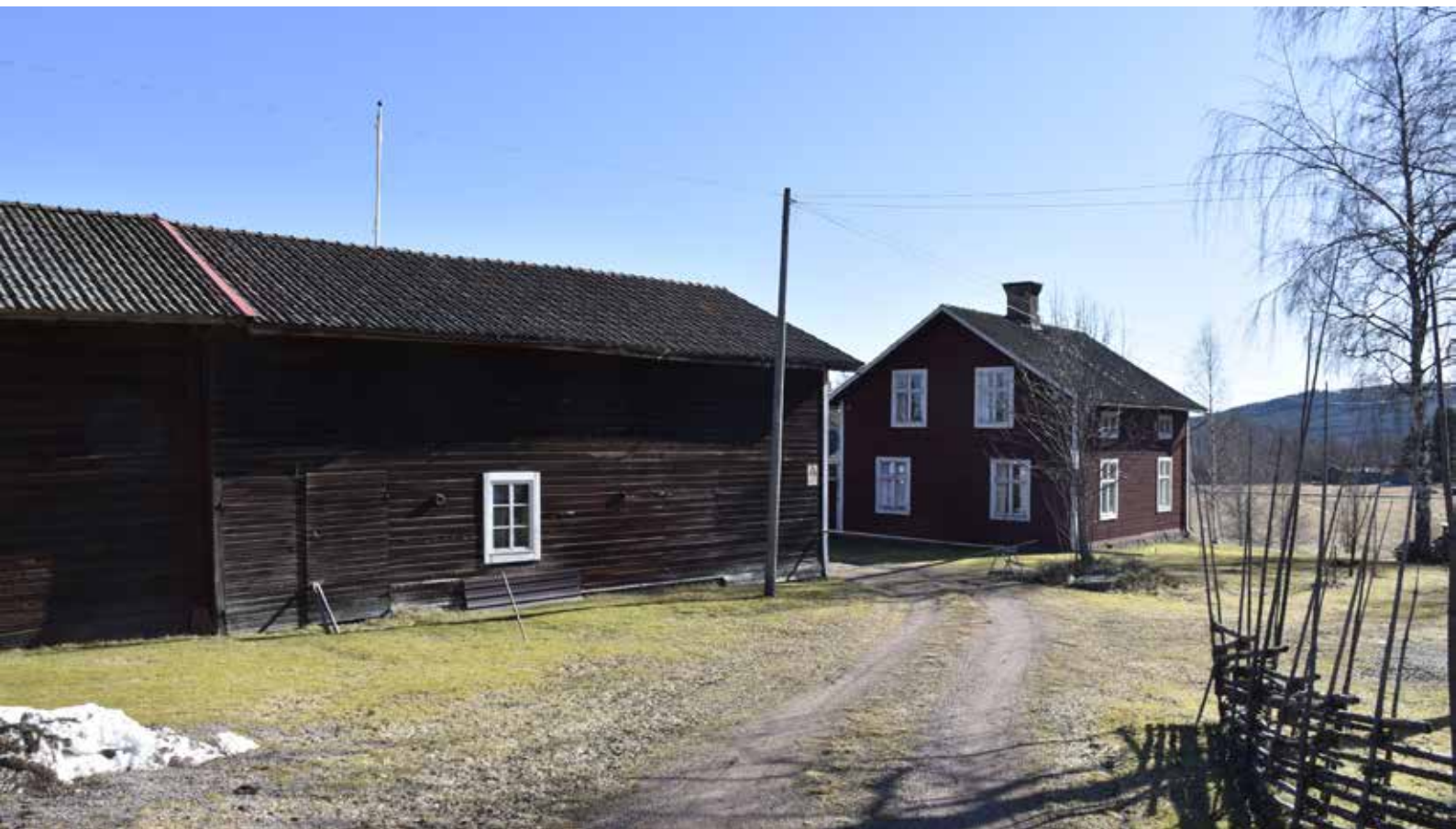
Korsplanshus och ekonomibyggnader på tidstypisk sen 1800-talsgård i Haggårdarna. Korsplanshuset är uppfört i timmer och kan berätta om hur timmerhuskulturen utvecklades under det sena 1800-talet och kring sekelskiftet år 1900. Djura 8:4.