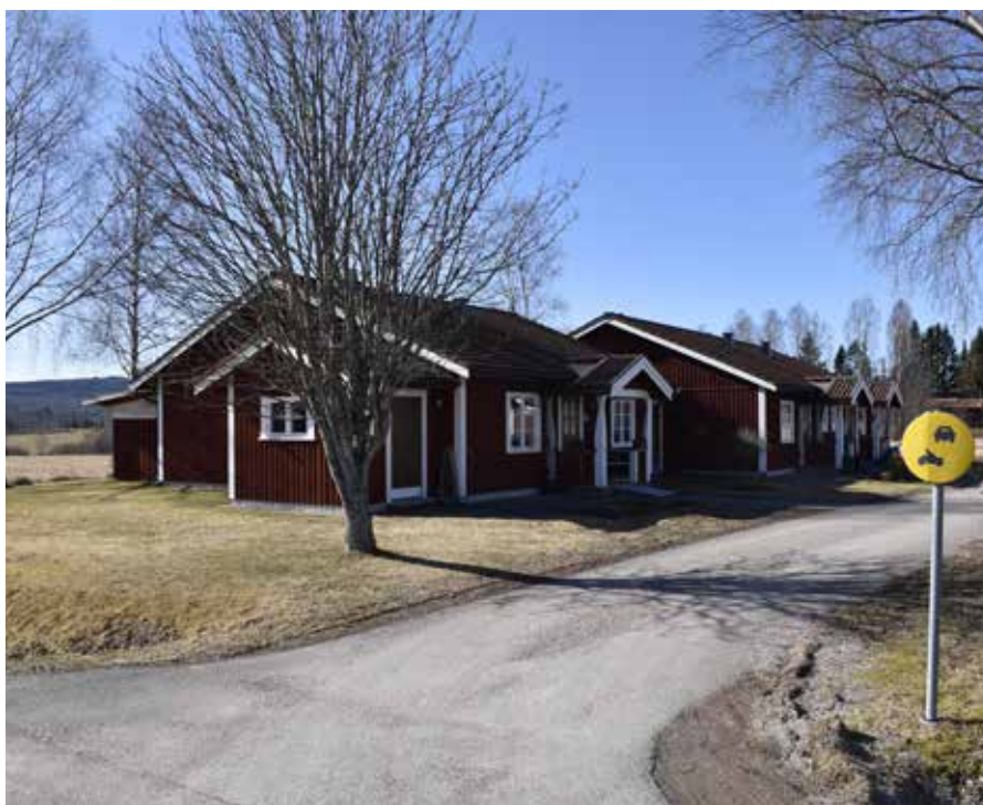
Parhus uppförda 1981 i anpassad stil i västra delen av Djurbyn. Djura 20:2.4