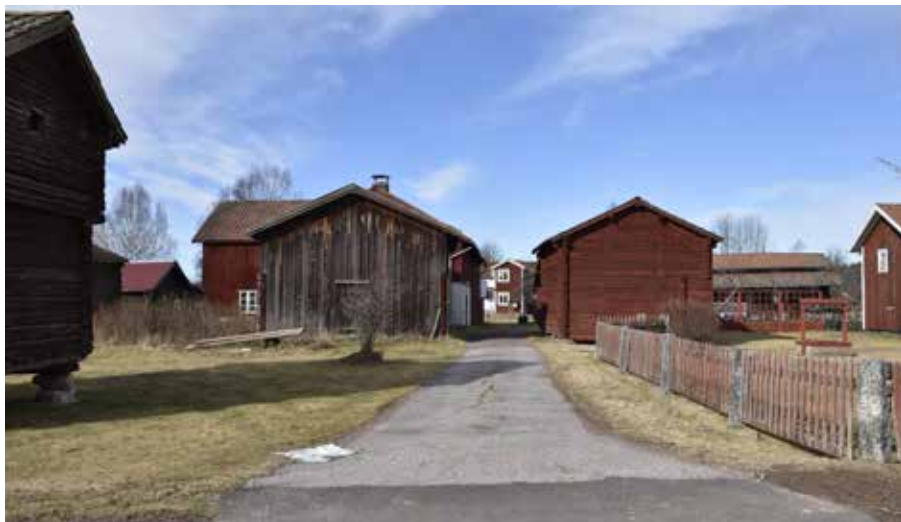
Tätt bebyggd mindre bygata som letar sig in i gytret av gårdar. Många tomter avgränsas av faluröda spjälstaket på granitstolpar. Djura 18:3 (höger) och 34:22 (vänster).