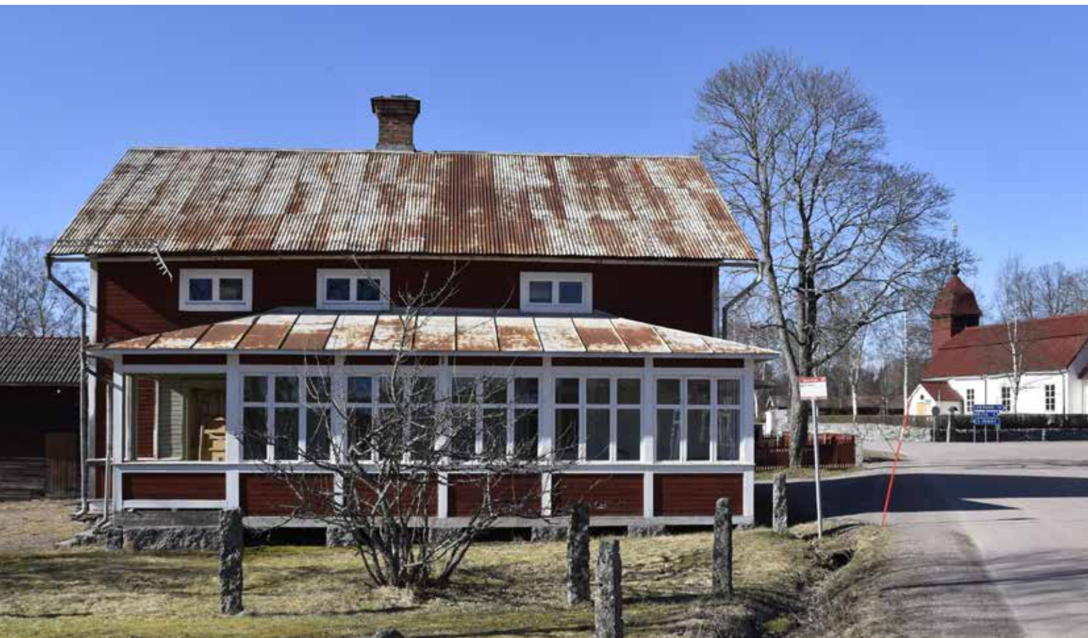
Före detta Hanses café med karaktäristisk glasveranda som har kuverttak. Byggnaden är i grunden ett korsplanshus. Djura 17:3.