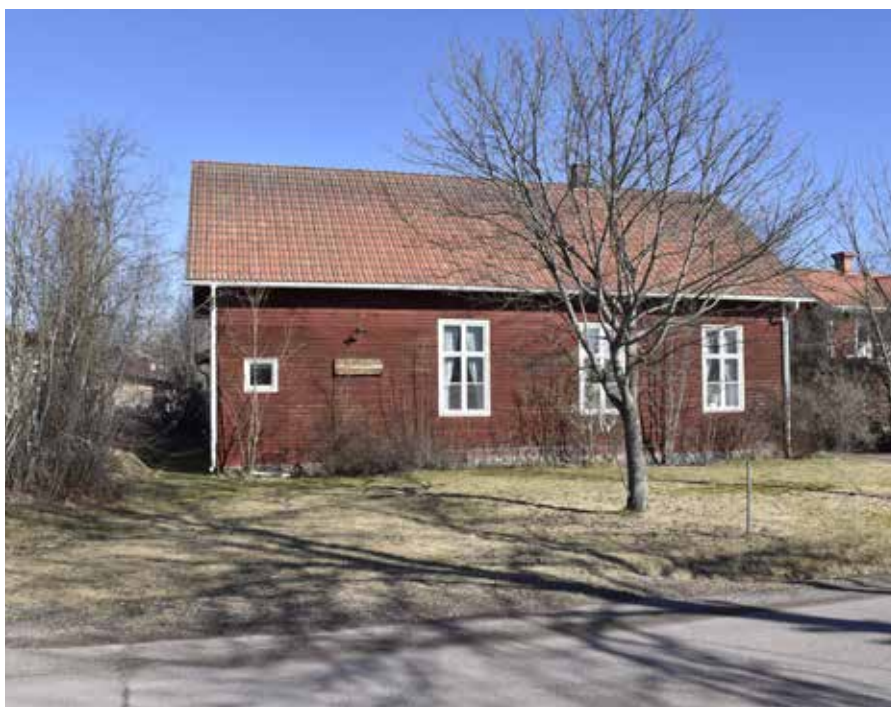
Vävstugan, före detta Beta- niakapellet ligger ett stenkast norr om missionshuset. Bygg- naden är något enklare till sin framtoning. Djura 6:23.