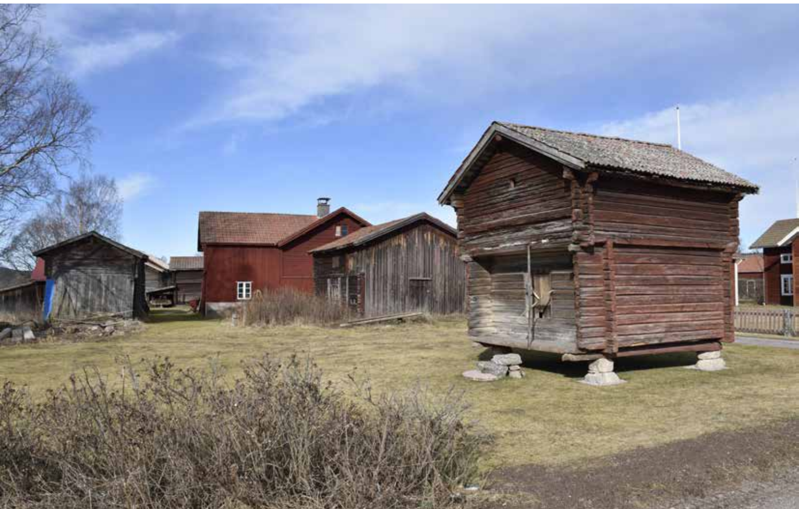
Ålderdomligt härbre med laggtak i södra delen av Djurbyn. Byggnaden är sannolikt flyttad till platsen. Djura 34:22.