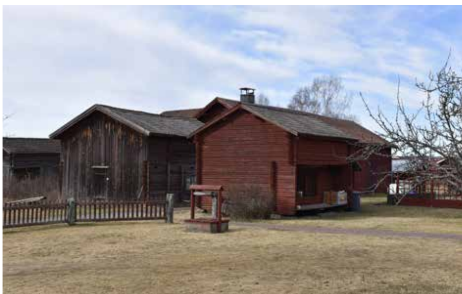
Den röda byggnaden är ett parhärbre som är beläget vid ett gårdstun i södra delen av Djurbyn. Djura 18:3.