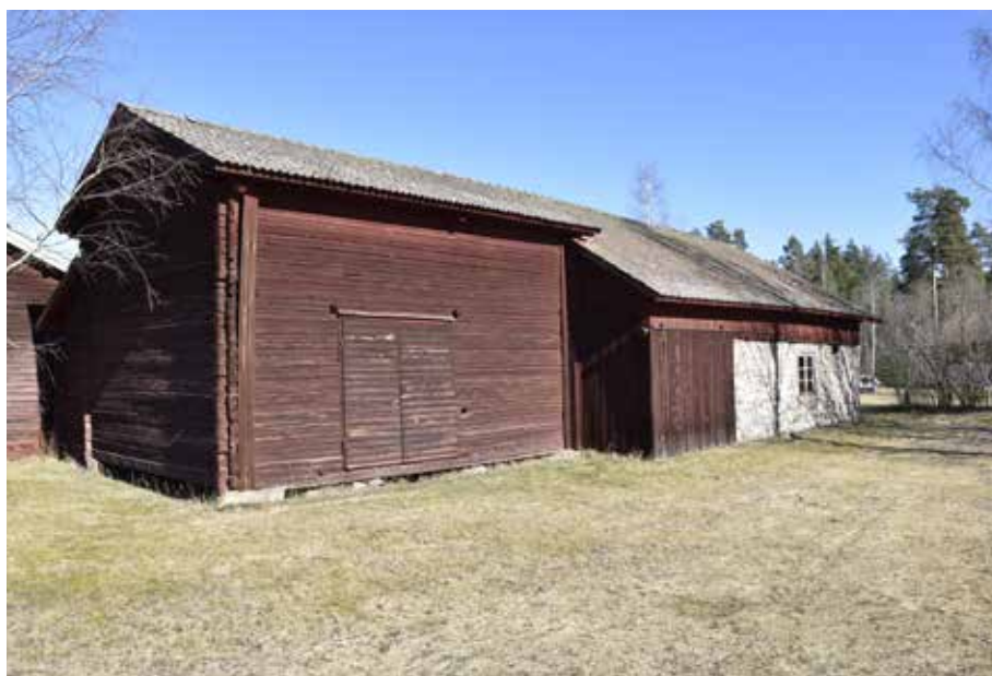
Länga med tröskloge och fäjs på helt fyrkantsbyggd gård i Djura. Djura 36:1.