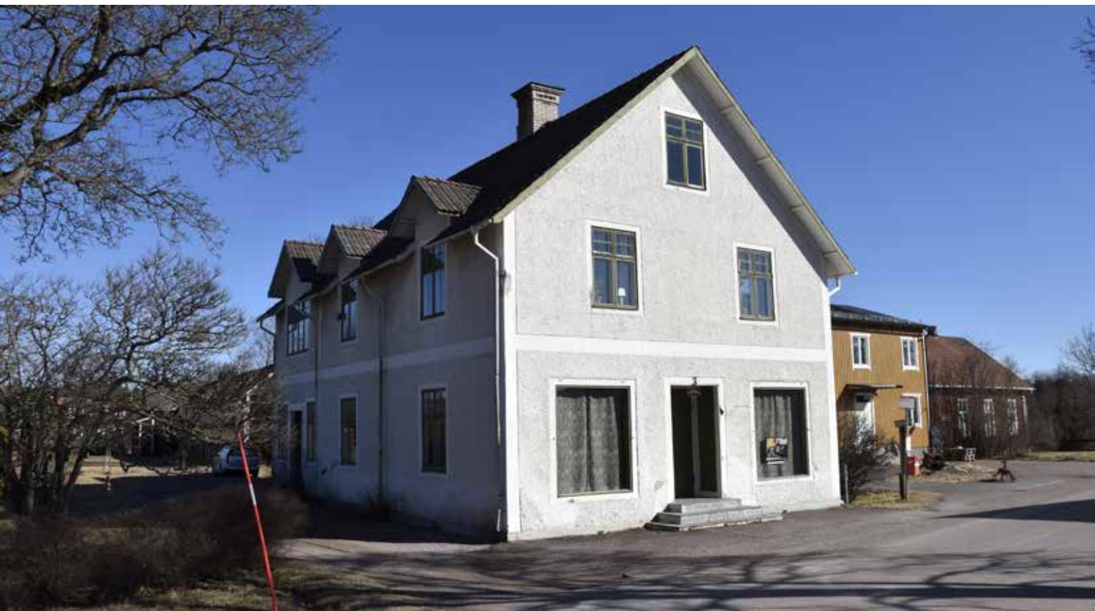
Malmes uppfördes som affärs- och bostadshus 1921. I bakgrunden till höger syns före detta Konsum, som dock genomgått en omfattande reovering under senare år och därför inte medtas i kulturmiljöprogrammet. Djura 36:3.