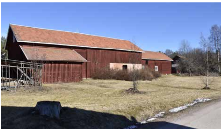
På vissa gårdar har mindre ekonomibyggnader ersatts av stora ladugårdskomplex företrädesvis från sekelskiftet år 1900 och framåt. Djura 33:6.