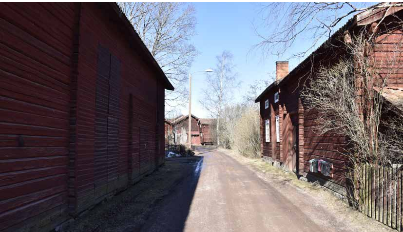
Norr om Djura kapell sluter sig bebyggelsen mot bygatan på ett sätt som är mycket karaktäristiskt för byarna i Leksandsbygden. Djura 34:25.