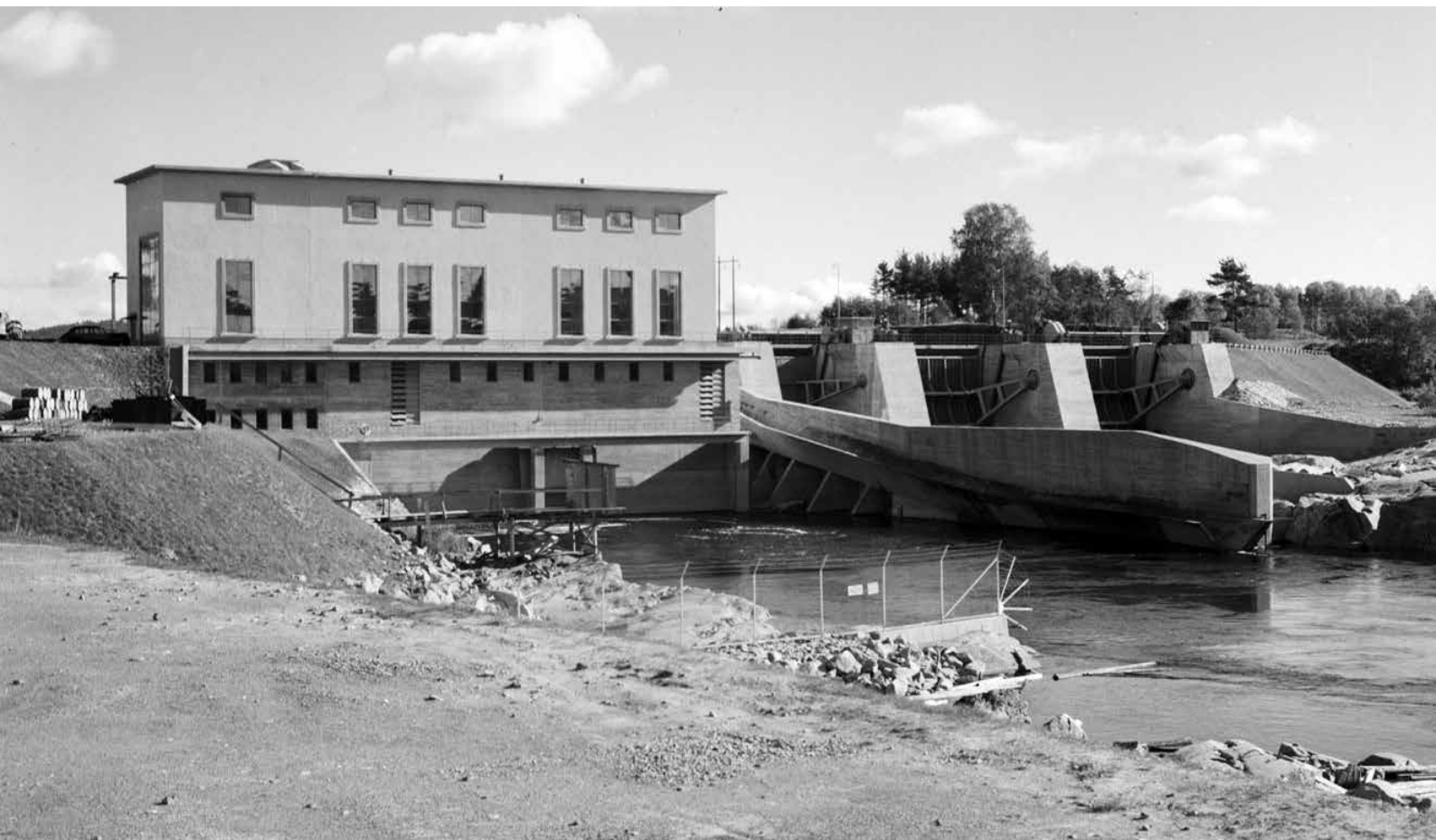
Gråda kraftstation vid uppförandet 1948-1951. Anläggningen byggdes av Stora Kopparbergs Bergslags Aktiebolag i tidstypisk och påkostad funktionalistisk stil.