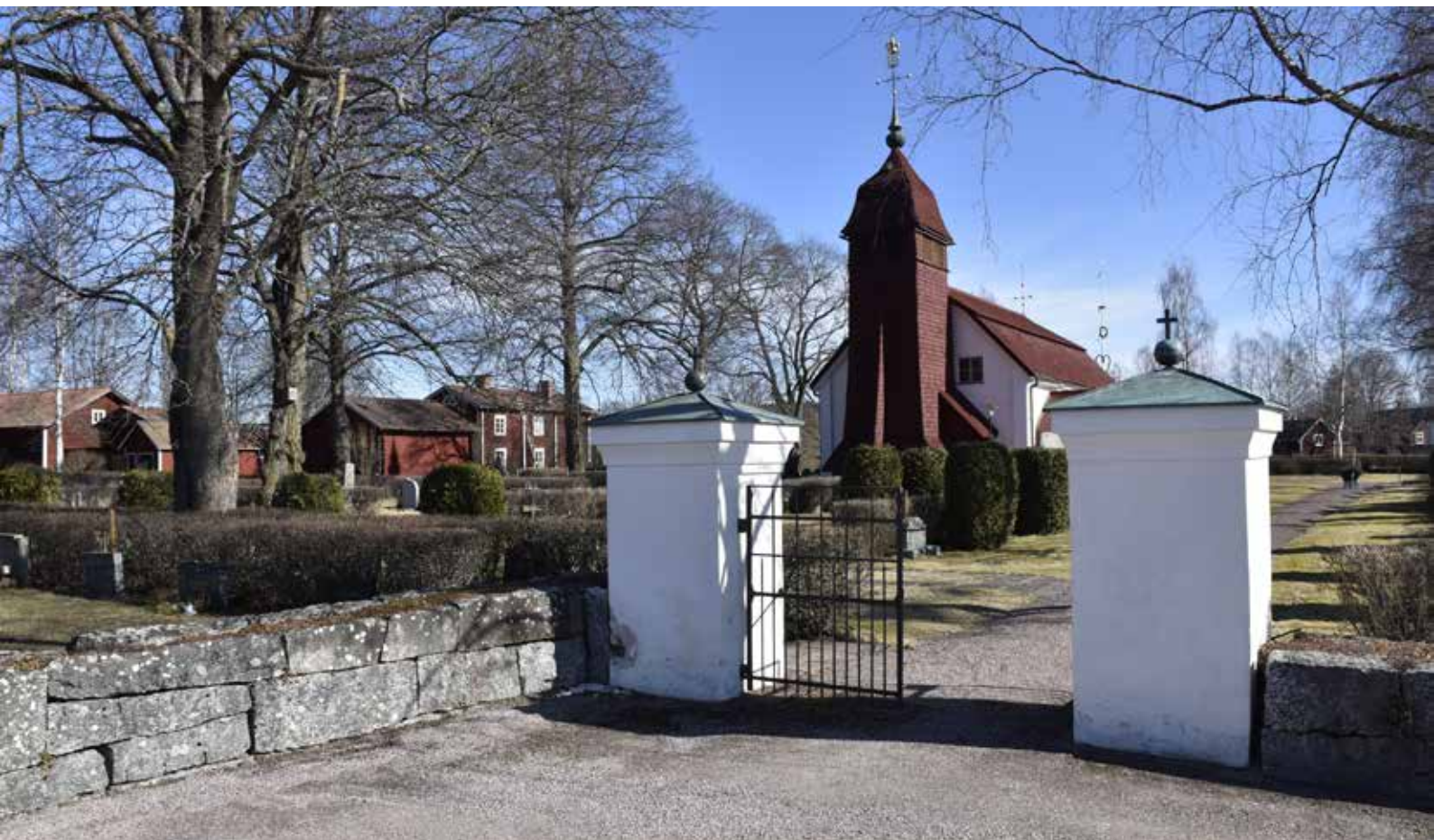
Djura kapell med sitt framträdande spåntäckta torn och kyrkogården i förgrunden. Kyrkobyggnaden fick sin nuvarande utformning vid en omgripande renovering 1780. Djura 58:I.