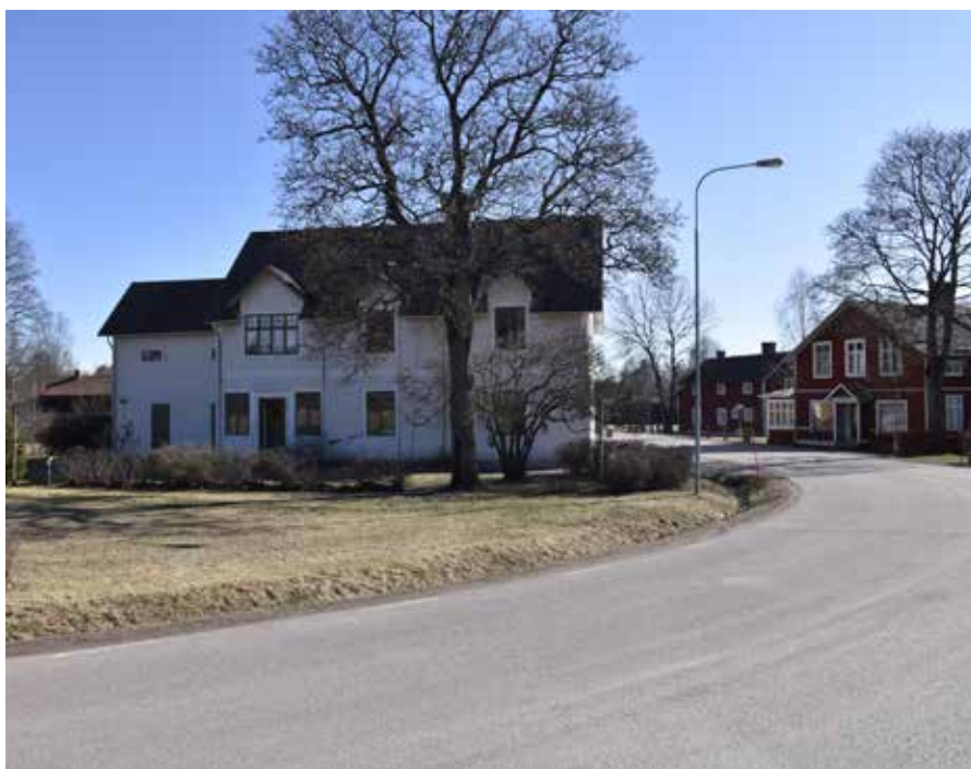
Utsnitt från korsningen öster om Djura kapell, där Malmes och Hanses café syns.