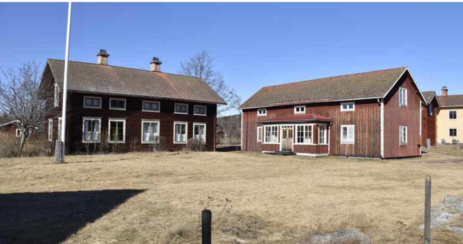
Till vänster syns den välbevarade och karaktäristiska salsbyggnaden på Klockargården eller Sjöns. Byggnadens ingång har flyttats till motsatt sida. Djura 10:25 (vänster) och Djura 10:16 (höger).

livet i Djura kapellag i äldre tider. Värdet förstärks av att anläggningen är välbevarad och har höga utformningsmässiga kvaliteter.