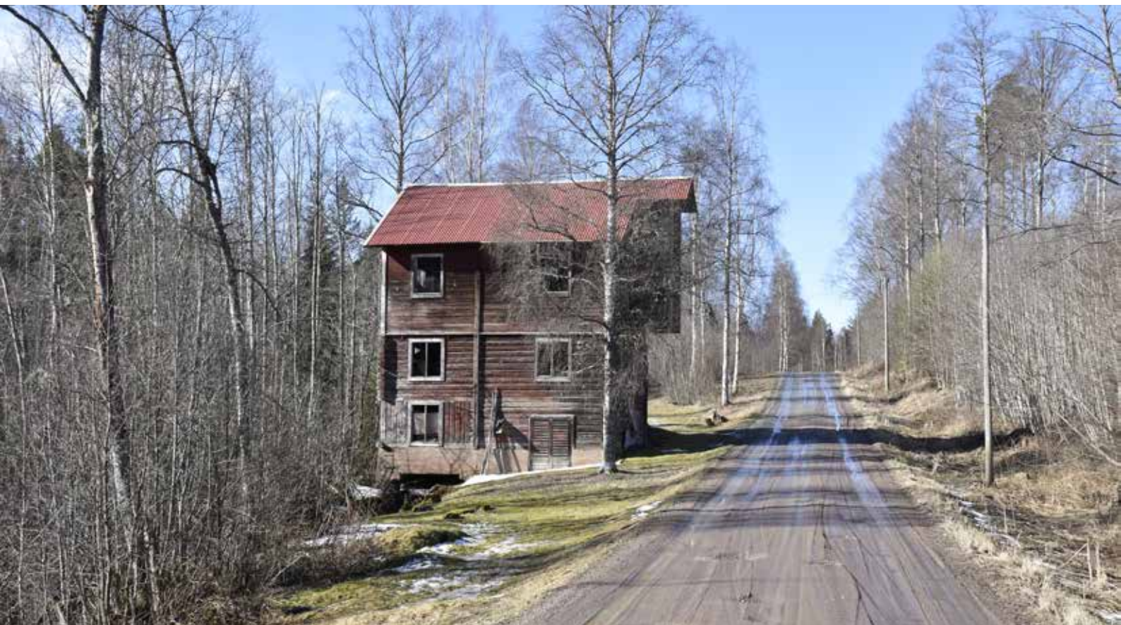
Hyttornas (hytto) kvarn väster om Resargårdarna. Byggnaden uppfördes under 1850-talet och kan berätta om spannmåls- hanteringen i Djurabygden historiskt. Djura 53:12.