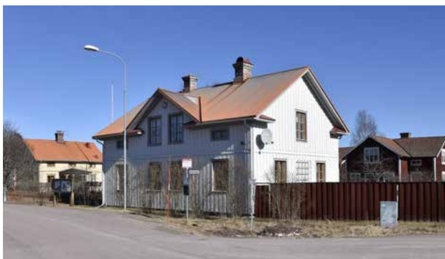
Salsbyggnad eller dubbelkorsplanshus i Djur-Heden. Hus- och gårdstypen blev vanlig först under 1800-talets senare hälft. Djura 3:7.