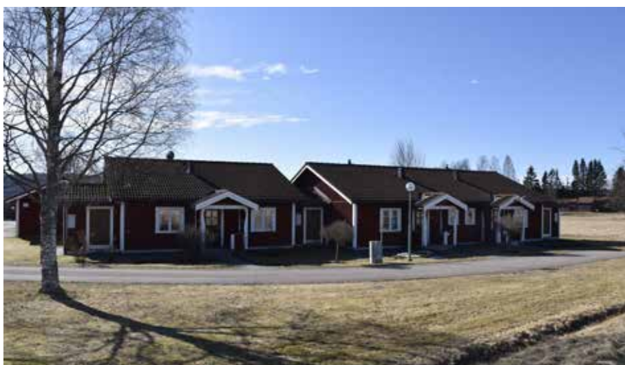
Anpassad parhusbebyggelse i västra delen av Djurbyn. Djura 20:2.