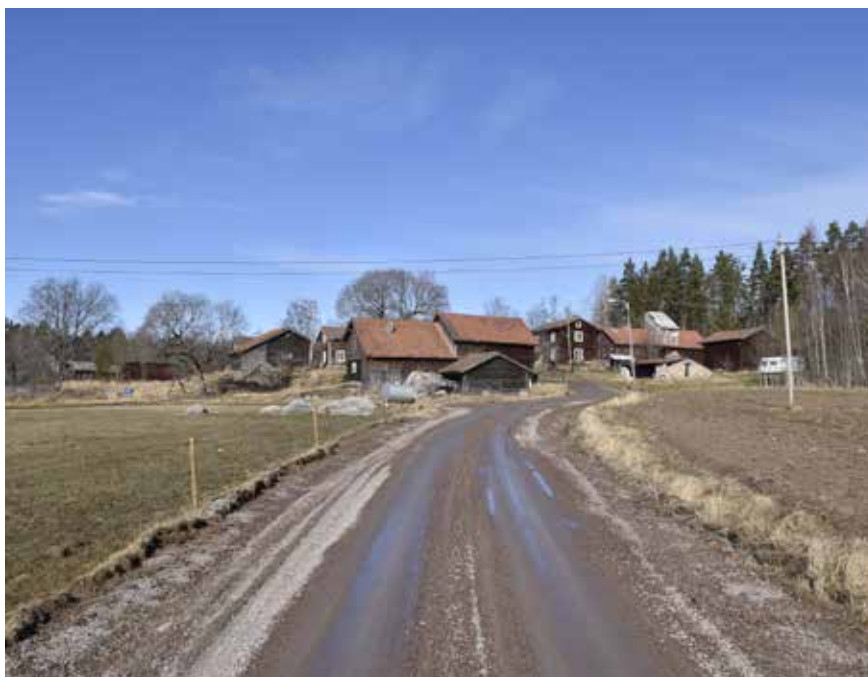
Gårdsklungan Resargårdarna med två tätt bebyggda och omfattande gårdar. Bebyggelsen är belägen på en höjd i landskapet - en hol. Djura 1:6 och 1:13.