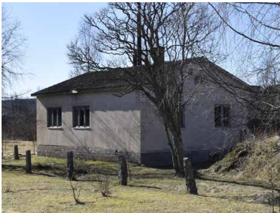
Söder om caféet finns Hanses före detta bageri, en funktionalistisk byggnad som är mycket välbevarad med detaljer tidstypiska för tiden kring 1900-talets mitt. Djura 17:3.