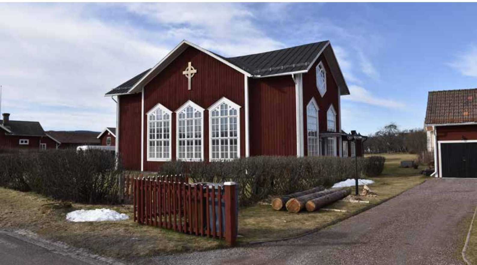
Missionshuset i södra delen av Djurbyn. Byggnaden är mycket karkatärisk med bland annat spetsbågiga småsprösjade fönster som är typiska inom det sena 1800-talets frikyrkoarkitektur. Djura 11:11.