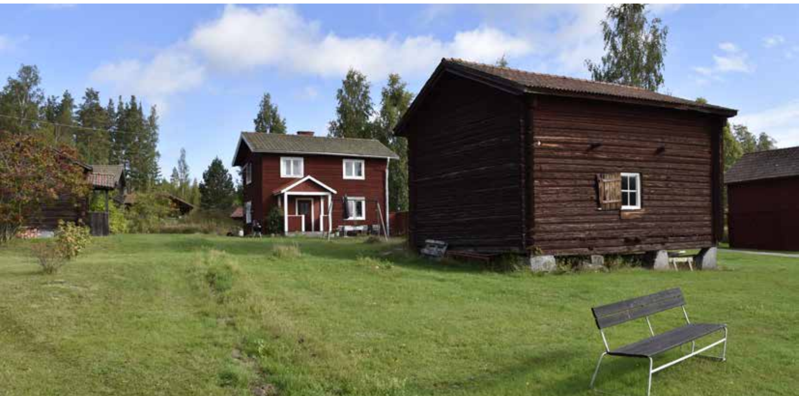
Enkelstuga som påbyggts med en våning och moderniserats med nya fönster kring 1900-talets mitt. Tröskloge på plintar närmast i bilden. Gråda 14:2.

Kringbyggd gård med ålderdomliga timmerhus. längst upp från vänster: hölada, parstuga (bostadshus), långsideshärbre, källarstuga, loftbyggnad med portlader, vagnsbod sammanbyggd med kortsideshärbre, tröskloge, brunn, stall, torkhus, smedja, lada och fähus med portlader och dyngstad.