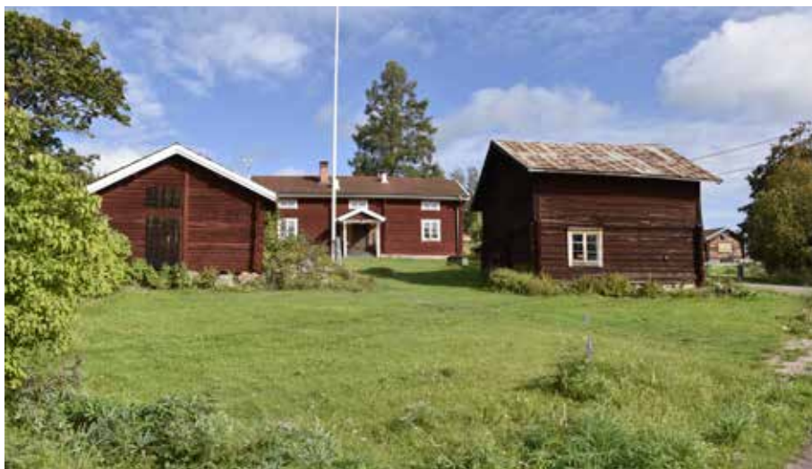
Enkelstuga som påbyggs till en parstuga vid ett kringbyggt gårdstun. Gården har sannolikt varit helt kringbyggt. Gråda 7:12.