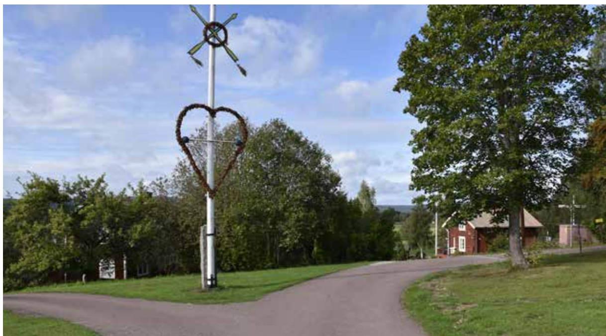
Majstångsplats vid trevägskorsning intill en öppen yta mitt i byn.