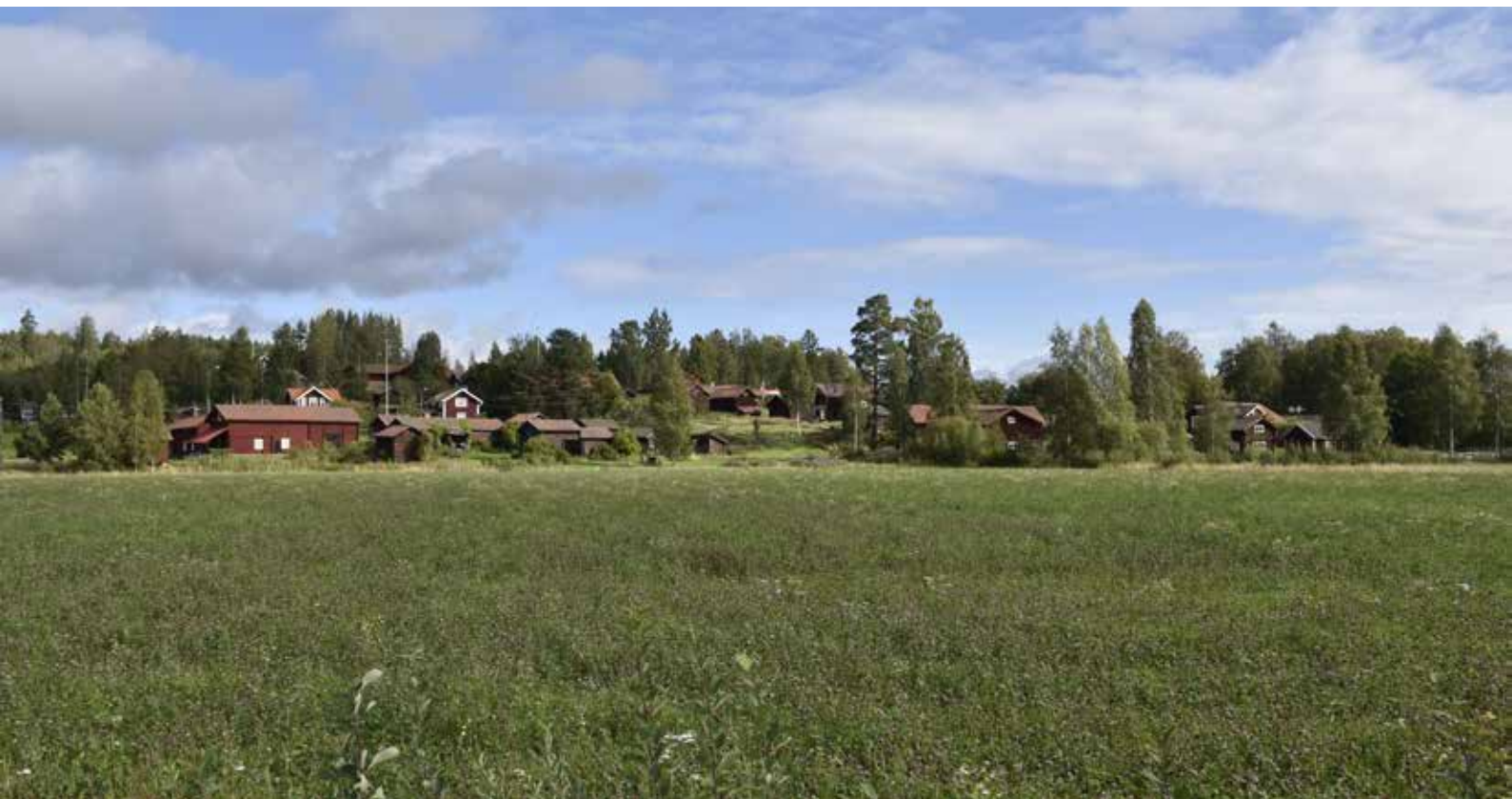
Bebyggelsen i Gråda från söder. Byn är belägen i en solig sydsluttning.