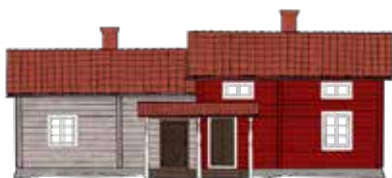
Parstugor i Djurabygden