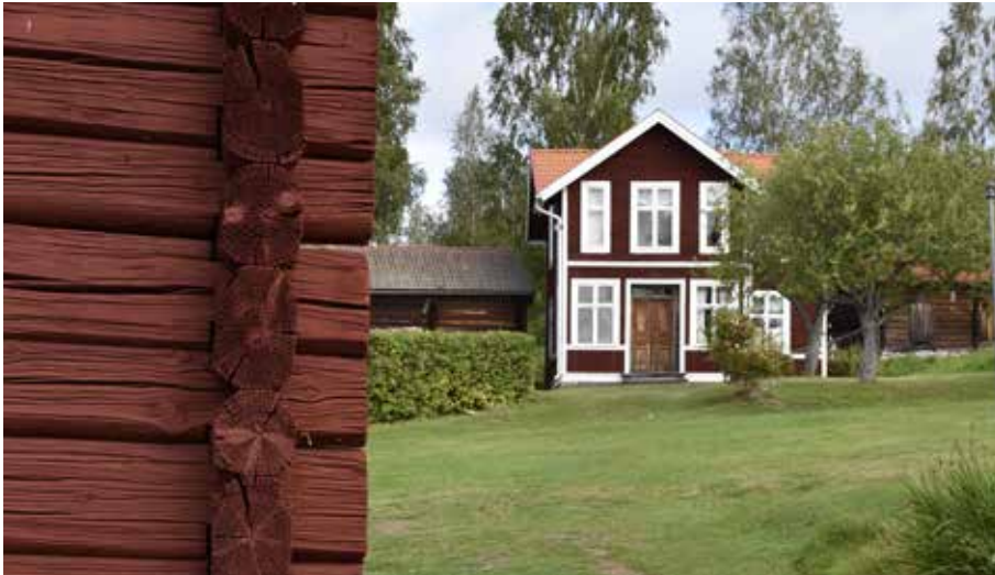
Glasverandakallfarstu på enkelstuga som påbyggs med en våning. Verandan är sannolikt tillkommen kring sekelskiftet år 1900. Gråda 10:8.