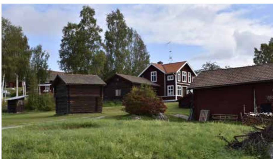
Two motställda enkelstugor där den borte försetts med en extra våning och en stor glasveranda/kallfarstu. Gråda 10:8.