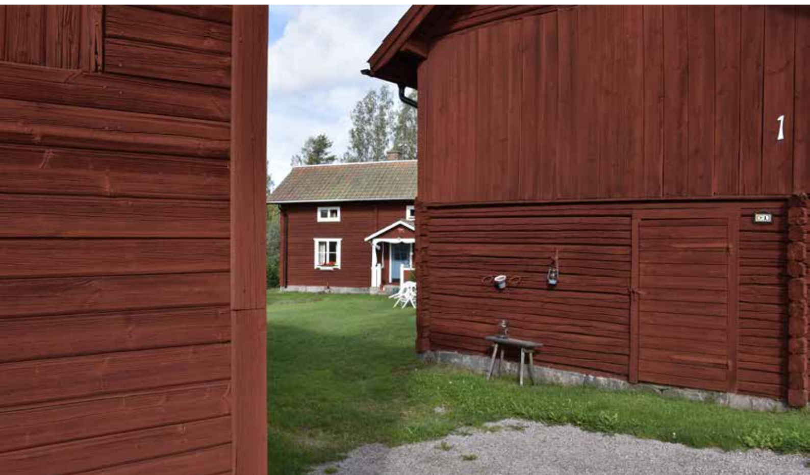
Tät och sluten bebyggelse mitt i byn. Gården är inte helt kringbyggd men har sannolikt varit det i äldre tider. Gråda 16:8.