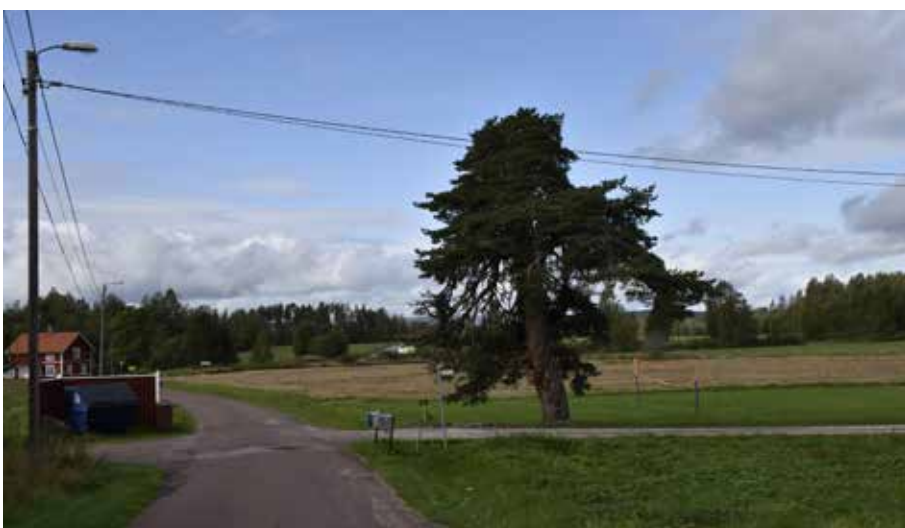
Gärdstallen sydväst om byn. Landskapet bortom är öppet och hävdad.