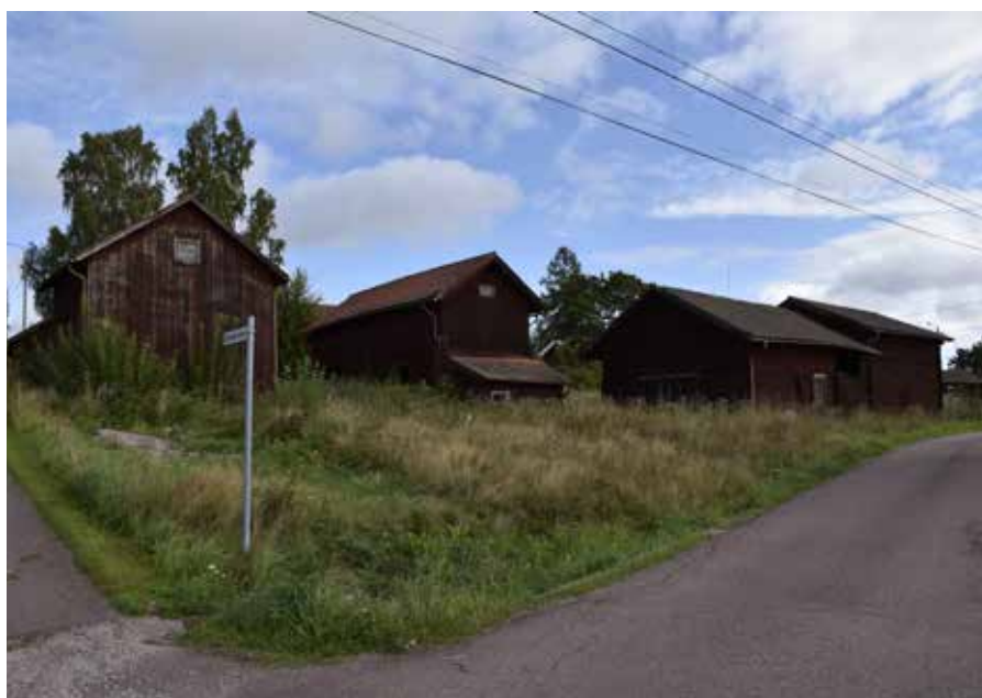
Den kringbyggda Carisgård- den med bodar, stall, timrvat fäjs och tröskloge. Gråda 15:3.