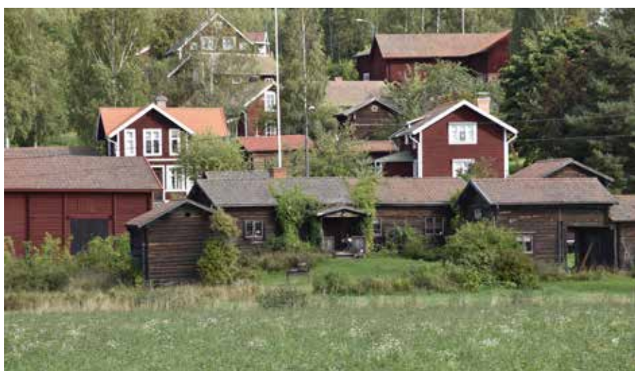
Two enkelstugor som sammanbyggs till ett stort hus med entré via en farstuvist lätt förskjuten från byggnadens mitt. Byggnaden har blysprösjade fönster och har en ålderdomlig karaktär. Gråda 2:19.