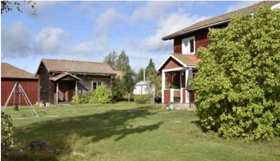
Två enkelstugor varav den vänstra är mycket ålderdomlig, i en våning med farstuvist som har en typiskt enkel utformning. Till vänster, Gråda 14:6. Till höger, Gråda 14:2.