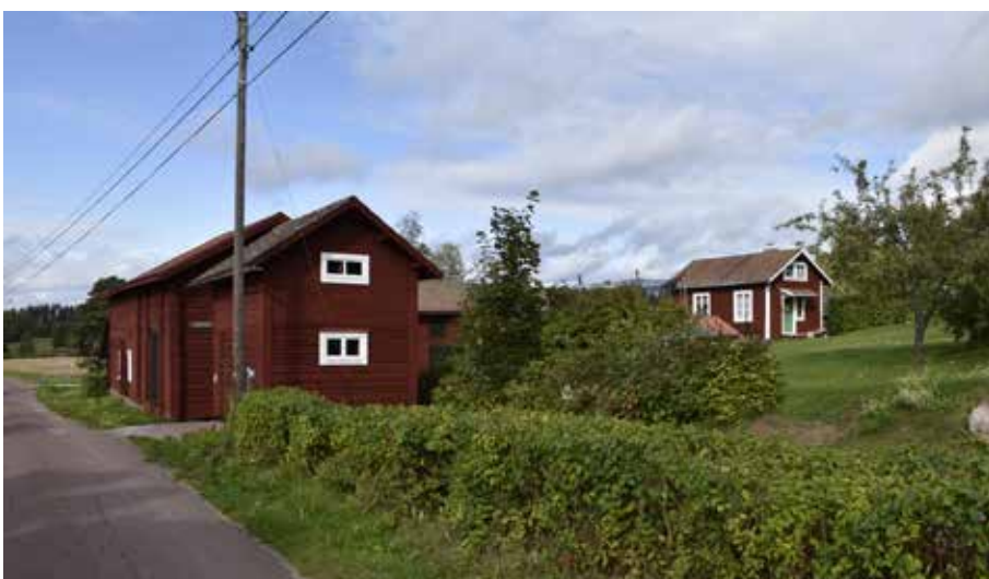
Delvis kringbyggt gårdstun med nyare timmerhus och till höger i bilden en källarstuga. Gråda 10:9.