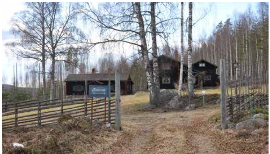
Nationalromantiskt sommarnöje på Grådaberget - Gussarvet. Byggnaderna är karaktäristiska för nationalromantiken i Leksand. Gråda 7:16.