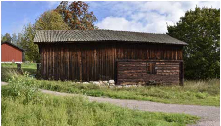
Lada och tröskloge (till höger) vid ett äldre gårdstun. Liknande byggnader bidrar starkt till bymiljöns täta och slutna karaktär. Gråda 7:3.