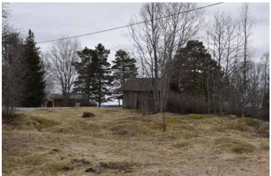
Överallt i byn finns små faluröda eller grånade timmerhus som kan berätta om timmerhuskulturen och månghussystemet. Fastigheten Almbergsbjörken 2:3.