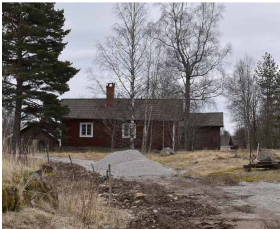
Ålderdomlig sidokammarstuga på fäbodgården Arvids, fastigheten Hälla 13:12.