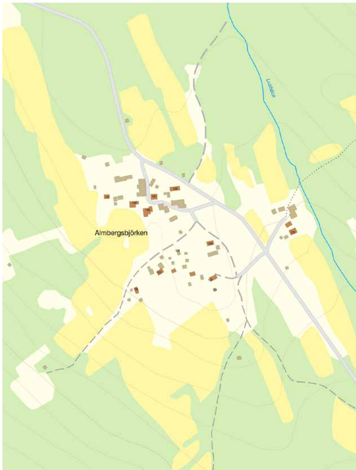
Byn Almbergsbjörken är belägen nordväst om byn Almberg och sydöst om byn Böle. Bebyggelsen koncentreras till en avsats omgiven av sluttande öppen och hävdad betes- och odlingsmark.