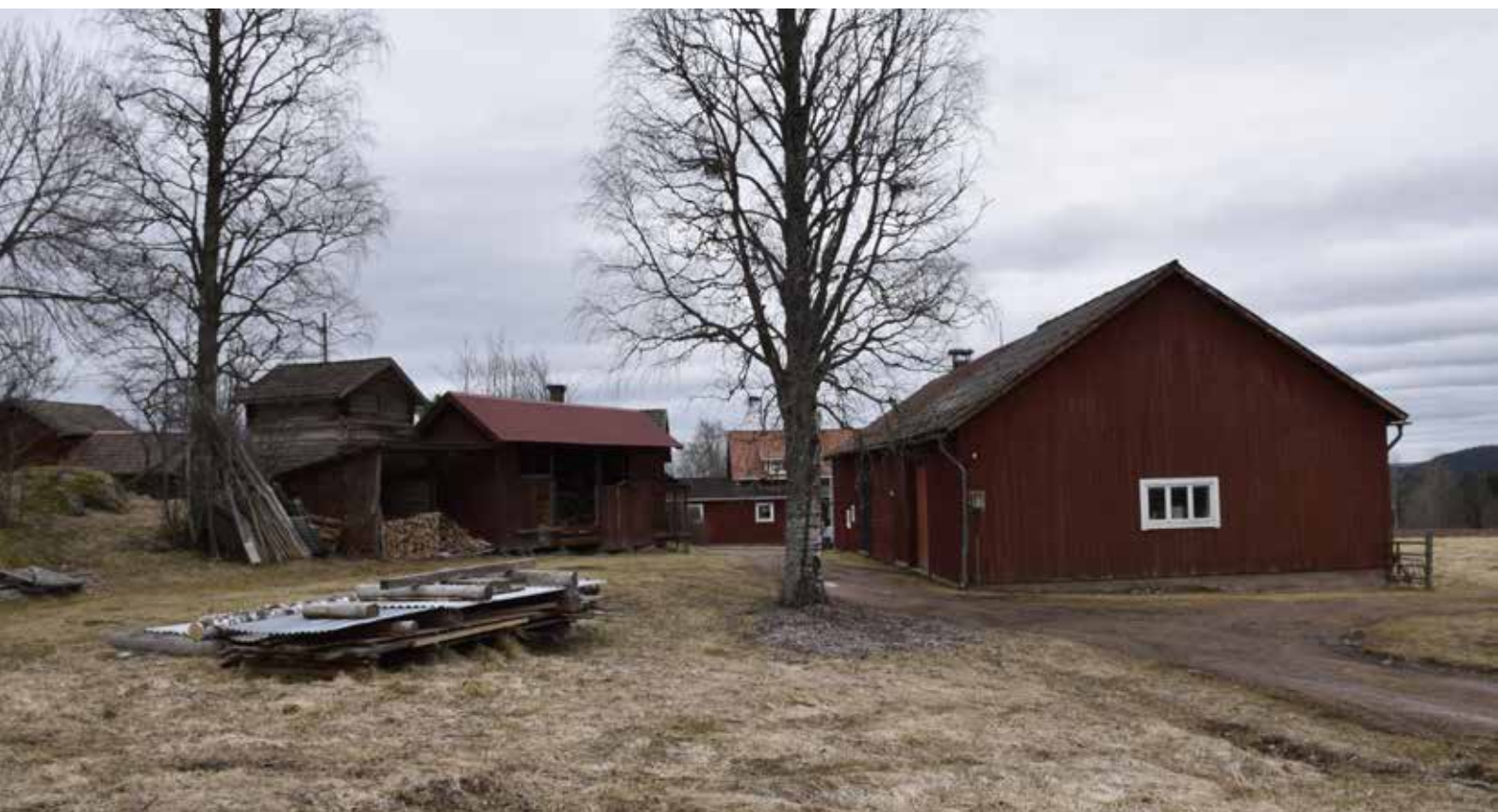
Gytter av faluröda och ofärgade byggnader i den norra delen av byn.