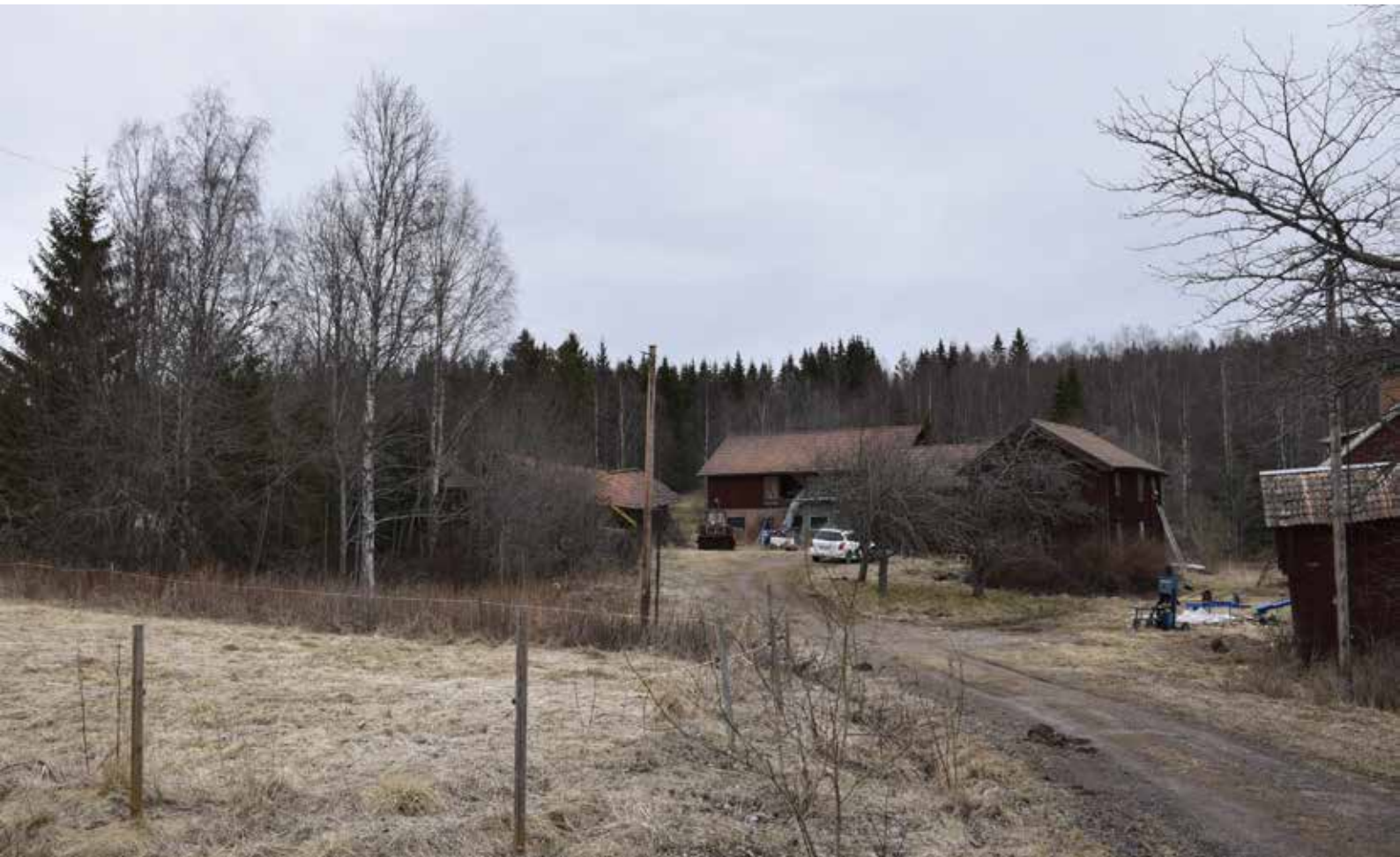
Kringbyggd gård på fastigheten Almbergsbjörken 7:6 i den östra delen av byn. Gården var tidigare fyrkantsbyggd. Manbyggnaden är en ålderdomlig parstuga.