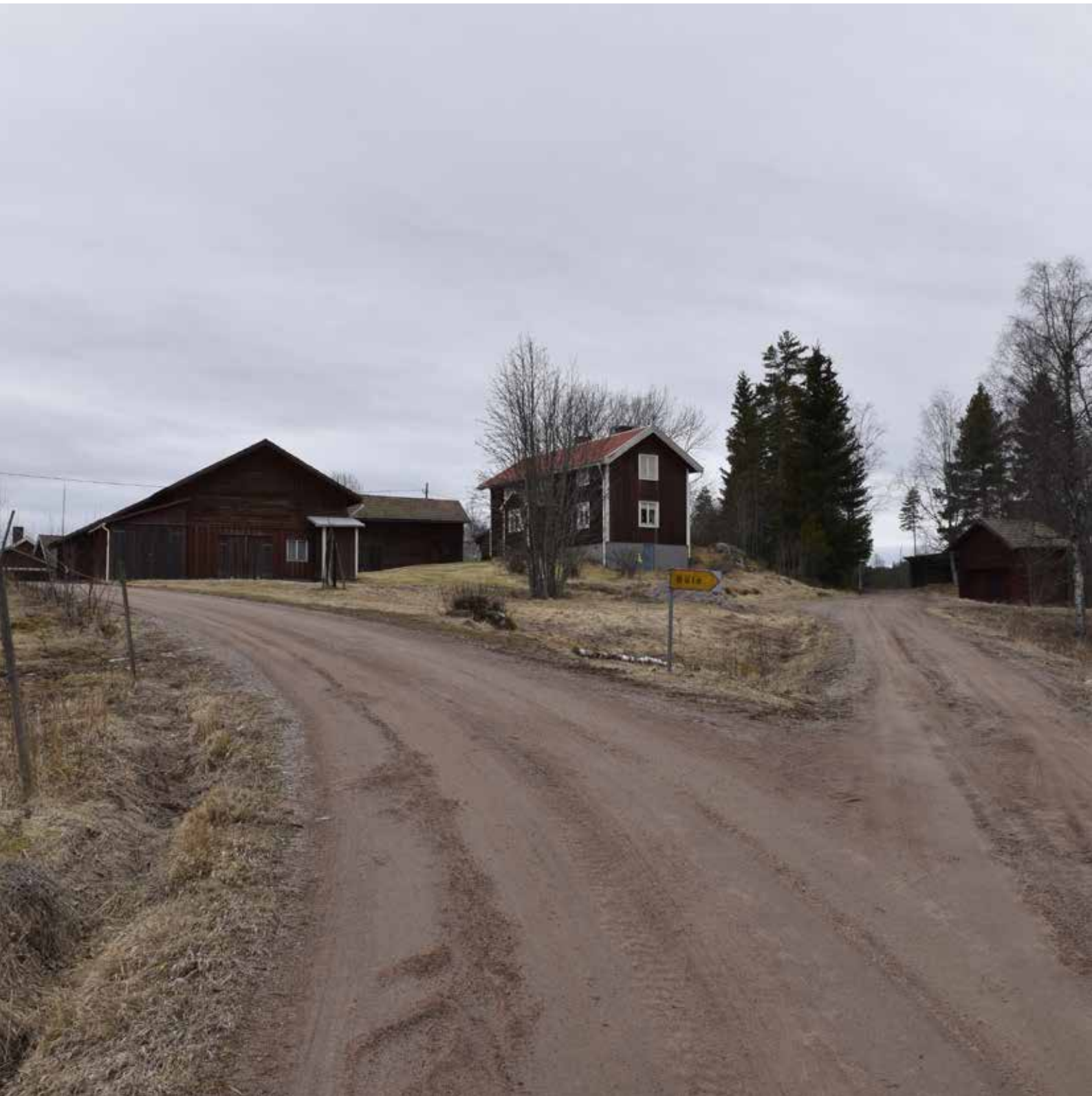
Back Mases på fastigheten Almbergsbjörken 5:3 anses vara en av de äldsta gårdarna i byn. Den var förut kringbyggd på alla fyra sidor.