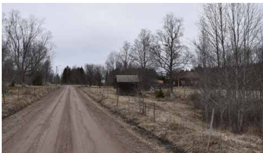
Ovan, utsikt mot de öppna och hävdade odlingslandskapen mellan två ekonomibyggnader. Mitt i blickfånget syns ett ålderdomligt naturligt gränat härbre beläget på fastigheten Almbergsbjörken 2:3.