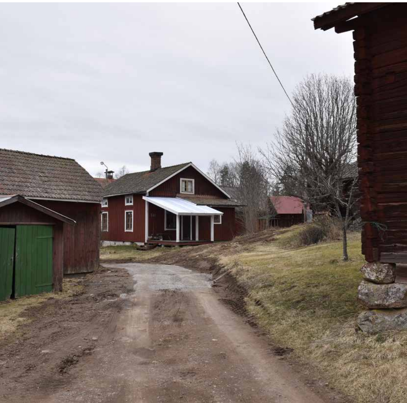
Korsplanshus på fastigheten Almbergsbjörken 2:4. Byggnaden är sannolikt tillkommen under det sena 1800-talet och är belägen i den norra delen av byn, där gårdarna står som tätast intill varandra och byvägen. Det faluröda gyttret av trähus är värdefullt och typiskt för Leksand och Övre Dalarna.