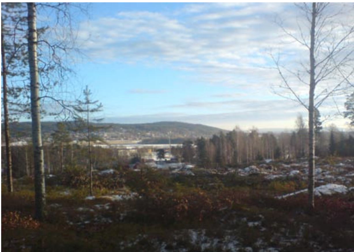
Utblick mot Limsjön

Planprogrammet omfattar den obebyggda, södra delen av Käringberget. Området ligger ca 1 km norr om Leksands Norets centrala delar. Den totala arealen är ca 4,9 ha.