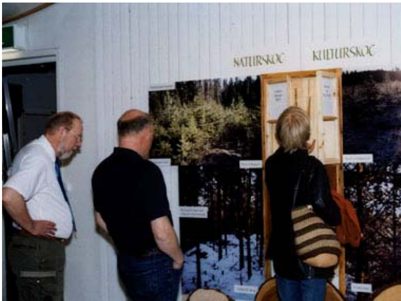
Del av den lokalproducerade utställningen 60e breddgraden.