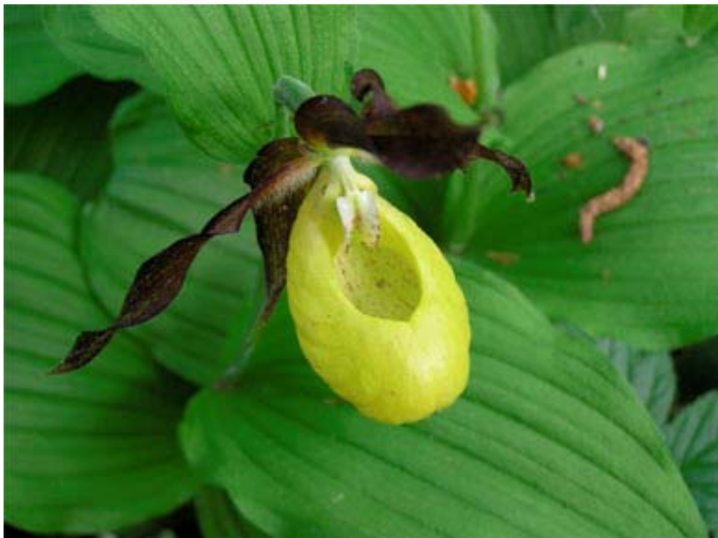
Guckusko är en fantastisk orkidé, som finns på några platser i Leksandsskogen.

Temakvällarna var resultatet av ett lyckat samarbete mellan byalag och intresseföreningar, Skogsstyrelsen, Studiefrämjandet, Miljökontoret, Leksands Kultur- och fritidsförvaltning, Samhällsbyggnadskontoret, Dalarnas museum, Fågelklubben, Naturskyddsföreningen, Friluftsförbundet och Jägareförbundet.