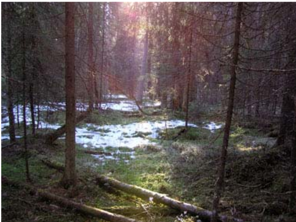
Ilpos skifte, vid vägskalet mot Ljusbodarna, hyser såväl natur- som kulturvärden.

Temakvällarna ute i byarna var en mycket lyckad satsning och ett fantastiskt fint samarbete mellan de ansvariga. Att komma ut till folk och berätta och diskutera deras närmiljö gav en direkt och demokratisk kontakt mellan kommunen, Skogsstyrelsen och Studieförbundet och folket i byn. Programmens upplägg med en blandning av fornlämningar, djur och natur samt bebyggelse fungerade utmärkt där de olika delarna kompletterade helheten och bilden av byn. Intresset har varit stort och lett till många kontakter mellan byborna och föredragshållarna. Flera nya fornlämningar har registrerats och studiecirkel startats. Varje by fick en pärm med kartor över byns fornlämningar och de bilder som togs av bebyggelsen lämnades över till respektive by. Föredragshållarna har också upplevt att de lärt sig mycket från varandras områden vilket också är ett positivt resultat. Media har visat stort intresse för de olika projekten och ett 20-tal artiklar har skrivits om de olika inslagen.