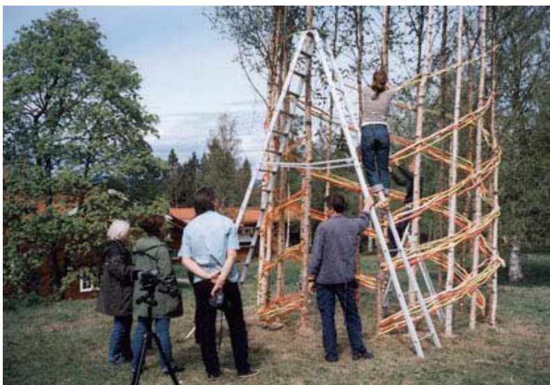
Riksställningars workshop på Sätergläntan maj 2004.