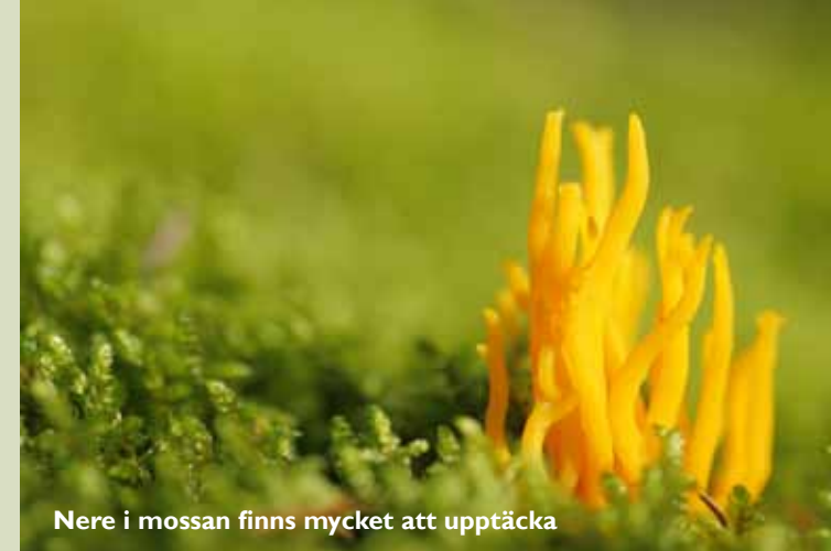
Nere i mossan finns mycket att upptäcka

Åhlmans Olof Olssons Minnesskog är en hektar stort. Skogen skänktes av Simon Åhlman till dåvarande Åhls kommun under 1940-talet. 1992 bildade Leksands kommun naturreservat.