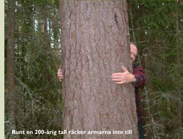
Runt en 200-årig tall räcker armarna inte till