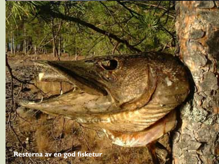
Resterna av en god fisketur