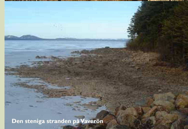
Den steniga stranden på Vaverön