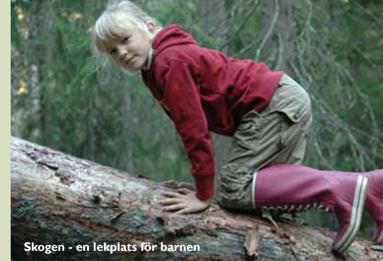
Skogen - en lekplats för barnen

Reservatet är ca 1 hektar stort och består av barrskog. Omgivningen består främst av hyggen och ungskog.