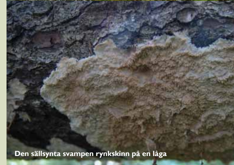
Den sällsynta svampen rynkskinn på en låga