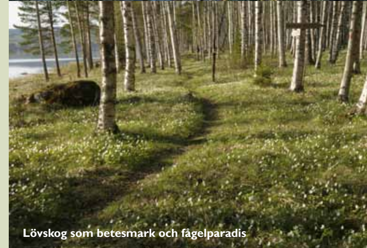
Lövskog som betesmark och fågelparadis