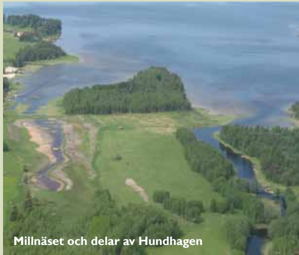
Millnäset och delar av Hundhagen

Industriområdet som blivit fågelparadis! Hundhagen och Millnäset är två landtungor som leder ut i Insjön. Mellan Millnäset och Hundhagen rinner Helgboån. Brenäsviken, väster om Millnäset, har grävts ur och restaurerats som våtmarksområde. Från ett fågeltorn får du fin överblick över området.