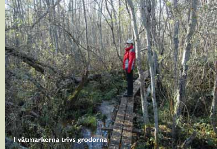
I våtmarkerna trivs grodorna

Hundhagens naturreservat är 109 hektar stort och består av 49 hektar vatten, 30 hektar lövskog, 10 hektar hagmark och 20 hektar åker. Markägaren Leksands kommun bildade naturreservat 1994.