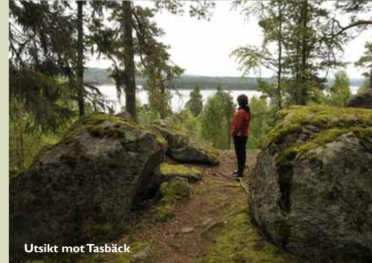
Utsikt mot Tasbäck