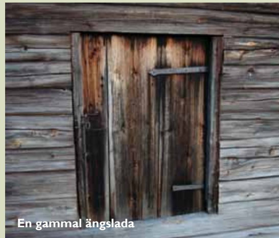
En gammal ängslada

Åk från Leksand mot Siljansnäs. I Grytnäs sväng vänster mot Alvik. Strax innan Alvik skyltat mot Storön.