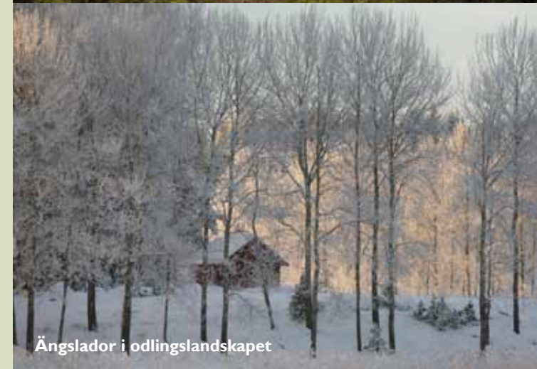
Ängslador i odlingslandskapet