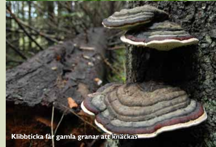
Klibbticka får gamla granar att knäckas