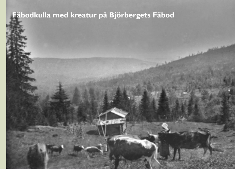
Fäbodkulla med kreatur på Björbergets Fäbod

Naturreservatet Stora Granen är 0,7 hektar stort och består av gammal granskog. Stiftelsen Leksands Naturvårdsfond har genom markinlösen möjliggjort att skogen skyddats som naturreservat.