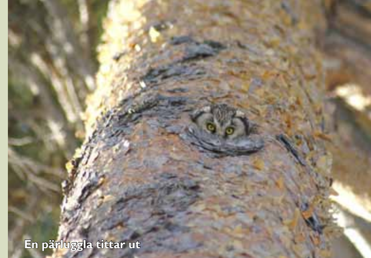
En pärluggla tittar ut

Naturreservatet Storheden är ca 4 hektar stort och består av barrskog. Skogen har långt tidigare nyttjats för skogsbruk. Skogen ägs av Leksands kommun och ingår i ett betydelsefullt friluftsområde.