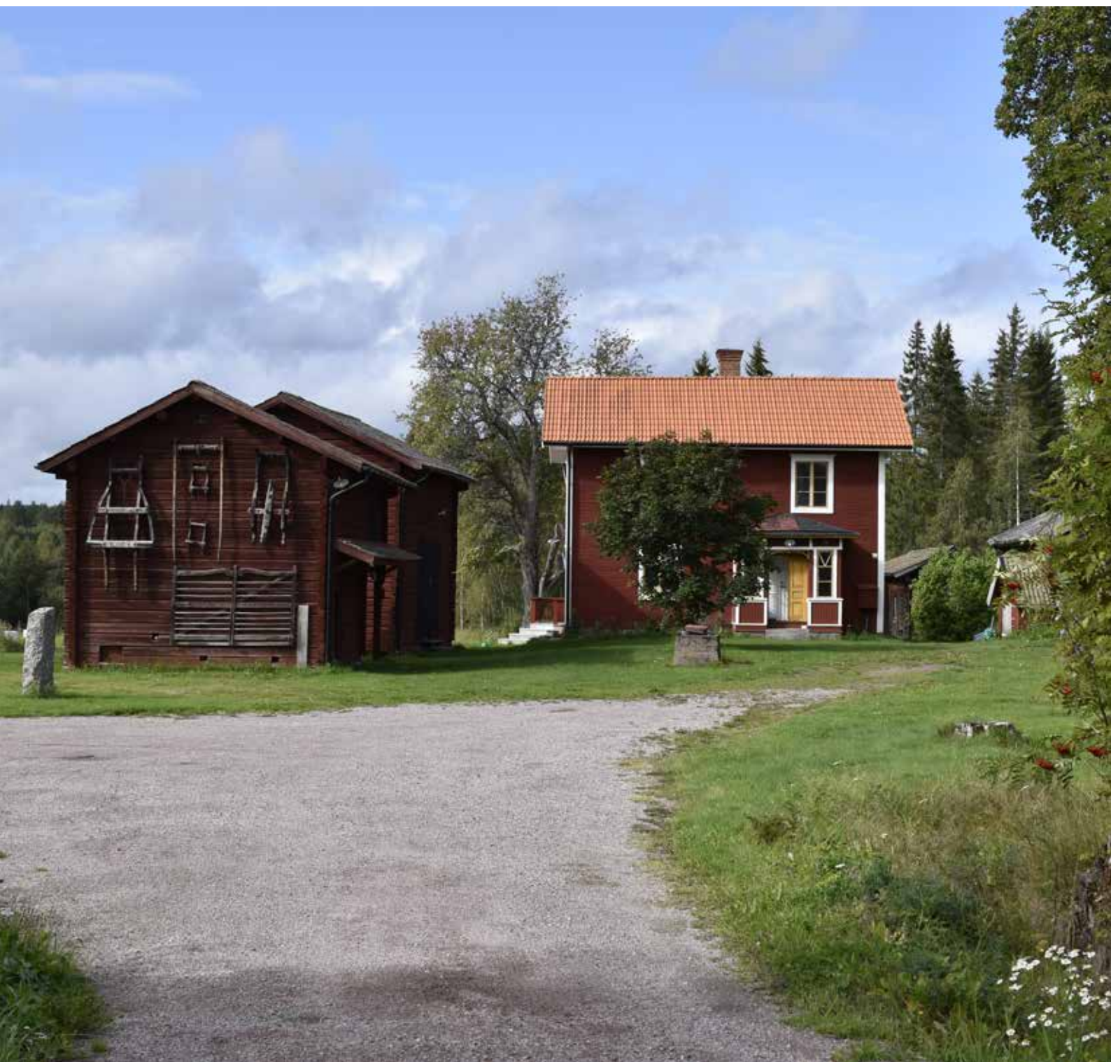
Välbehållen enkelstuga i två våningar med vacker farstuvist i vinkel med ålderdomliga timmerhus. Enkelstugan är typisk för Djurabygden och Leksand och har mycket höga kulturvärden. Hedby 16:10.