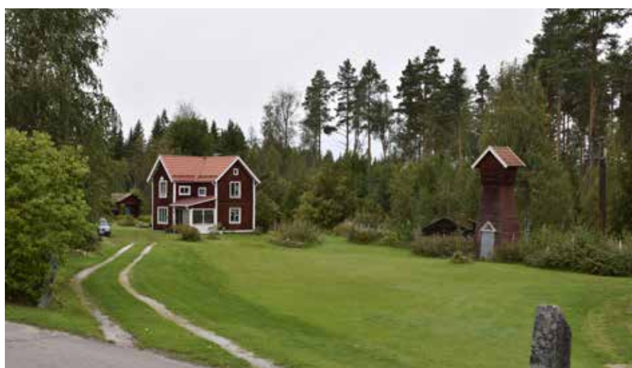
Vinkelhus sannolikt uppfört kring sekelskiftet år 1900 med tidstypiska detaljer. Invid byggnaden finns en transformatorstation av typen »Dalkulla«. Hedby 11:5.