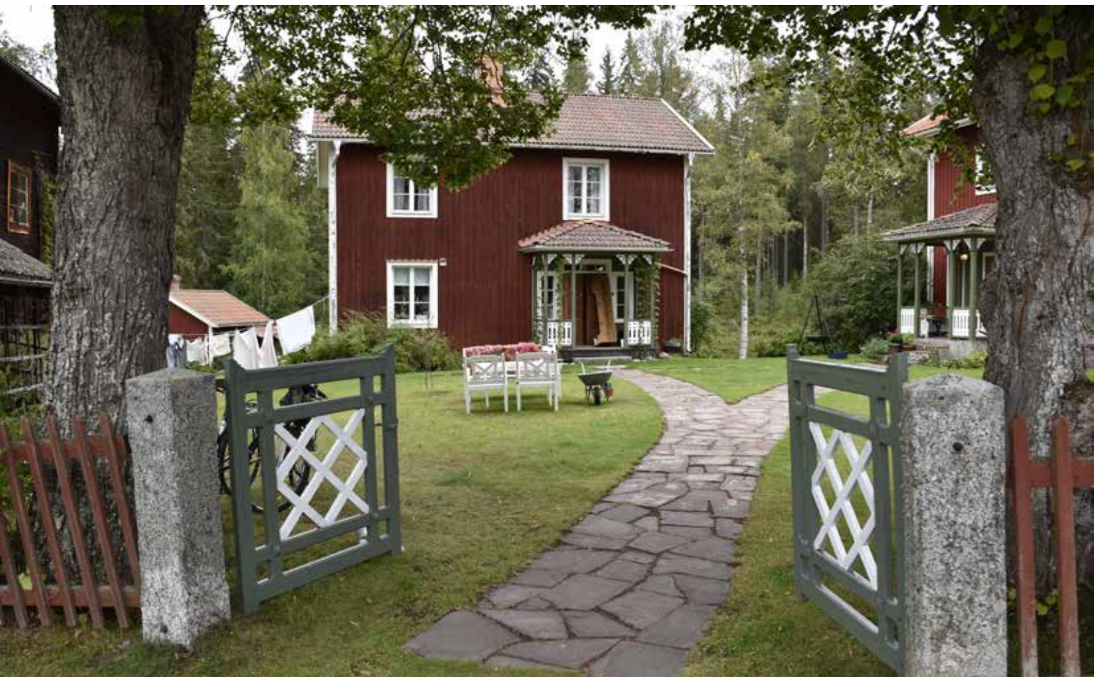
Farstuvistarna på den anrika gården är i snickarglädstil och sannolikt tillkomna under 1800-talets senare hälft. Hedby 5:5.

er och musik, traditioner och byggnadskultur. Många faktorer låg till betydelse för detta, däribland nationalstatens framväxt, en ökad urbanisering och världsutställningar i nationalismens förtecken. Övre Dalarna kom att föreställas som ett genuint reliktområde över det gamla Sverige, och många turister begav sig till bland annat Leksand för att uppleva den kultur som på andra platser betraktades som bortglömd eller utdömd. Med tiden kom kulturpersonligheter och förmögna stadsbor att bygga påkostade sommarnöjen och konstnärshem på natursköna platser i bland annat Noret, Bastberg, Tällberg och Plintsberg. Husen byggdes ofta i nationalromantisk – eller dalaromantisk stil. Nationalromantiken som arkitekturstil hade sin storhetsperiod i Sverige under decennierna efter sekelskiftet år 1900. I Leksand förekom emellertid detaljer och stilelement typiska för nationalromantiken ända in på 1970-talet. Nationalromantisk arkitektur kännetecknas ofta av en vurm för traditionella och hantverksmässigt framställda material. Stor inspiration hämtades från den brittiska »arts- and crafts-rörelsen«, som i motreaktion på vad som upplevdes som ett allt för icke-originellt och stilfixerat 1800-tal förespråkade en tillbakablick mot enkelt hantverk och materialens inneboende skönhet. I Leksand är det även vanligt med former