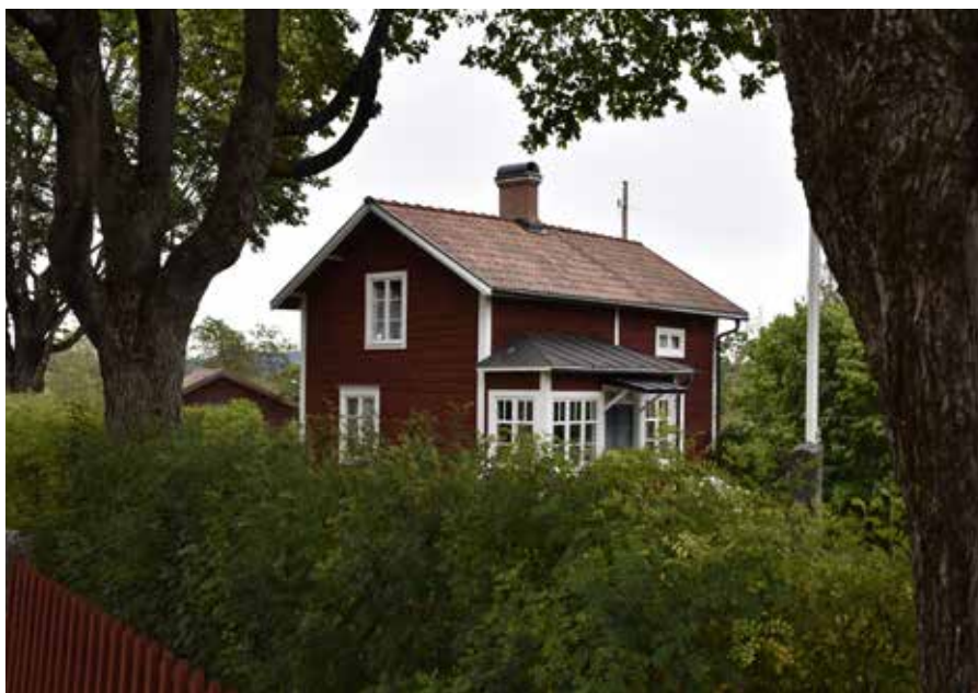
Sidokammarstuga med glasverandra som kröns av ett skivtäckt plåttak. Hedby 37:12