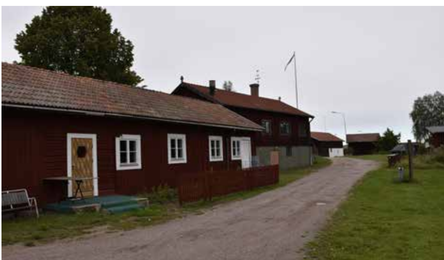
Den södra sidan av parhuset samt en rödfärgad länga i sydväst. Hedby 23:12.