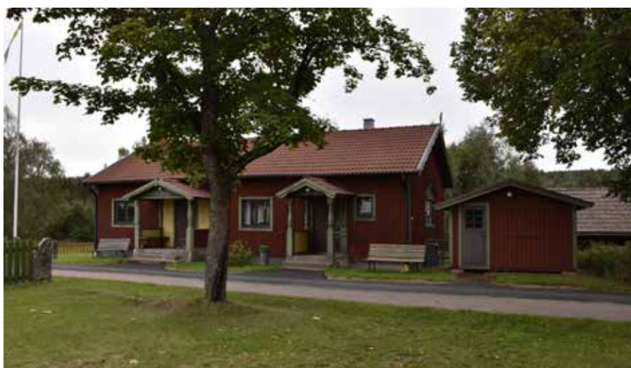
Modernistiskt parhus eller bystuga från 1931. Detaljutformningen är typisk för nationalromantiken i Dalarna trots att byggnaden är uppförd under den moderna epoken. Hedby 23:2.