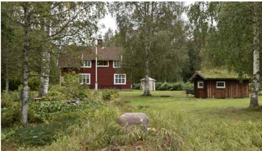
Nationalromantiskt sommarnöje i rödfärgat timmer. Byggnaden har karaktäristiska småspröjsade fönster och mansardtak. Hedby 14:3.