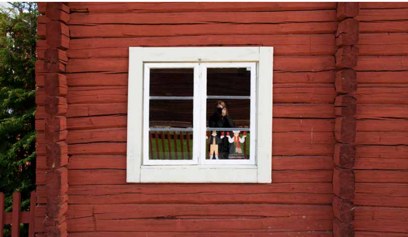
Blyspröjsat ålderdomligt fönster på en gammal enkelstuga i en våning. Byggnaden bedöms besitta särskilt kulturvärde bland annat eftersom byggnaden kan berätta om timmerhuskulturen och är karaktäristisk för Leksandsbygden.