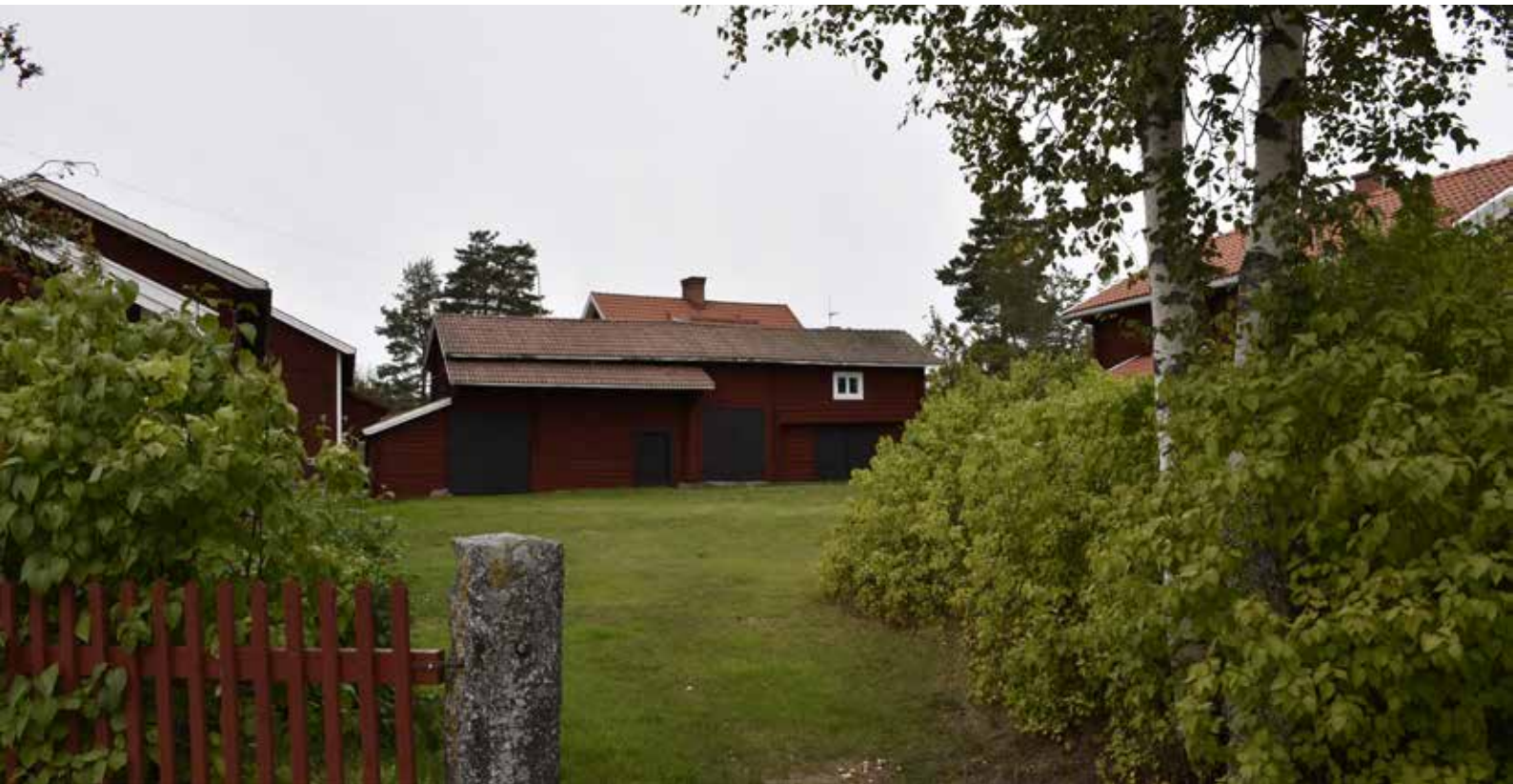
Länga med timmerhus, till vänster stall med portlider och dass, till höger en bod med fönster på övervåningen. Hedby 30:6.