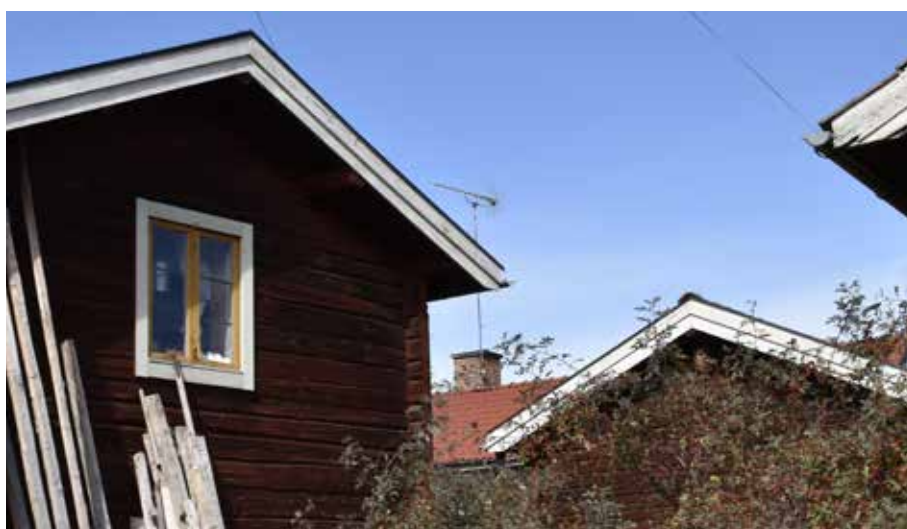
De flesta byggnaderna i byn har flacka sadeltak. På bilden syns även ett blyspröjsat gavelfönster med guldockrafärgade bågar. Hedby 25:6.