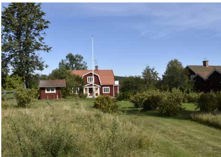
Villa från början av 1900-talet med faluröd fasad, vita knutar och mansardtak. Hedby 23:4.