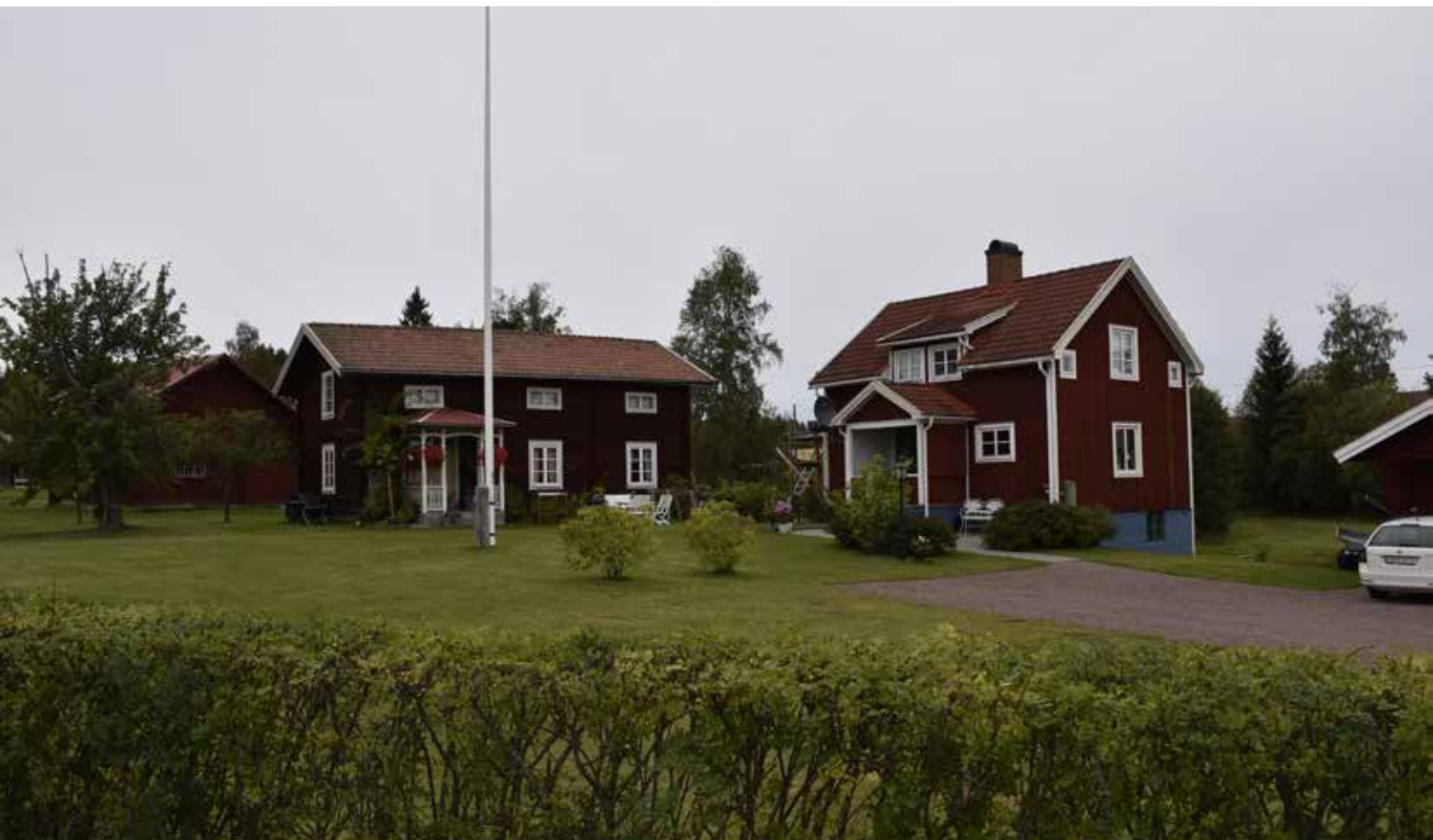
Äldre timmerhus med farstukvist med plåttak och detaljer i snickarglädjestil. Till höger finns ett rödfärgat bostadshus sannolikt uppfört under 1930-talet med en enkel detaljutformning som samspelar mot byn som helhet. Hedby 27:9.