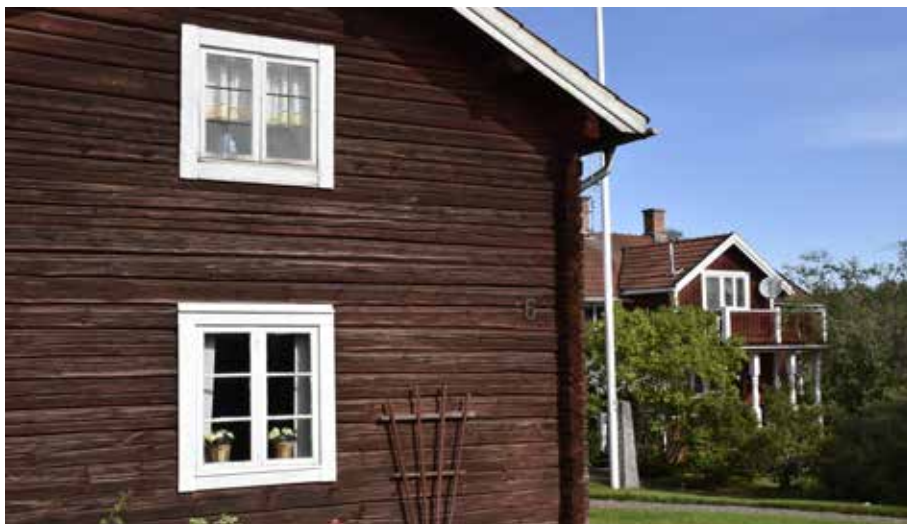
Sluten bebyggelse i Utti Brända. Till vänster i bilden syns en ålderdomlig enkelstuga i 1 och ½ våning där gavelfönstret är blyspröjsat och ålderdomligt. Hedby Hedby S:17.