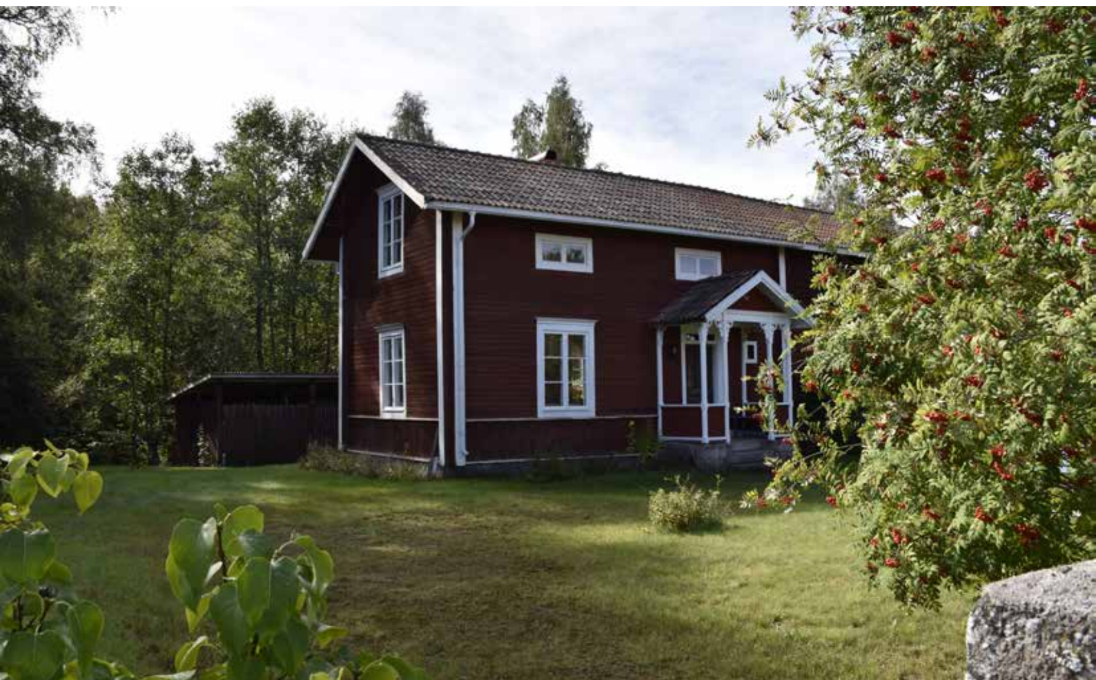
Länga med ekonomibyggnader som avslutas i ett bostadshus med detaljer i snickarglädjestil som är typiska för det sena 1800-talet. Hedby 2:4.

tagna ur och tolkade genom det tidiga 1900-talets idealbild av det äldre bondesamhället i Dalarna. Här finns blyspröjsade fönster med fönsterluckor, kronskorstenar, timmerväggar, stavspån, branta takfall, vindflöjlar med drakornamentik och stolpverkskonstruktioner. I vissa fall var de nationalromantiska husen utformade för att nära efterlikna äldre byggnadstyper så som parstugor och enkelstugor. I Hedby finns ett litet men betydelsefullt bestånd av nationalromantiska byggnader koncentrerade till skogsbrynet i södra delen av Brända. På fastigheten Hedby 14:3 finns exempelvis ett sommarnöje med mycket höga kvaliteter beträffande utformning, hantverk. Byggnaden kan berätta om hur nationalromantiken som arkitekturstil påverkade Leksands byar kring sekelskiftet år 1900.