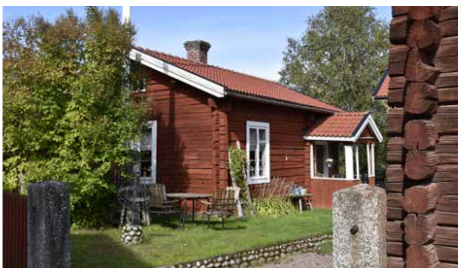
Ålderdomlig enkelstuga i en våning med enkel farstukvist och blyspröjsade fönster även på bottenvåningen. Bostadshus med sådana detaljer är idag ovanliga och kan berätta mycket om livet i det äldre bondesamhället och timmerhuskulturen. Hedby 25:6.