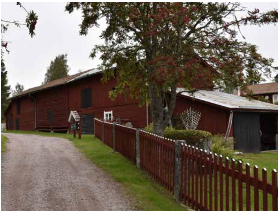
Spjälstaket och grusväg i den södra delen av byn. I bakgrunden syns en ålderdomlig länga med timmerbus. Trösklogen i mitten av längan är sannolikt mycket gammal. Hedby 14:4.