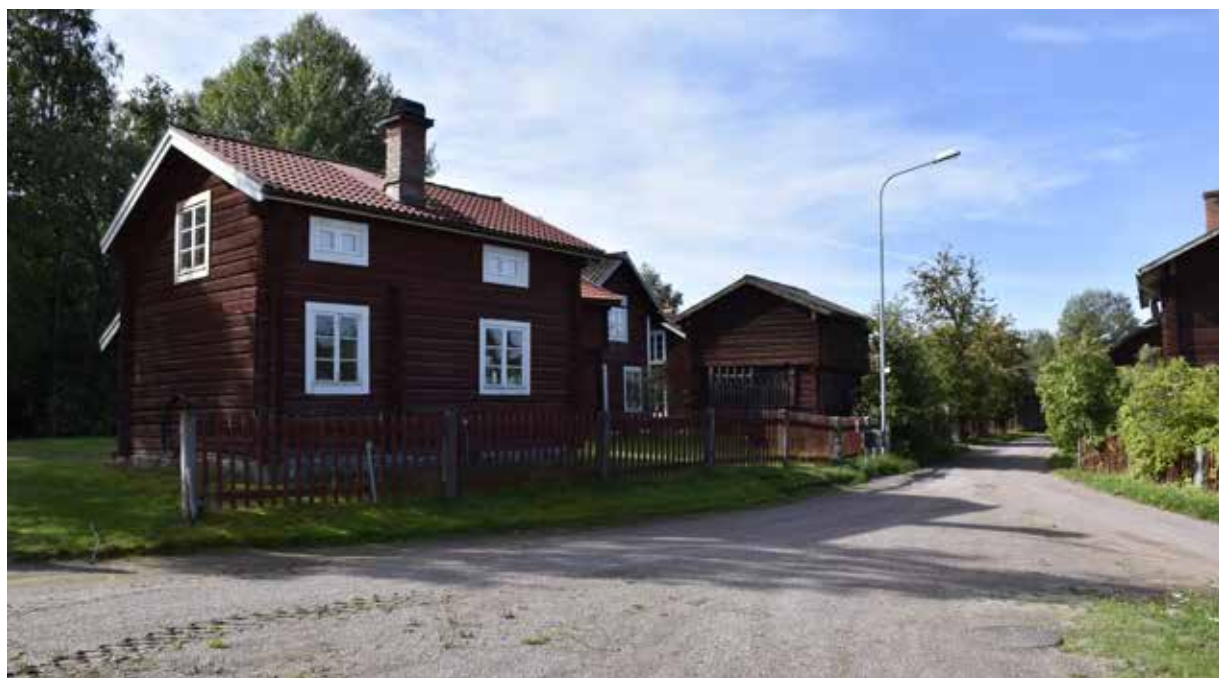
Enkelstuga i östra delen av Utti Brända. Längs byvägen västerut står byggnaderna mycket tätt intill gaturummet. Hedby 9:10.