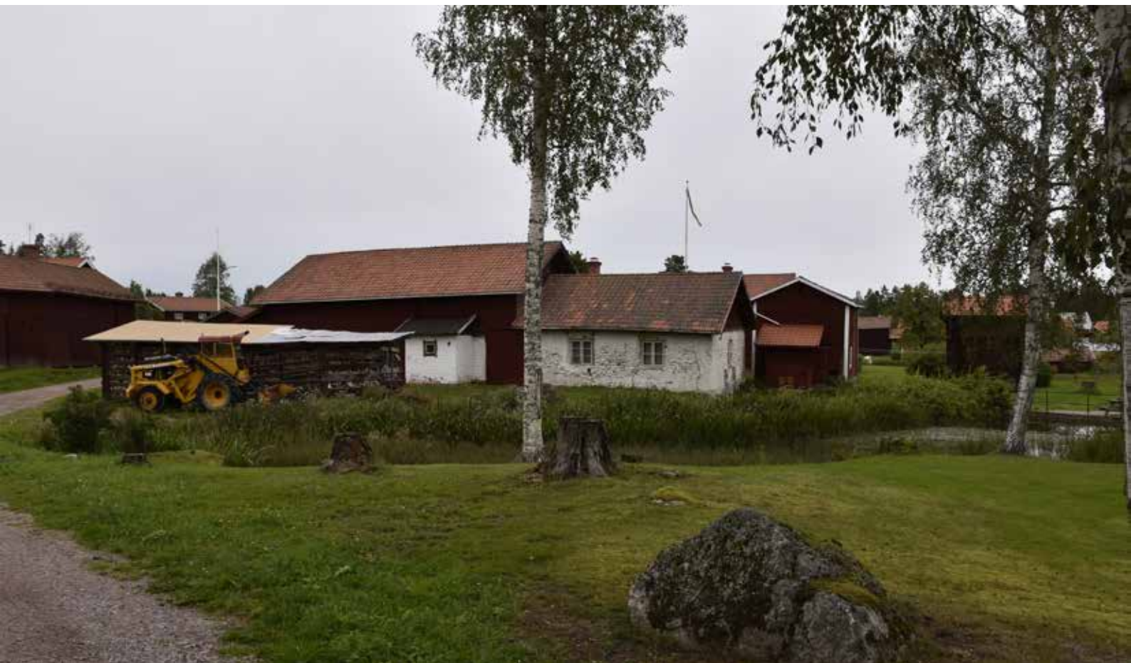
Helt slutet gårdstun med ekonomibyggnader sannolikt uppförda under 1800-talets senare hälft. Mitt i bilden syns vad som sannolikt varit ett fähus med gjutmurar. Hedby 17:10.