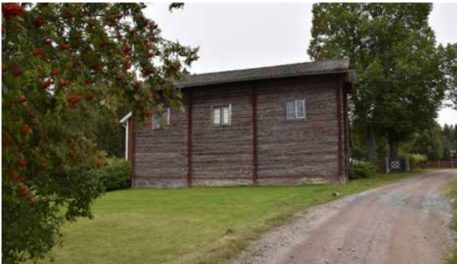
Ovanlig hög och märklig timmerbyggnad i den sydvästra delen av byn. Hedby 5:5.