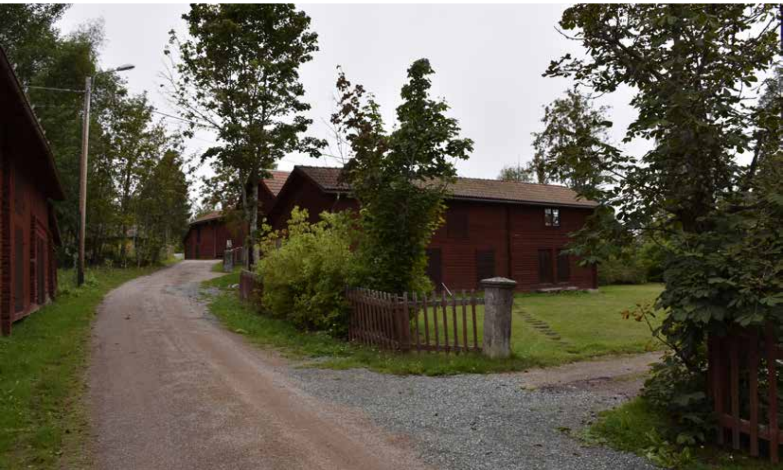
Länga med ålderdomliga timmerhus, längst till höger ett slags parhärbre i två våningar med blyspröjsat fönster på övervåningen. Parhärbren har vanligen ingått i gårdslängor med timmerhus i Djurabygden, men få exempel på detta kvarstår idag. Hedby 7:9.

befintlig fönstersättning; befintliga fönsterkarmar; befintliga fönsterbågar i trä med fasta spröjs av trä eller bly tillkomna innan 1950; befintliga fönsterrutor tillkomna innan 1950; profilerade fönsteröverstycken; dekorativa gavelfönster; befintliga dörrar och farstukvistar samt långbroar; lövsågade eller profilsågade detaljer på farstukvistar; dekorerade taktassar; grundmurar med synlig natursten. Stommen och formen på alla de bostadshus som uppförts innan 1930 men därefter väsentligen förändrats är värdefulla.