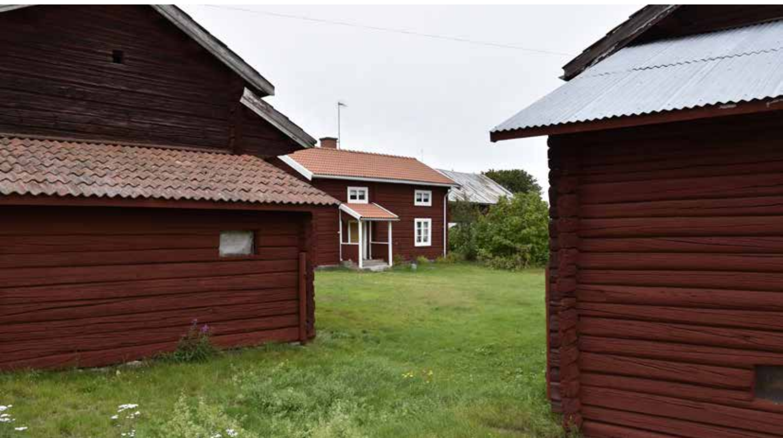
Kringbyggt gårdstun med välbehållen enkelstuga mitt i byn. Timmerhusen är ålderdomliga och kan berätta om det mång-hussystem som präglar timmerhuskulturen. Hedby 30:6.

Kringbyggd gård med ålderdomliga timmerhus. längst upp från vänster: hölada, parstuga (bostadshus), långsideshärbre, källarstuga, lofbyggnad med portlider, vagnsbod sammanbyggd med kortsideshärbre, tröskloge, brunn, stall, torkhus, smedja, lada och fähus med portlider och gödselstack.