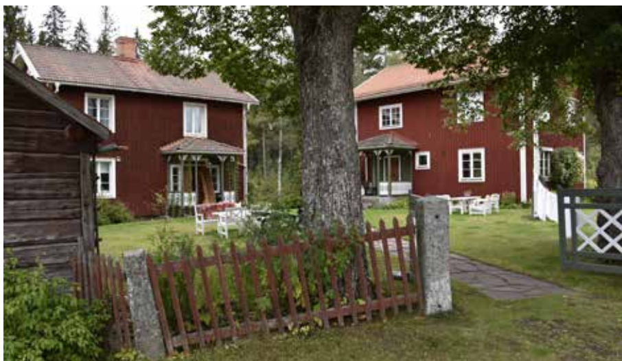
Two special single-story houses with farmsteads in the snickarglädestil, where the right one is probably newer than the left one. A sandstone path leads to the houses. Hedby 5:5.