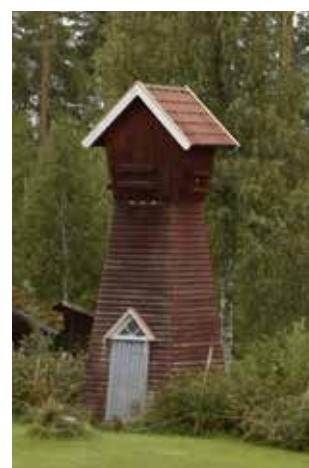
Transformatorstation av typen »Dalkulla«. Hedby 11:7.