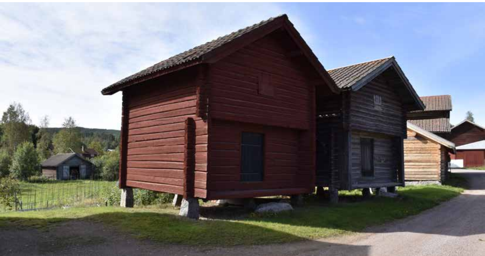
Två kortsideshärbren placerade tätt intill varandra. Tidigare fanns flera sådana härbren på platsen, på samma sätt som härbreklungorna i Almo. Byggnaderna står på granitplintar. Hedby S:17.