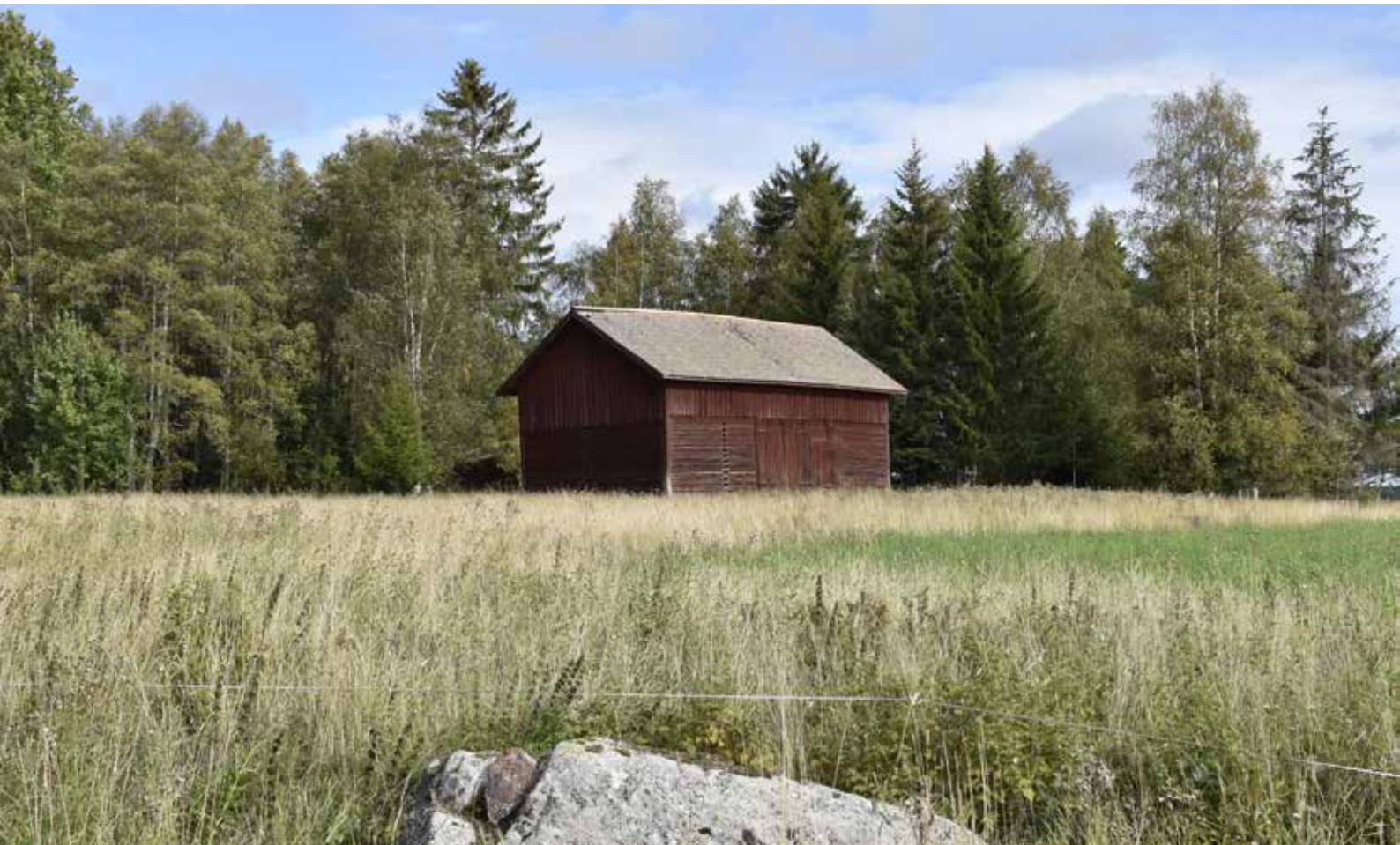
Stor timmerlada i odlingslandskapet utanför Hedbybyn. Hedby 26:9.

demokratiska rättigheter och möjligheter, bland annat till att bedriva fåbodbruk och att ha rösträtt i sockenstämman. Det finns specifika företeelser i landskapet i och kring byn som berättar om det äldre bondesamhället. Djurhållningen var förr en förutsättning för livsuppehållet. Hur många djur man kunde hålla berodde på tillgången av bete och vinterfoder. Antalet djur styrde i sin tur, före konstgödningens tid, hur stor åkerareal man kunde hålla. Det rådde därför stor konkurrens om slätter och bete och i stort sett all tillgänglig gräsmark utnyttjades för slätter medan sämre mark brukades till bete. Hack-slogar kallades de stenbundna fastmarker som inte var lämpliga att odla upp men som ändå gav tillräckligt så det var värt att slå. Förbättring av slättermarkerna utfördes i den mån det var möjligt och man kan se spår av stenröjning. Den årliga slättern skapade en mager mark som sällan eller aldrig fick tillskott av gödning och därmed gavs förutsättningar för en stor mångfald av växter, insekter och svamp. Varje liten rest av denna naturtyp är värd att förvalta då de ofta hyser hotade arter.