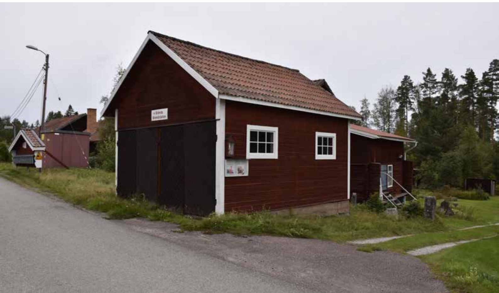
Byns brandstation, belägen i norr. Byggnaden är rödfärgad med liggande spontpanel och stora svarta ytterportar mot byvägen. Hedby S:56.