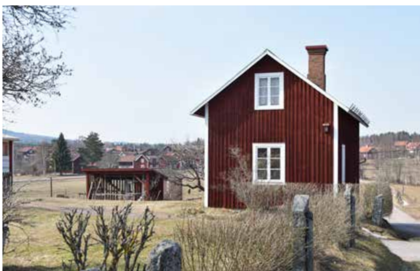
Moderniserad enkelstuga i utkan- ten av den östra byklungan. Den västra byklungan syns i bakgrun- den. Almo 153:2.