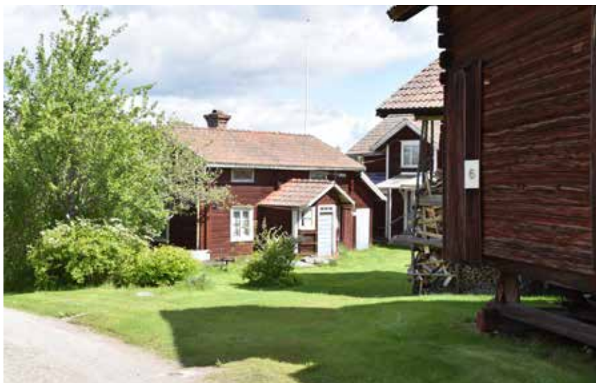
Välbevarad äldre sidokammarstuga i östra byklungan. Almo 70:1.