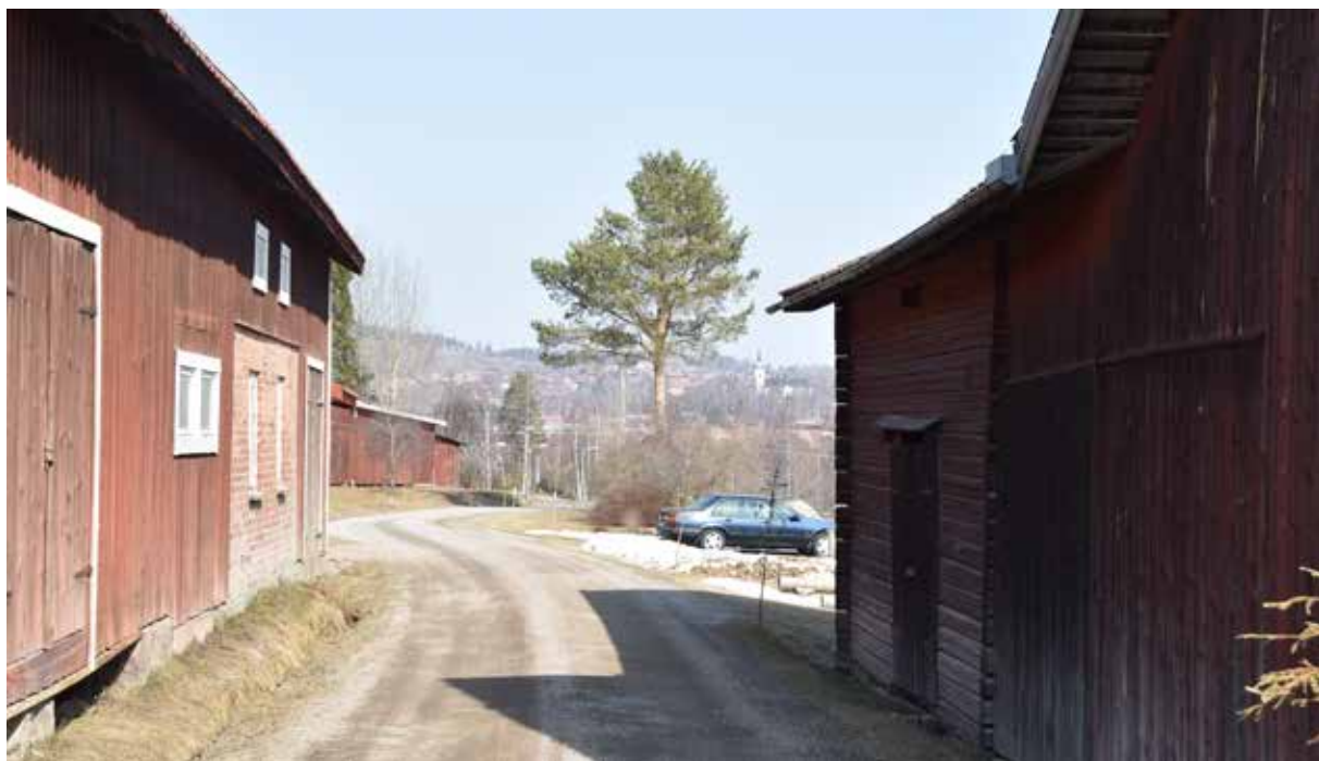
Stora ekonomibyggnader i längor bildar kringbyggdhet och slutna bygaturum. Till vänster Almo 154:1 och till höger Almo 80:1.