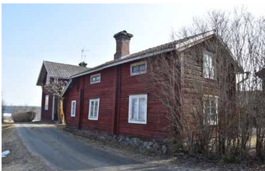
Välbevarad äldre sidokammarmarstuga i östra byklungan. Denna typ av byggnader, samt äldre parstugor och enkelstugor i liknande skick är mycket värdefulla. Almo 70:1.