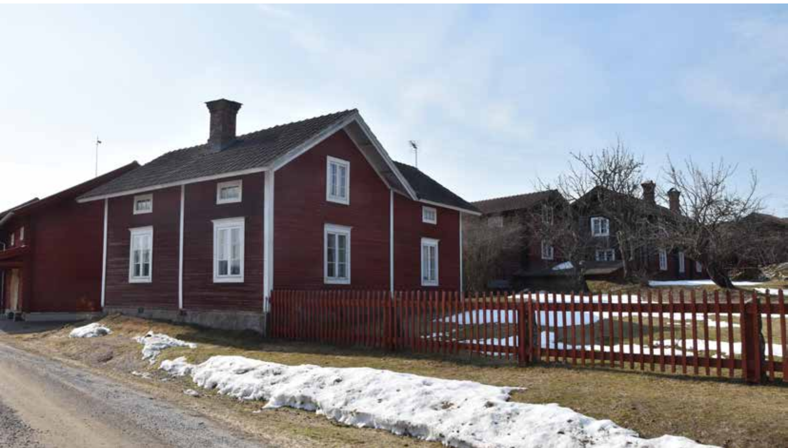
Välbevarade äldre hus i den östra byklungan. I bakgrunden Landgården. Almo 69:1.