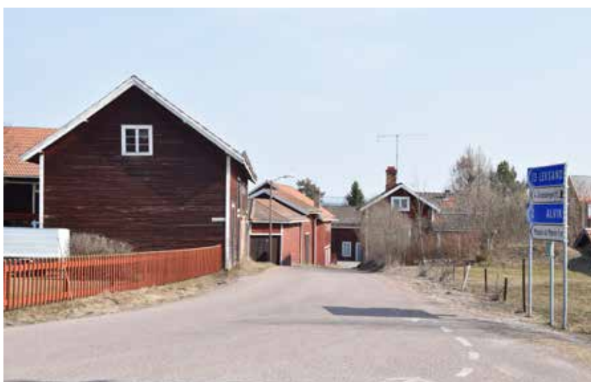
Bebyggelsen i Almo är sluten. Ekonomibygnaderna som omger gårdstunen är särskilt viktiga för karaktären. Husen står även tätt, och är inte särskilt höga. Almo 74:2.