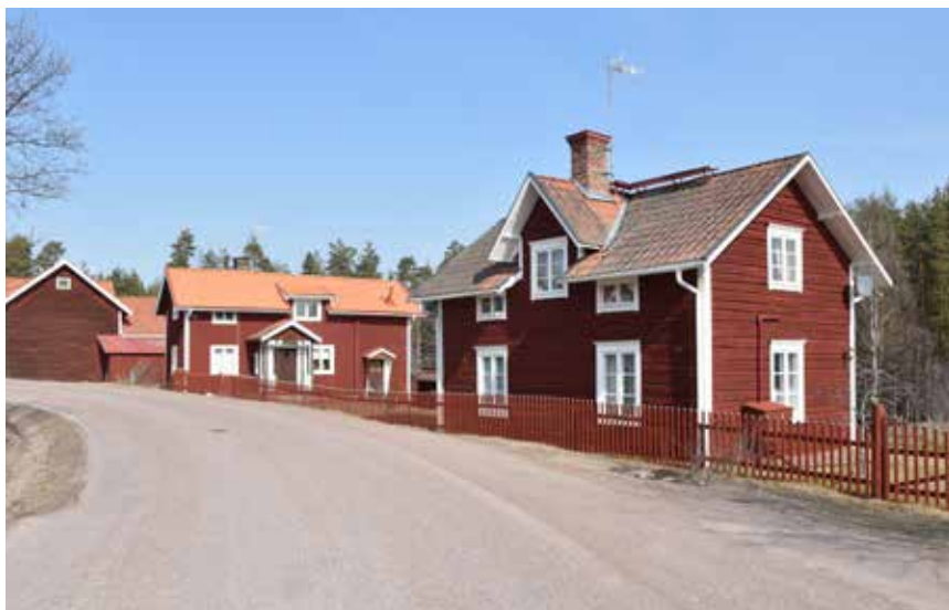
De flesta husen i byn, både nya och gamla är faluröda och byggda i trä. Almo 188:1 och Almo 77:2.