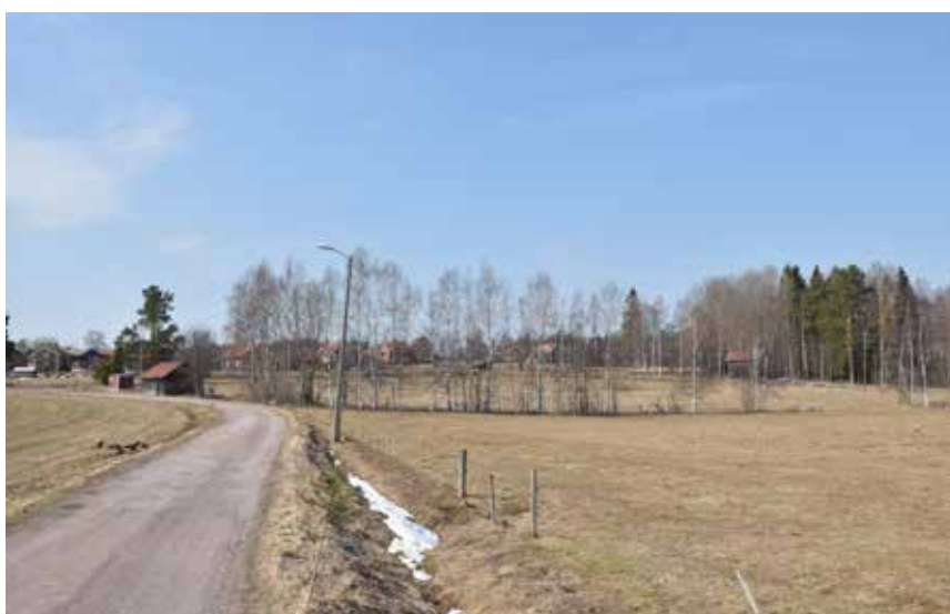
Utsikt mot de småbrutna jordbrukslandskapen och spridd bebyggelse norr om den västra byklungan.