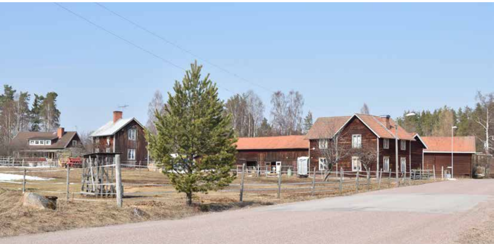
Norrut finns mer spridd bebyggelse i radbykaraktär. Vissa hus har fortfarande välbevarad äldre karaktär. Almo 158:1.

samlats på ett karaktäristiskt sätt. Fyra vägar leder ut från byklungan – en i nordlig riktning mot Näsbyggebyn, en i östlig riktning mot Alviken, en i sydlig riktning mot Alvik och en i västlig riktning mot den andra byklungan i Almo. Det finns flera gårdar och byggnader med synnerligen ålderdomlig karaktär i Backen, däribland den helt kringbyggda gården på fastigheten Almo 69:1, med bland annat välbevarad äldre parstuga, portlider och källarstuga. Angränsande till samma gård finns även tomtmark med äldre fruktträd, och i öster en välbevarad äldre byggnad som tidigare varit butik. Även på fastigheten Almo 70:1 finns en välbevarad äldre sidokammarstuga. Även om bydelen som helhet uppvisar en ålderdomlig karaktär finns även beståndsdelar som är mer karaktäristiska för det sena 1800-talet och 1900-talet, exempelvis i form av faluröda komplementbostadshus i sydväst, och stora ladugårdslängor med tegeldel i söder.