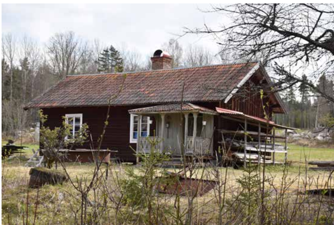
En ovanligt stor bostad för Axmors fåbodar, troligen en så kallad sidokammarstuga. Den utförliga farstubron är av en typ som vanligen förekommer på större bofasta gårdar. Tällberg 3:23.