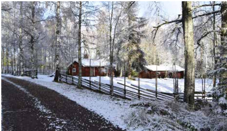
Fäbodgård vid anfartern mot den norra delen av Lindbodarna. I Lindbodarna finns fler fäloröda byggnader än på många andra fäbodställen. Heden 5:9.