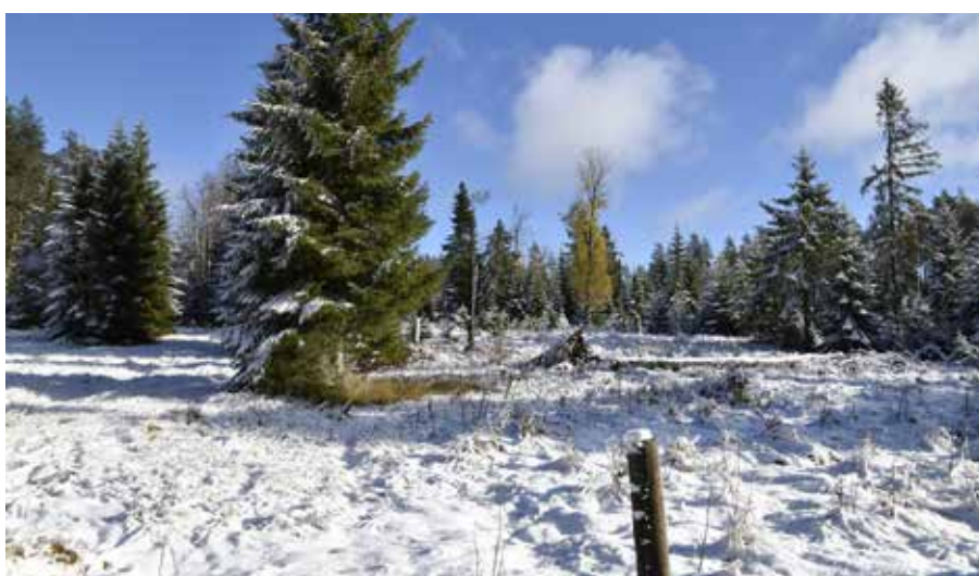
Kvarvarande öppna ytor nära fäbodgårdarna är värdebärande för den historiska läsbarheten kring fäbodbruket i äldre tider. Både Balkbodarna och Lindbodarna hade åkermarker.