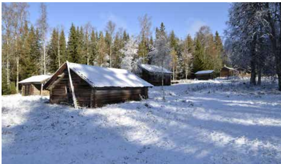
Närmast i bilden syns ett ålderdomligt timrat fäjs på fastigheten Rältlindor 7:14. Timrade fäjs av hög ålder är idag ovanliga och återfinns i huvudsak på fäbodställen.