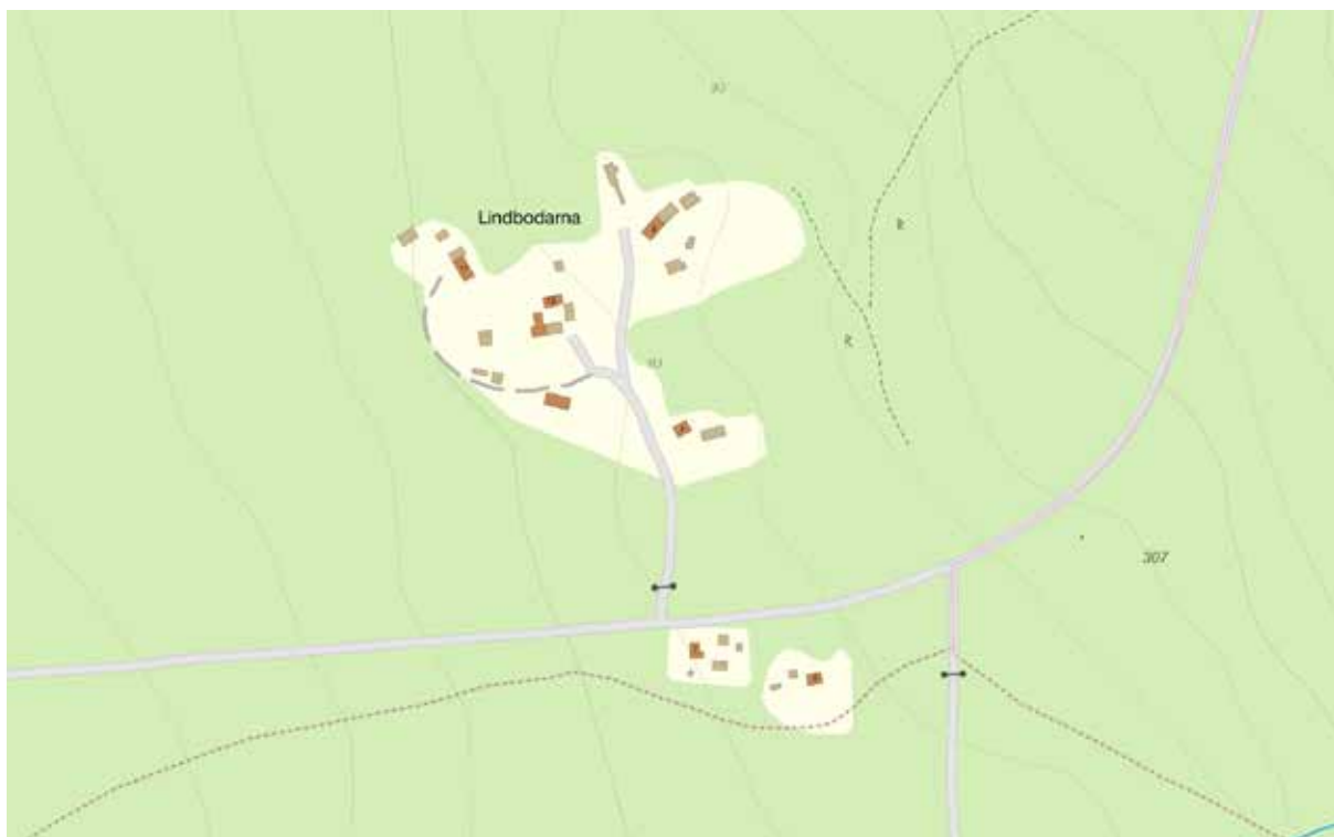
Ovan, Balkbodarna har två klungor som idag kallas Västra och Östra Balkbodarna. Fäbodstället ligger i den Västra delen av nuvarande Leksands kommun, längs vägen mellan Djursjön och Vägskälets naturreservat. Nedan, Lindbodarna ligger strax öster om Balkbodarna längs samma väg.