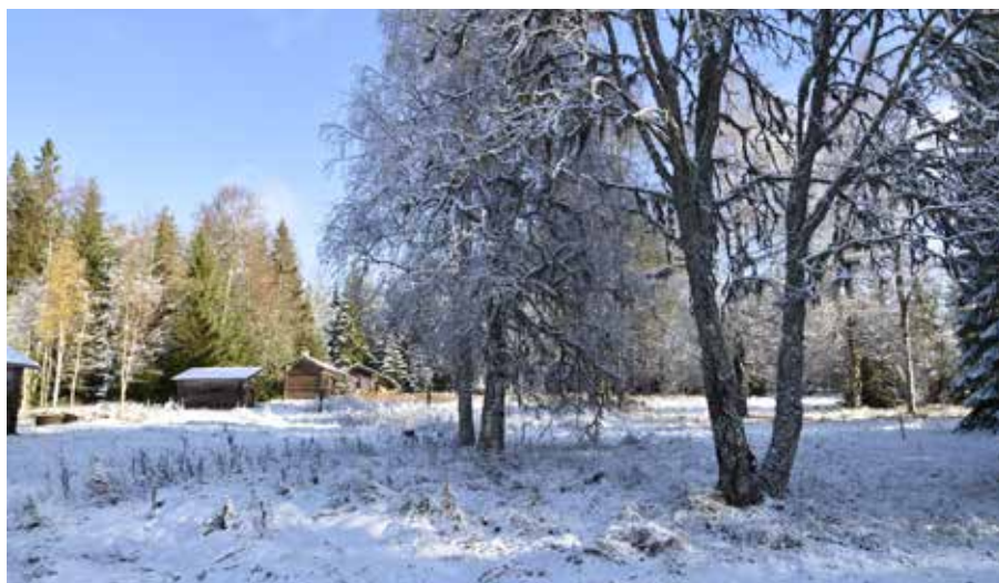
Vid den västra klungan på Balkbodarna finns fortfarande öppen vall och en mångfald av lövträd som kan ha nyttjats till vinterfoder i djurhållningen.