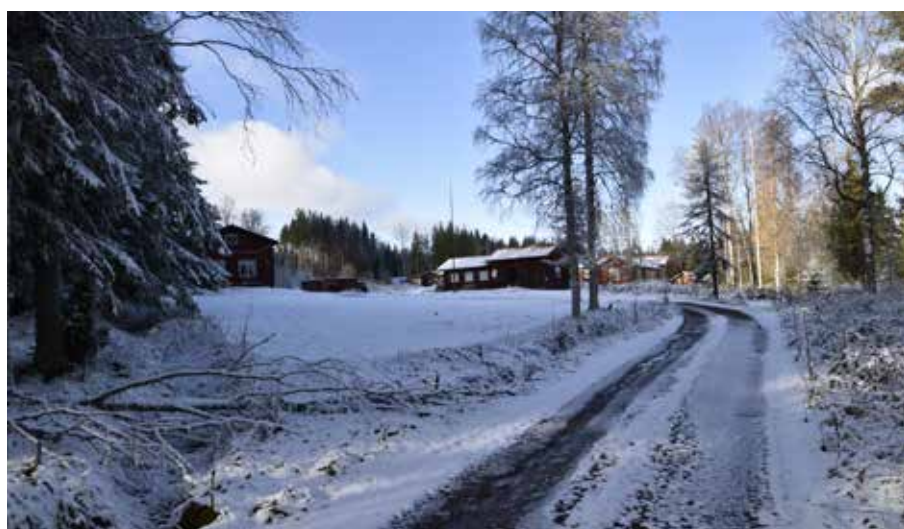
Lindbodarna omfattade förut fyra fäbodgårdar som var kringbyggda på tre sidor om gårdstunet. Gården mitt i bilden har senare tillbyggts och är idag fyrkantsbyggd. Smedby 8:20.