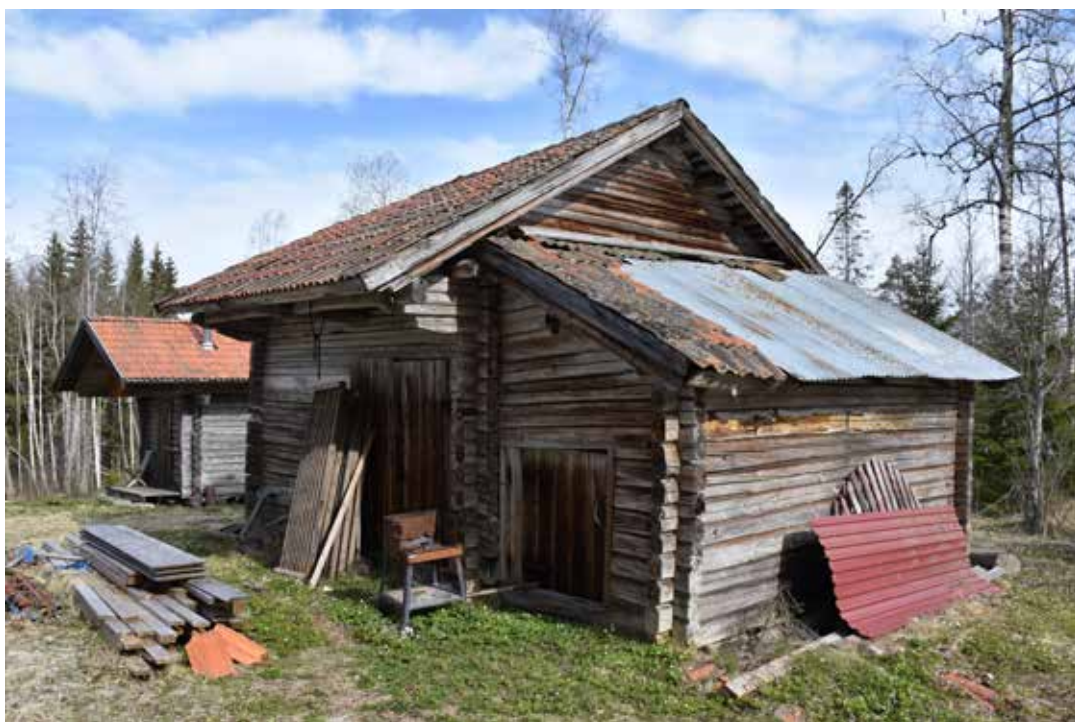
Ett stort antal av byggnaderna på fåbodarna är förhållandevis oförvanskade, men där senare takbeklädnader kan ha tillkommit. Laknäs 17:1.