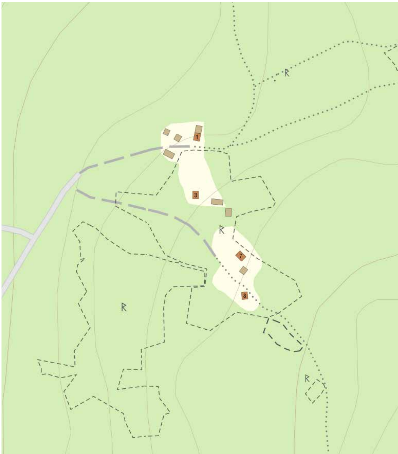
Brömsbodarna nås över en mindre skogsväg. Vägen avviker från riksväg 69 i höjd med sjön Axen på öster sida. De närmsta byarna är Risholn rakt västerut samt Sörskog som ligger längre åt nordöst.