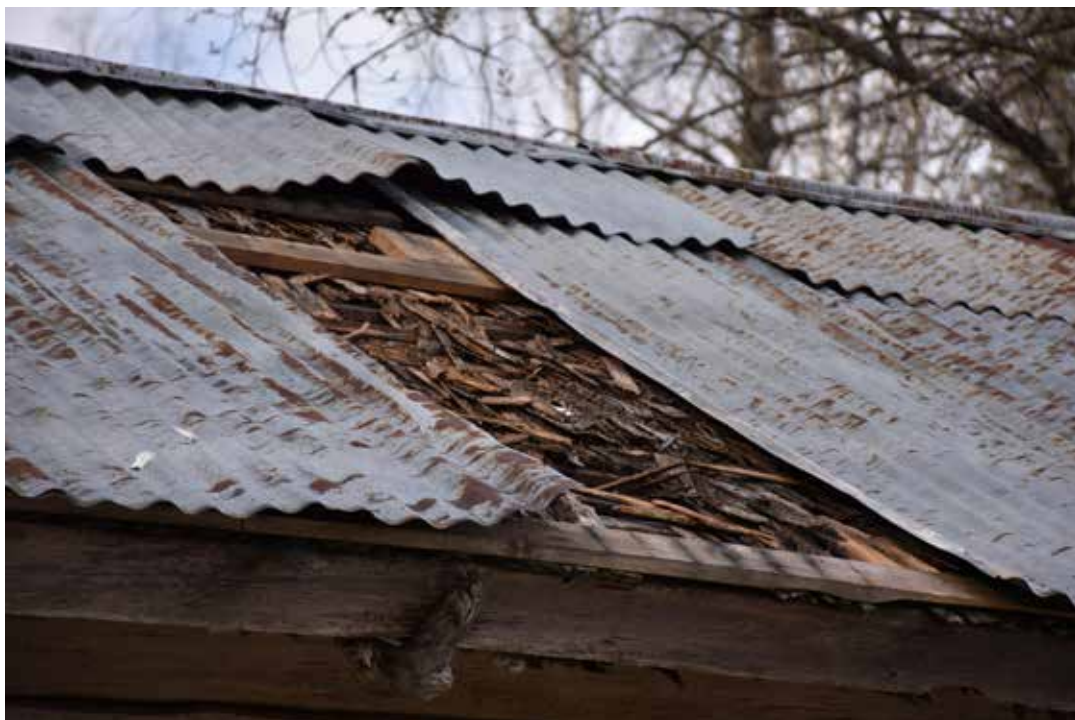
Flera tak är idag täckta med lertegel eller plåt. Under denna plåt skymtar resterna av ett äldre pärttak. Laknäs 17:1.