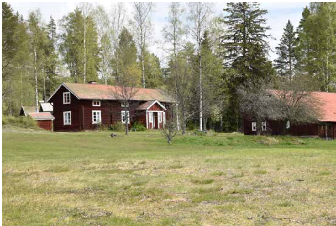
En gård med långsmalt bostadshus, troligen en framkammarsstuga, samt en större ladubyggnad till höger. Helgbo 10:9.