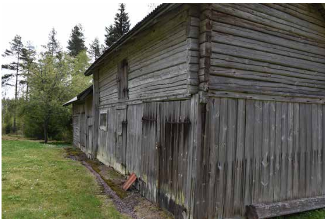
Stor ekonomilänga bestående av loge och ett förbyggt lider. Busmor 6:1.