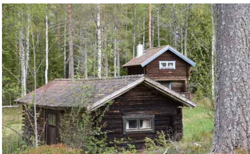
I bakgrunden syns ett äldre härbre som byggts om till sommarnöje. Byggnaden har försetts med blyspröjsade gavel-fönster, skorsten och snickerier i dalablått. Ål-Kilen 19:8.