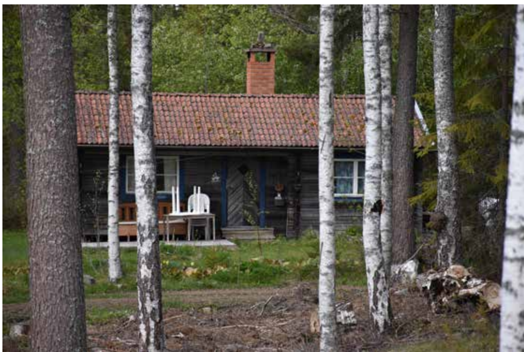
En nyare fritidsstuga med grånat liggtimmer och snickerier i dalablått. Brenäs 22:20.