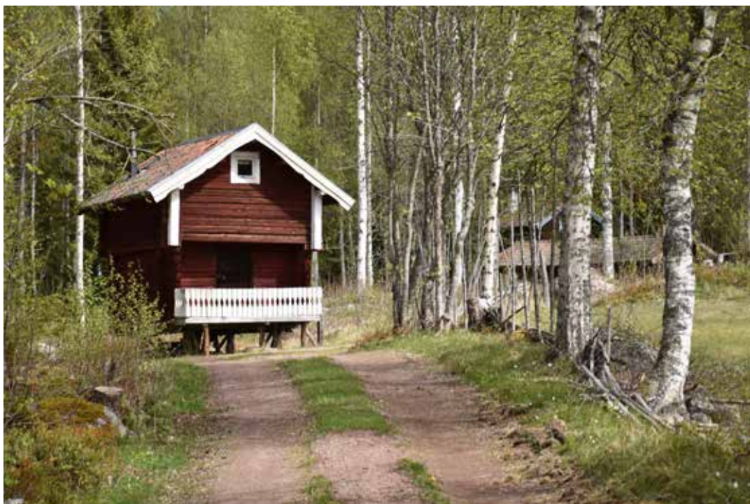
Äldre rödfärgat härbre som sedermera byggt om till sommarstuga. Vindskivor, gavelfönster och räcken är sentida. Ål-Kilen 19:8.