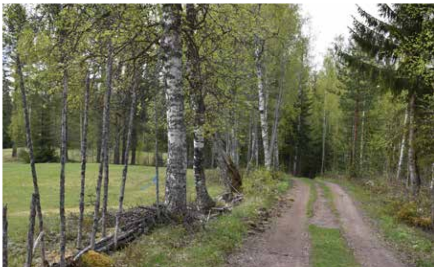
Fäbodgatan kantas bitvis av gamla gårdesgårdar och björkalléer. Lövträden var historiskt viktiga inslag på de aktiva fäbodarna.