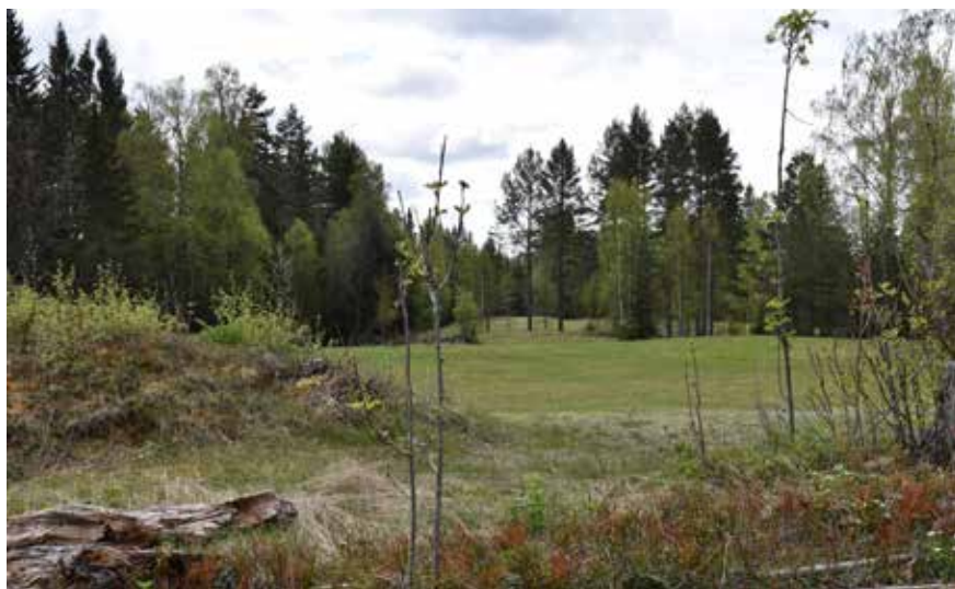
Flera av de små åkerytorna som omger fäbodstället hålls ännu öppna, även om stora arealer tillåts växa igen under 1900-talet.