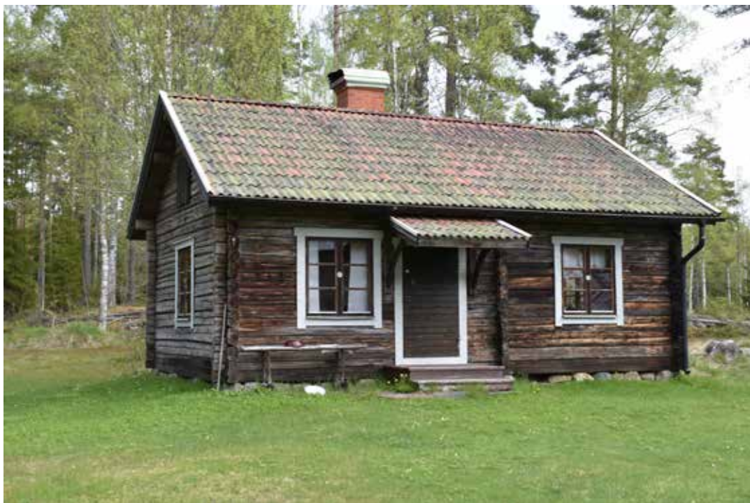
Ofärgad enkelstuga med skärmtak och vitmålade foder. Busmor 6:1.