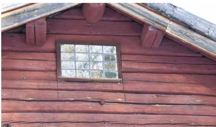
Synnerligen ålderdomligt blyspröjsat fönster på enkelstuga. Rotanders på fastigheten Hedby 10:5.