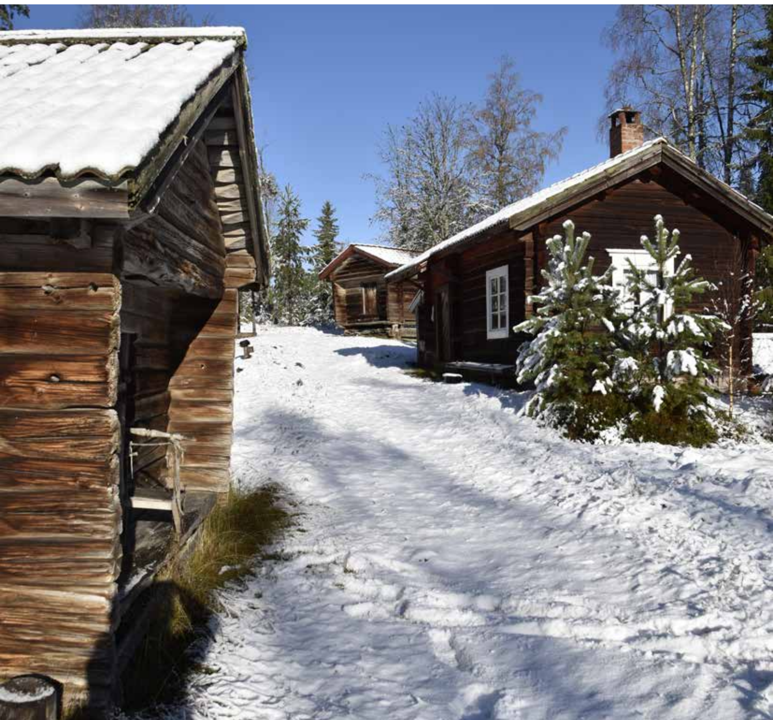
Two elderly hiberns with gabled roofs and a well-maintained old single-story house are well in the line of sight. Most of the houses in the settlement are knuttimrade and ofärgade, with an elderly character. The construction is in its entirety small-scale.