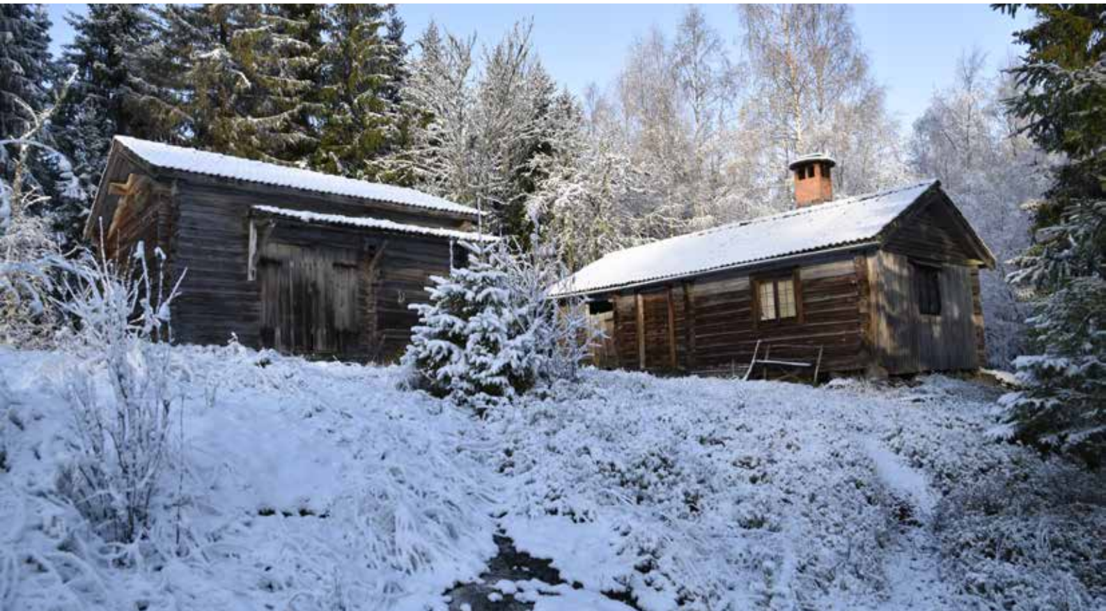
För fäbodstället typisk gård med enkelstuga i vinkel till större tröskloge. Enkelstugan (till höger) har ålderdomliga blyspröjsade fönster, och är som brukligt på fäbodstället tillbyggd med ett vedlider mot kortsidan. Gråda 7:17.