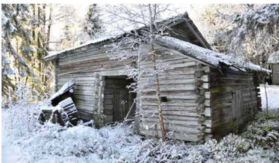
Stall med portlider och foderbod ovan. Djura 12:7. Det finns många välbevarade äldre timmerhus på fäbodstället.