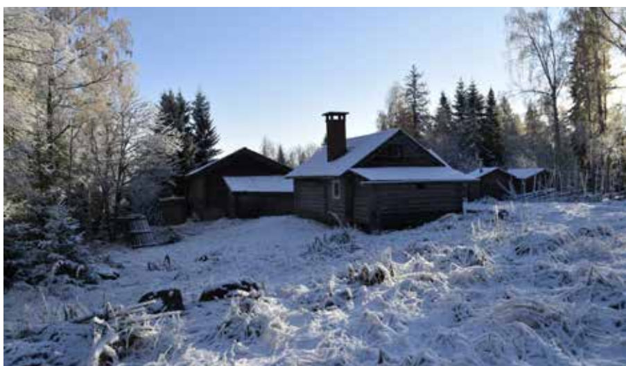
Fäbodgård med enkelloge av anseelig storlek (till vänster i bilden). Byggnaden är ålderdomlig och utgör ett spår av den historiska odlingen på fäbodstället. Gråda 1:17.