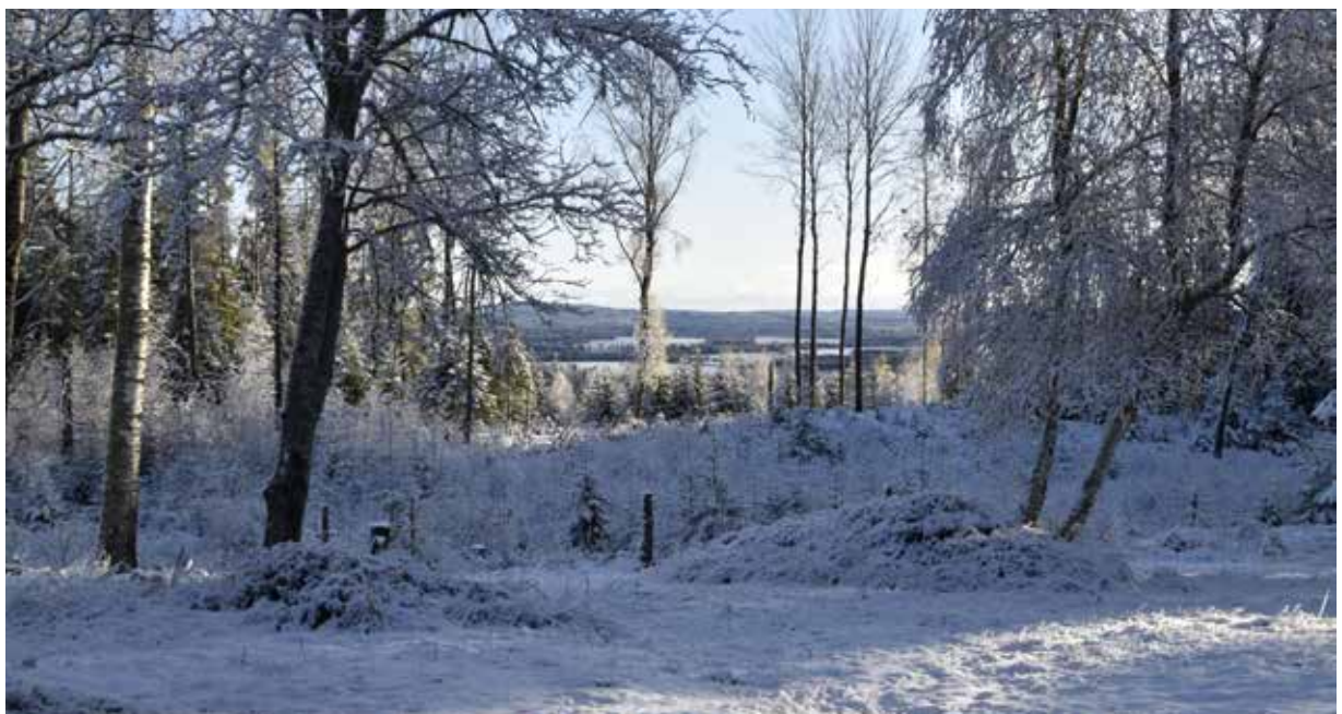
Den storslagna utsikten mot Djura och Gagnefs slättlandskap.