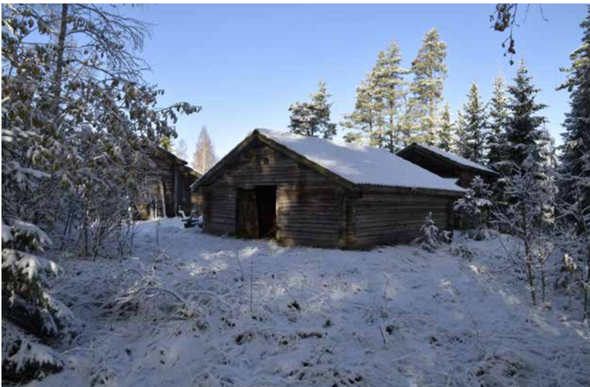
Kringbyggd gård på hol i den västra delen av byn. På gården finns ett av fäbodställets bevarade äldre fäjs (närmast i bilden) samt även lada, loge och enkelstuga. Gråda 6:15.