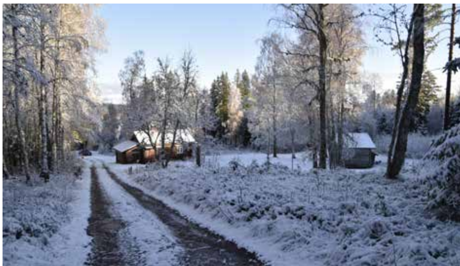
Den nordligast belägna fäbodgården med välbevarad äldre enkelstuga intill den nuvarande anfartern från Brändan. Slutningsläget är påtagligt. Gräda 2:14.