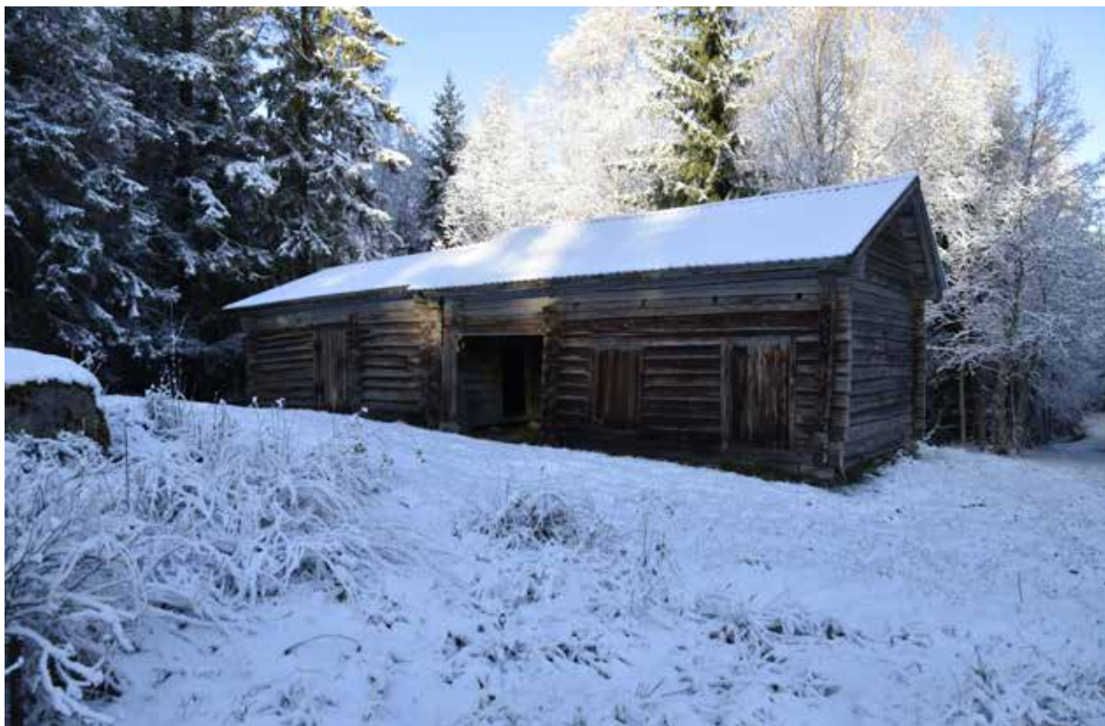
Länga med ålderdomlig tröskloge samt stall med portluder och foderbod ovan. Många ålderdomliga timmerhus har bevarats på fåbodstället. Gråda 10:10.