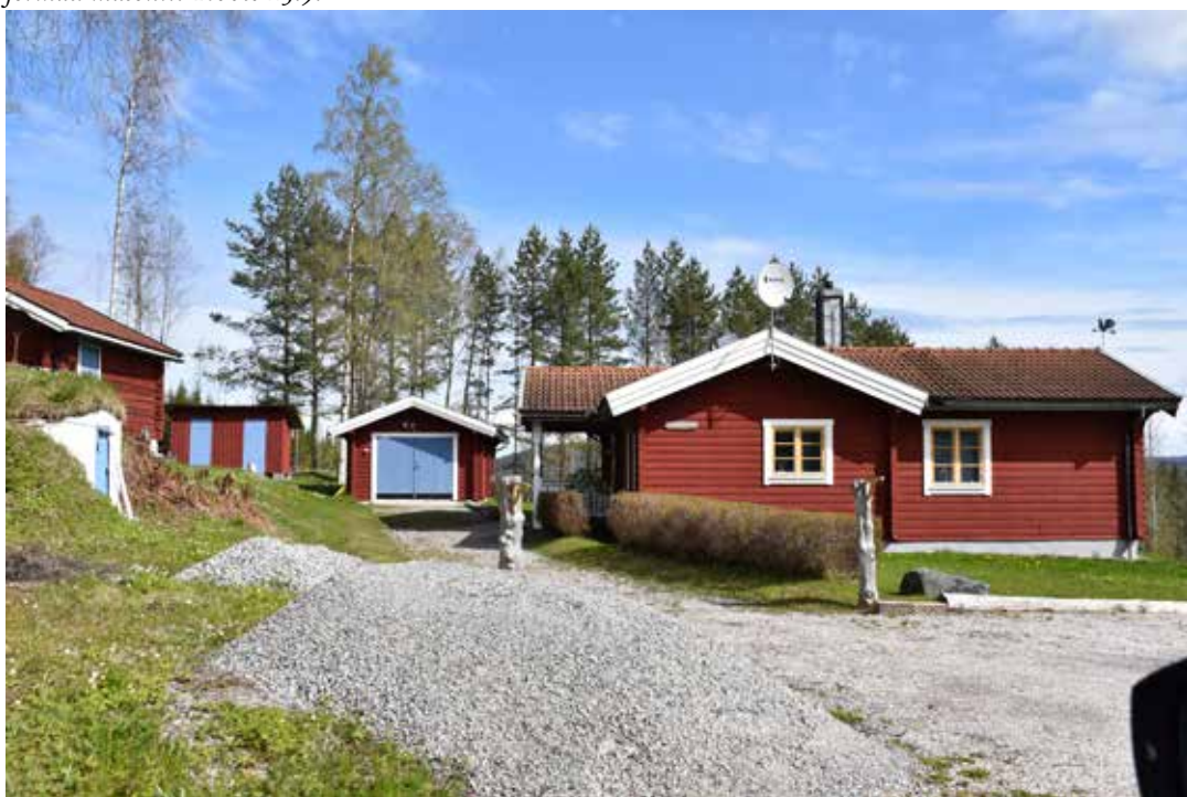
Stuga från det sena 1900-talet i liggtimer med tillhörande gäststuga och garage. Östra Rönnäs 31:12.