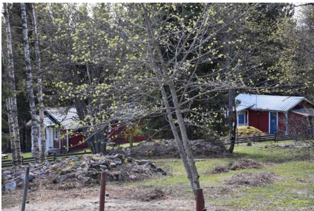
Stora odlingsrösen i vad som idag är betesängar. I bakgrunden skymtar flera fritidsstugor från 1900-talets senare hälft. Ullvi 3:7.