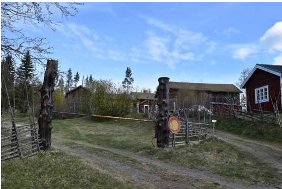
Rotvirkesstolpar och gärdesgård inhägnar en kringbyggd gård högt upp i byn. Östra Rönnäs 17:13.