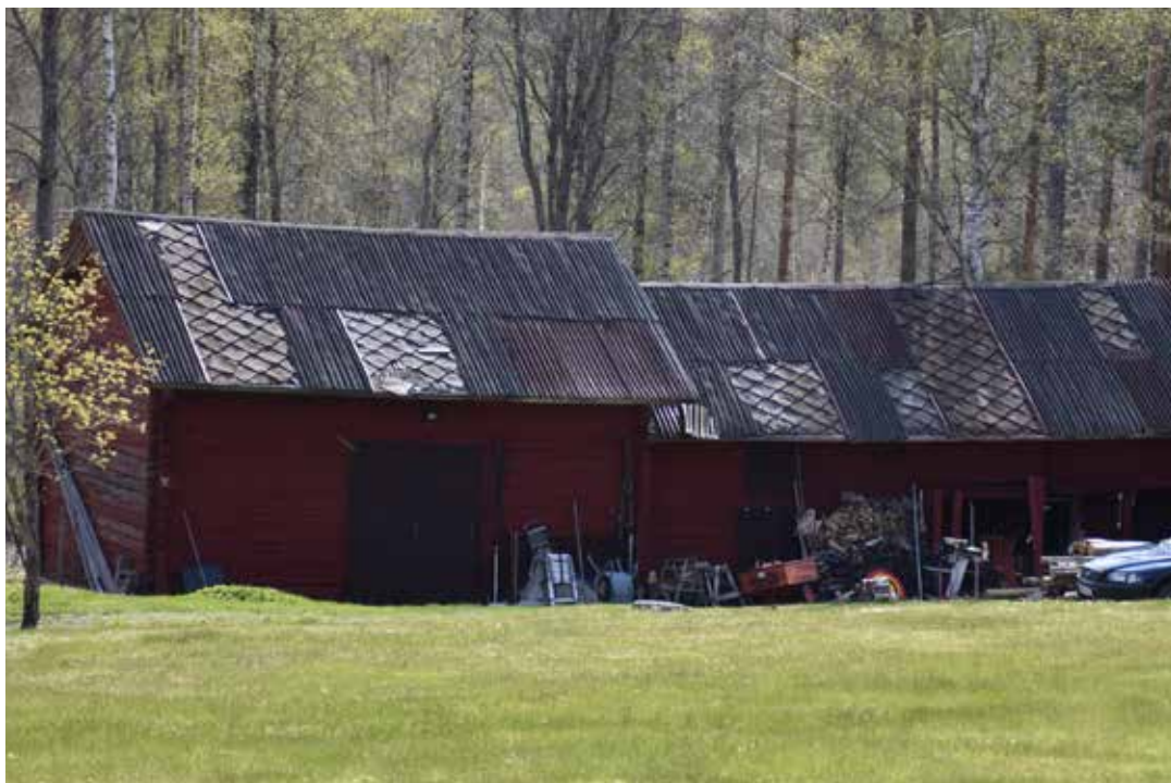
Äldre ekonomilänga. Där plåtskivor ramlat av skyntar ett äldre tak, troligen av rombformad masonit. Tibble 23:9.