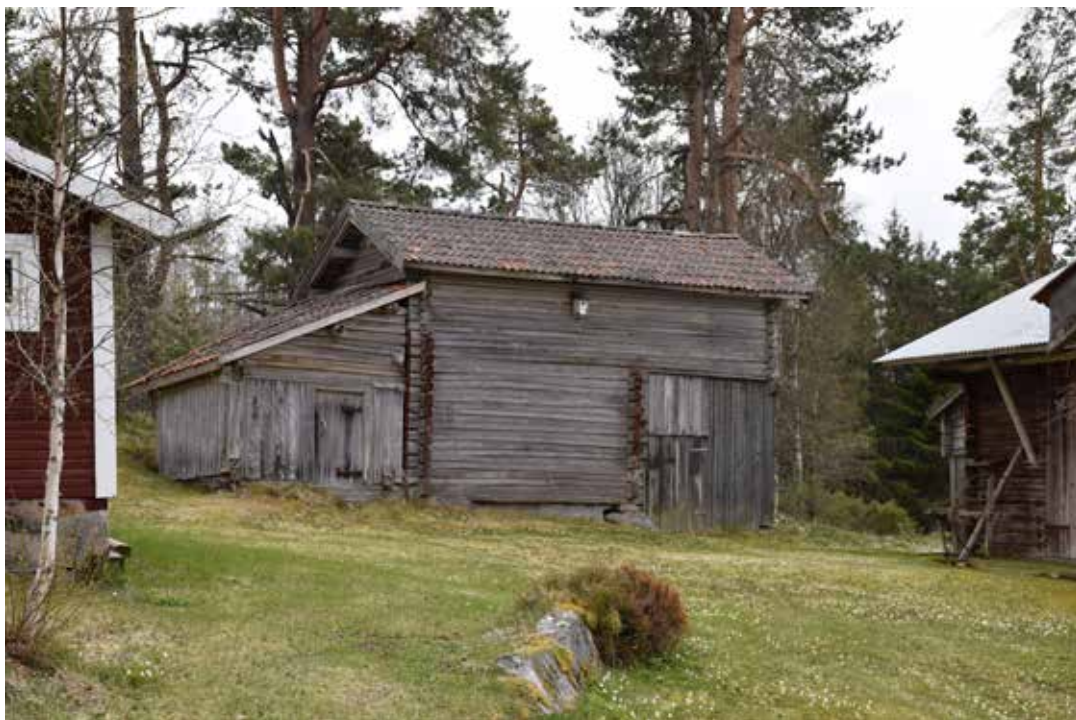
Ålderdomlig ekonomibygnad med naturligt grånat liggtimmer. Lidret har sedermera klätts in med stående panel. Östra Rönnäs 34:3.