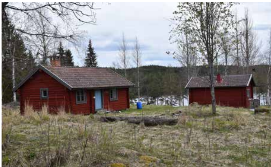
Persgårdarnas två stugor från sent 1800-tal. Båda stugor har foder och vindskivor i en modernare grå kulör. Berg II:4