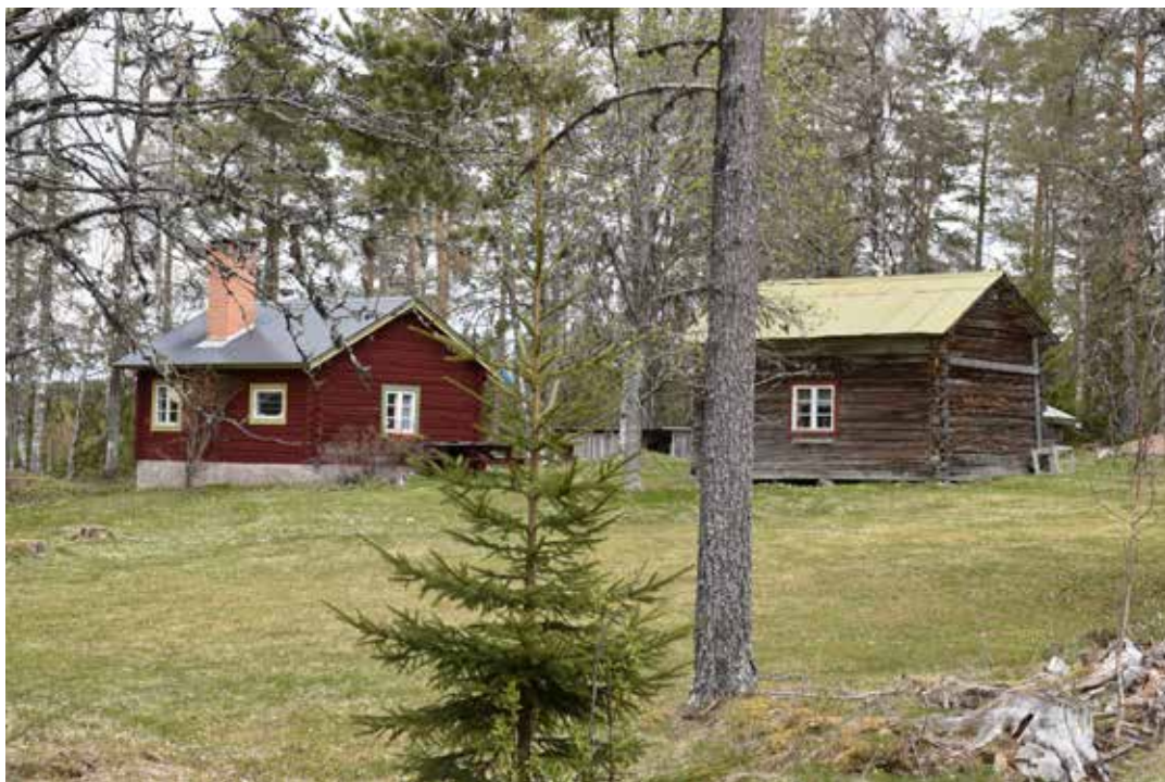
Västra Rönns 18:10 sett från söder.