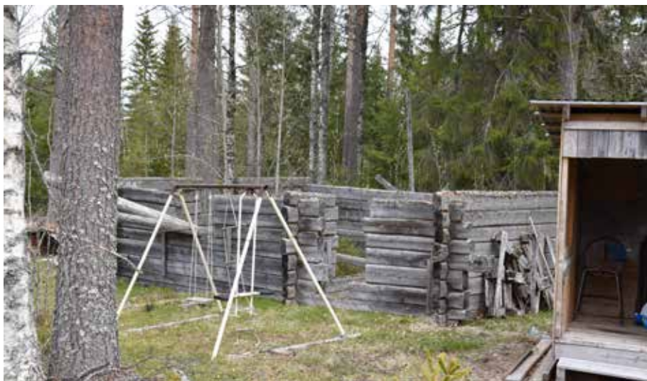
Halvfärdig timmerstomme. Västra Rönnsås 18:10.

Intill fäbodstället finns en mindre slobod med eldstad.