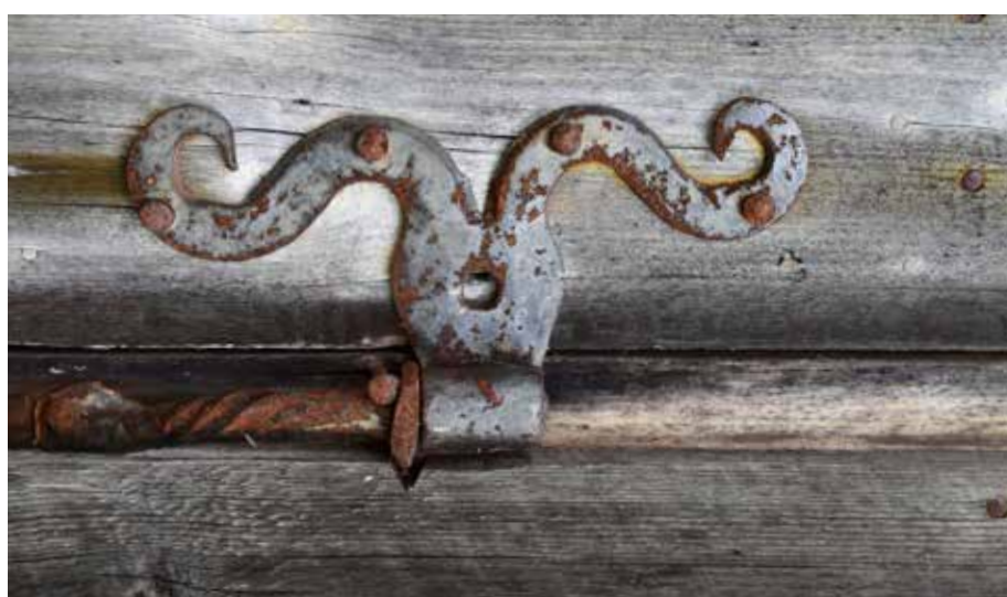
Detalj på uthusdörr. Omsorgsfullt smitt bockhornsgångjärn av typisk 1600-1700-talsmodell. Västra Rönnsås 18:10