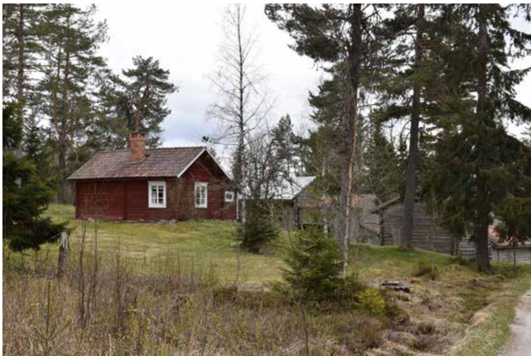
Östra Rönnäs 34:3 sett från norr.