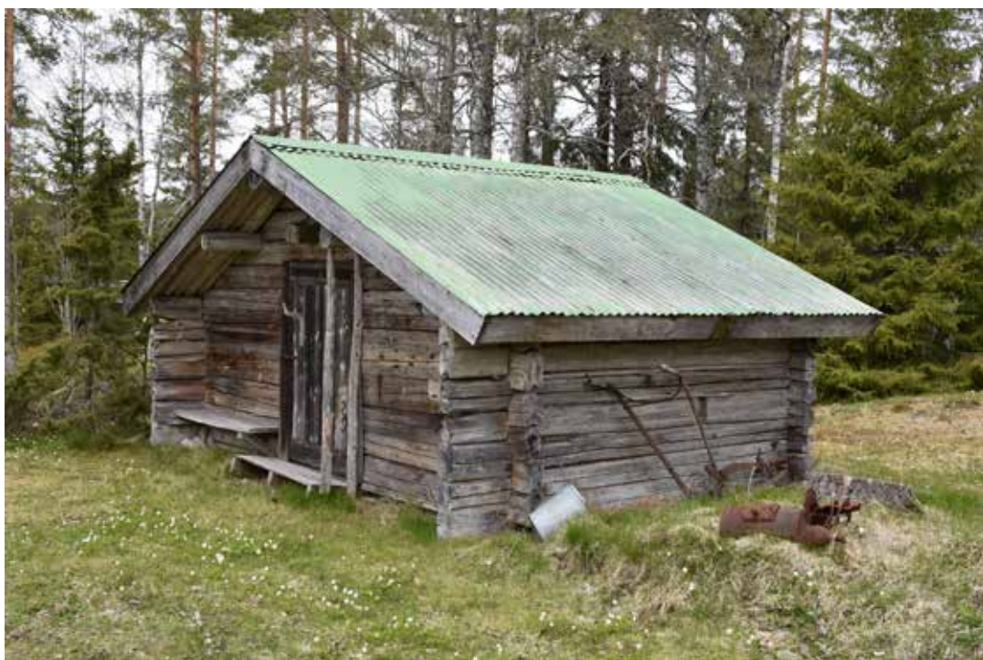
Mindre uthusbyggnad av ålderdomlig karaktär. Dörrbladet med sitt vackra smide, s.17, kan dateras till 1600-1700-tal. Västra Rönns 18:10.