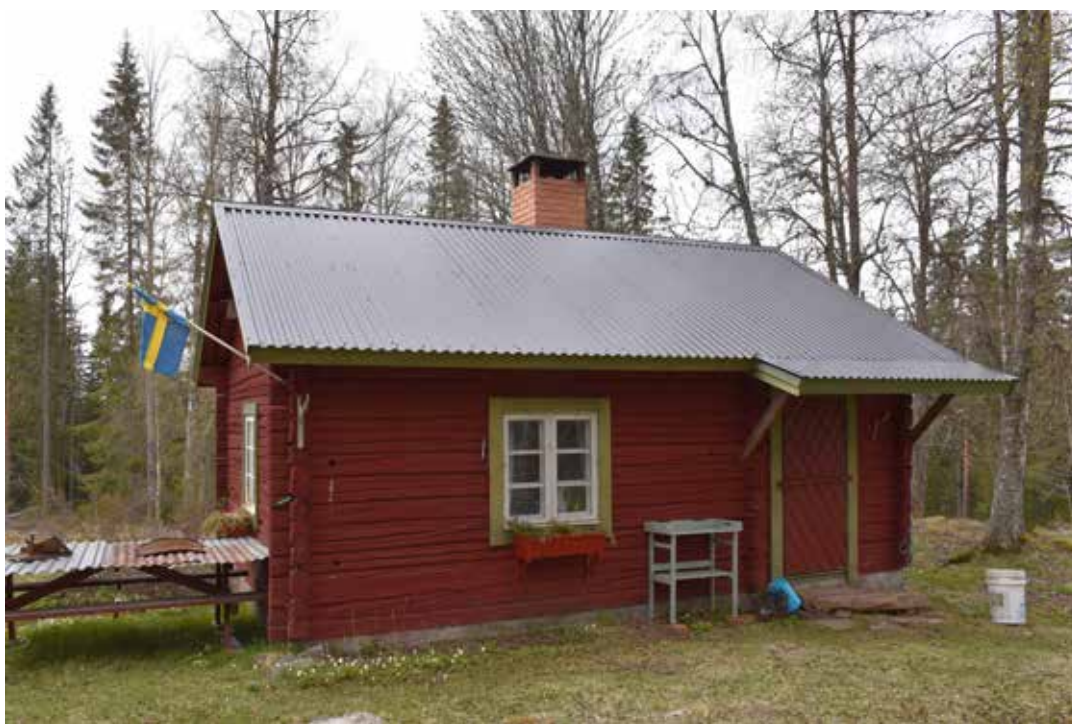
Liten rödfärgad enkelstuga med olivgröna foder, nyare plåttak samt skärmtak. Västra Rönns 18:10.