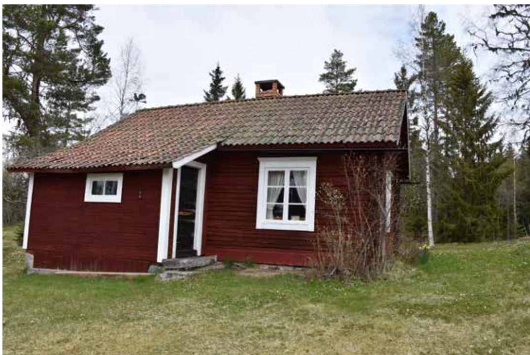
Rödfärgad sidokammarstuga med typiskt vita foder och vindskivor. Östra Rönnäs 34:3.