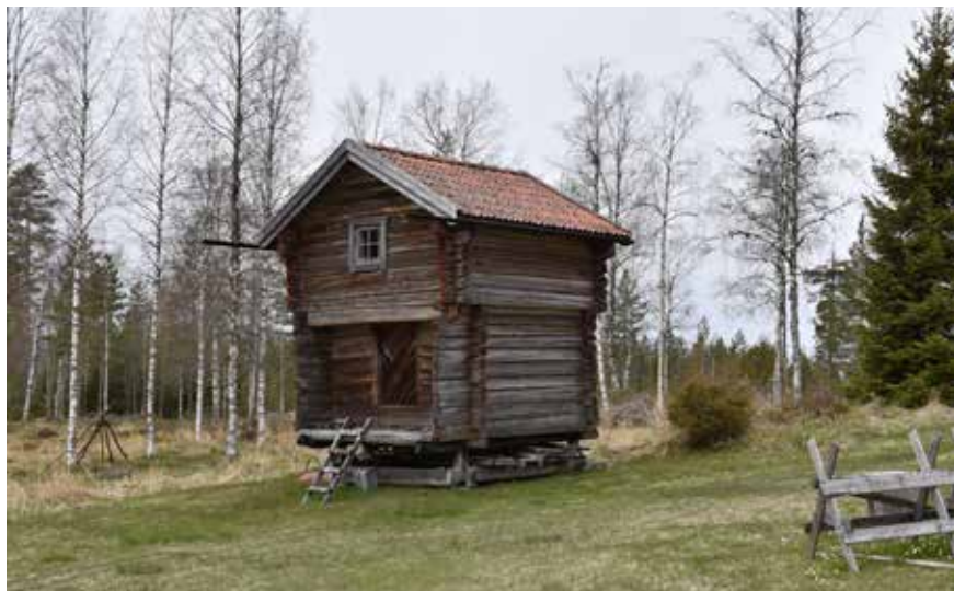
Stolphärbre som sedermera fått fönster i gavelspetsen, troligen då det använts som sommarnöje. Berg II:4