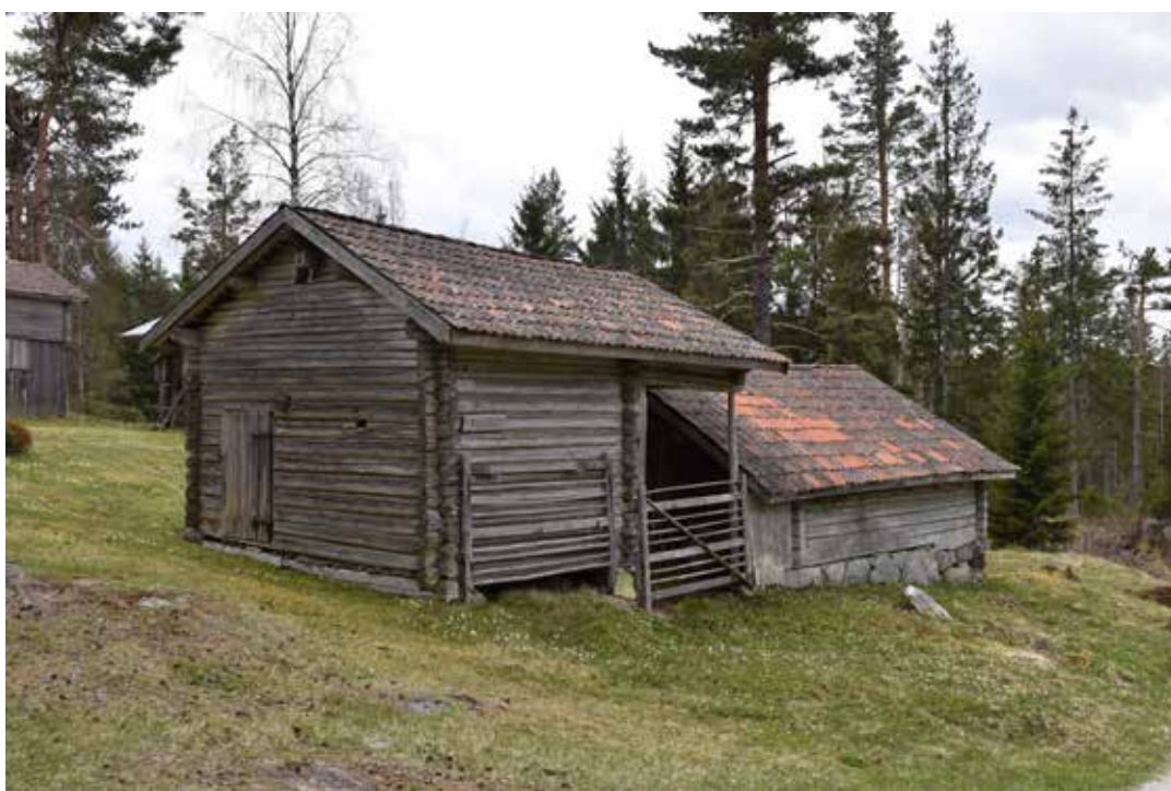
Äldre bodar, där den närmsta byggnaden har året 1660 ristat ovanför dörren. Östra Rönnäs 34:3.