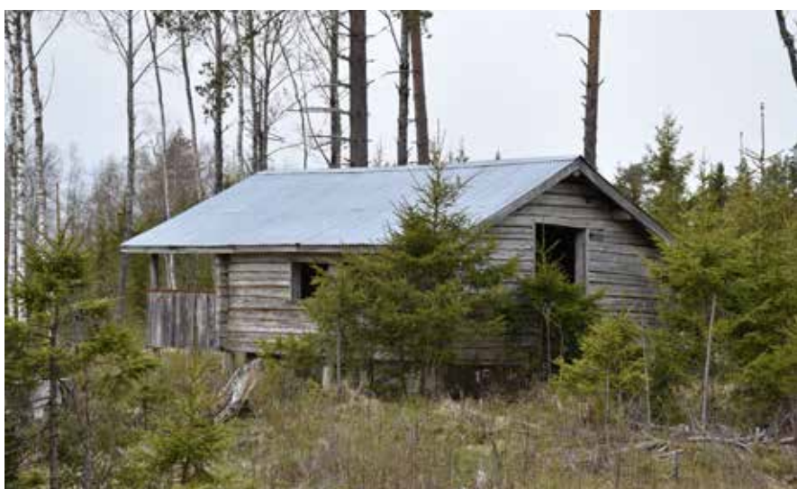
Övergiven timmerstuga som saknar både fönster, dörrar och golv.