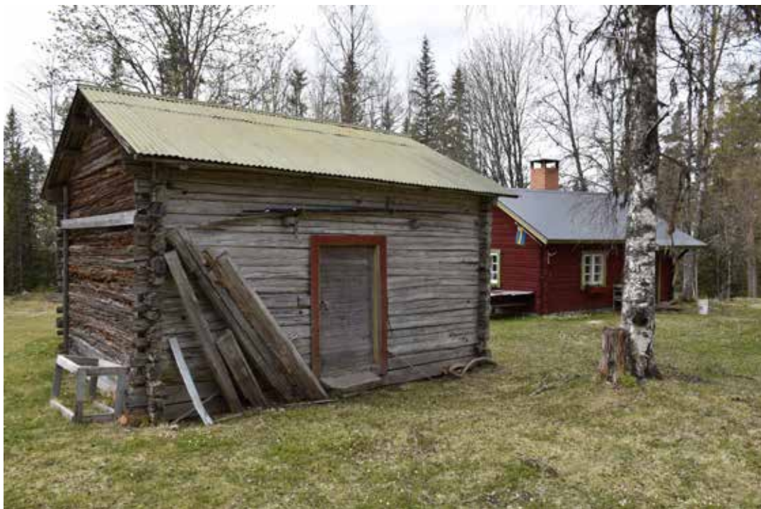
Mindre ekonomibyggning med kraftigt vittrad sydgavel. Västra Rönns 18:10.