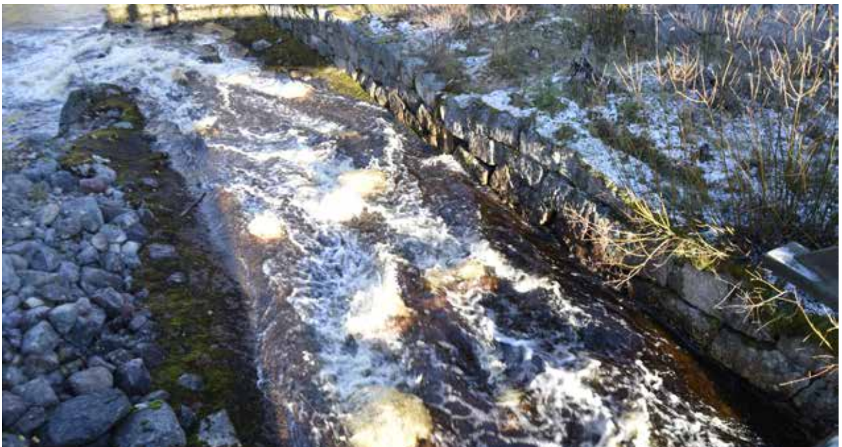
Den mäktiga hyttdammen vid Limå bruk har stödmurar sannolikt tillkomna kring 1804, när bruket först uppfördes.