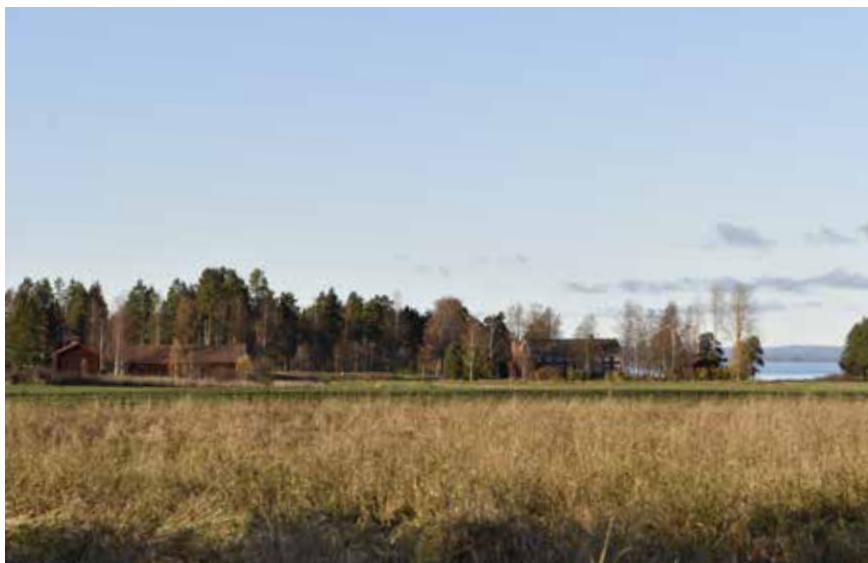
Utsikt över de stora och öppna odlingslandskapen vid Limå bruk. I bakgrunden syns såväl brukets herrgård med flyglar som den kringbyggda fägården. Limå bruk 1:7.

las genom de bevarade sättspelen vid dammen. Sättspelen är sannolikt tillverkade på Övermo varv.