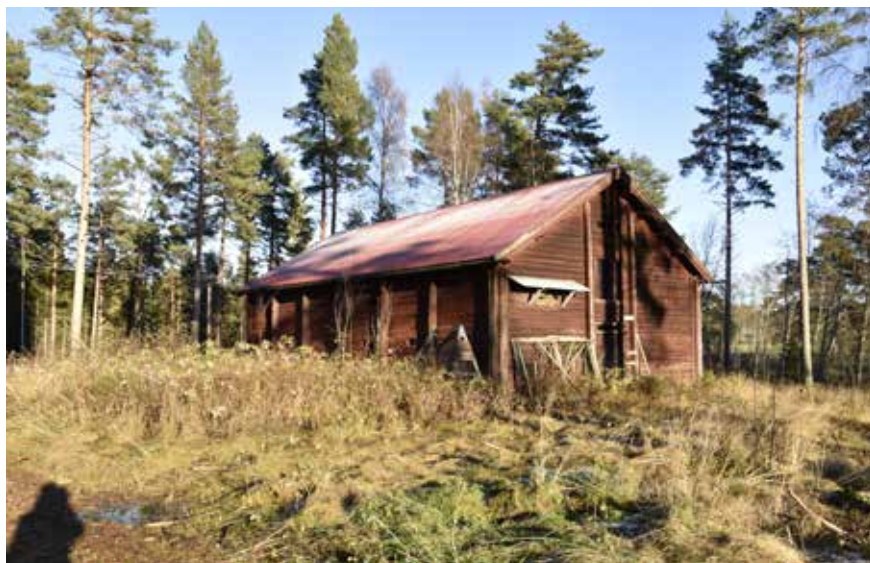
Magasin uppfört 1804 vid Limå bruk. Limå bruk 1:7.

avvecklas och tio år senare hade all verksamhet där upphört. År 1860 återupptog man tackjärnstillverkningen i Limå och i samband med detta kom hyttan att renoveras och byggas om. Verksamheten kom dock enbart att pågå fram tills 1872, varvid Bergslaget återigen stängde verksamheten. Från och med 1873 kom således verksamheten endast att omfatta stångjärnssmide vid Övre bruket. En husbehovssåg och en kvarn fanns dock kvar i Brahammar respektive Limå. I samband med att Domnarvets Jernverk invigdes 1878 nedlades Limå bruk slutgiltigt. Nedläggningen kan förstås i kontext till den så kallade »bruksdöden« som inträffade under 1800-talets senare hälft. Bruksdöden var en slags strukturrationalisering där många små bruk nedlades till fördel för ett fåtal större nytillkomna järnverk där Domnarvets Jernverk var att betrakta som enormt till sin skala. Förändringen skedde bland annat i ljuset av ökad internationell konkurrens till följd av nya tekniker som möjliggjorde en större produktion och mer kostnadseffektiv tillverkning av järn och stål i andra länder. Efter nedläggningen kom dock viss annan verksamhet att ske i Limå, exempelvis omfattande jordbruk och träkolsframställning. Brukets herrgård har även ibland nyttjats som kursgård för Bergslaget.