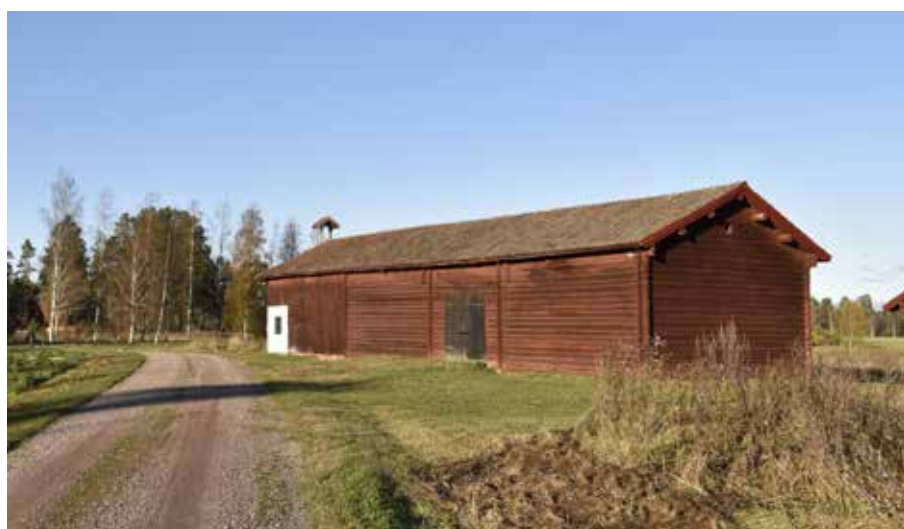
Trösklogen vid Limå bruks fägård. På taket finns en vällingklocka, som användes för att signalera arbetsdagens början och slut och sammankalla till måltider. Limå bruk 1:7.