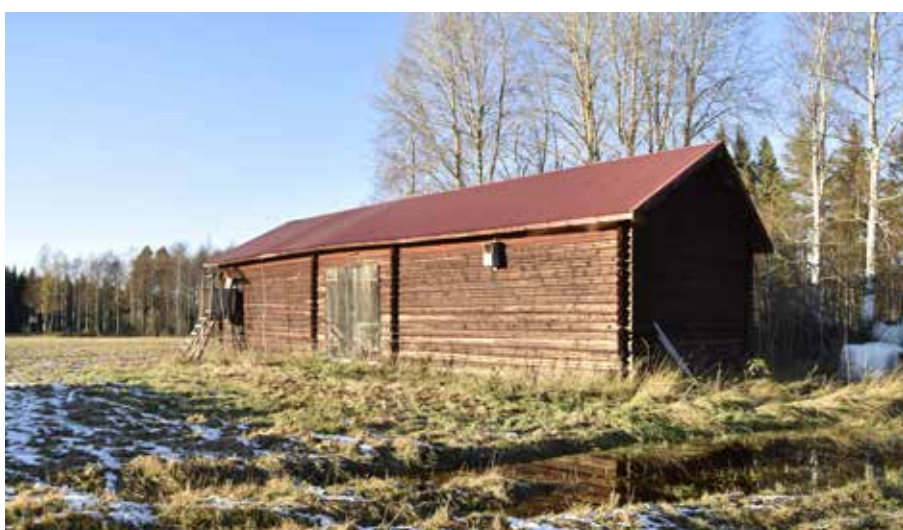
Ovanligt stor timrad tröskloge vid Taxorna, som sannolikt även varit odlingsmark och slogmark till Limå bruk. Limå bruk 1:12.