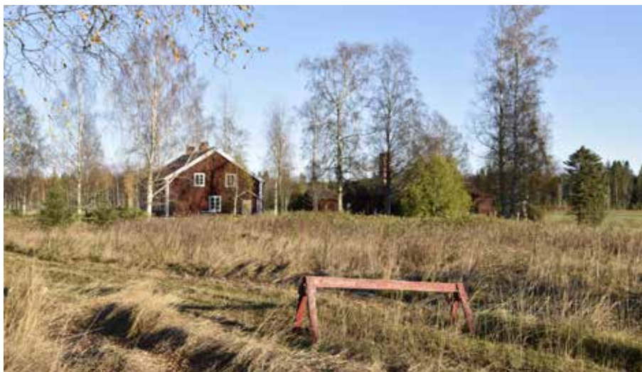
Bruksherrgården vid Limå bruk uppfördes kring 1804 och är en ovanligt stor anläggning för Siljansnäs och Leksandsbygden. Limå bruk 1:7.