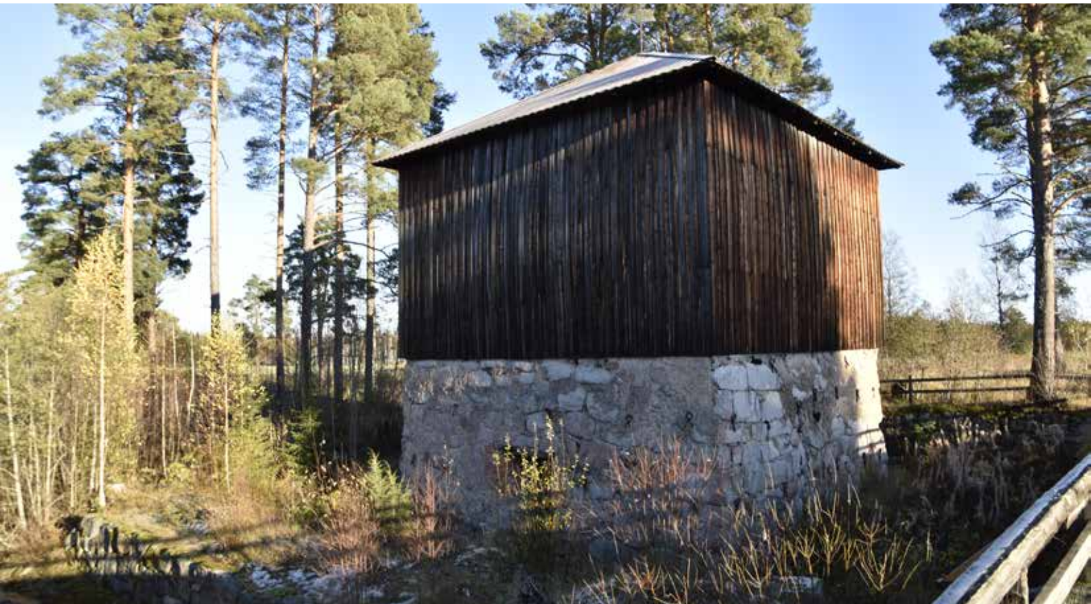
Den gamla hyttan till Limå bruk. Här tillverkades tackjärn som senare förädlades till stångjärn vid bland annat Övre bruket och Brahammars bruk. Björken 153:2.