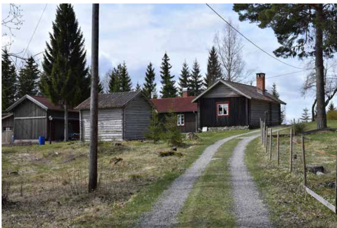
Kringbyggda gårdar med tätt stående ekonomibyggnader förekommer på flera fastigheter. Ovan ses Plintsberg 17:10 och Plintsberg 21:9. Båda gårdarna är till- eller ombyggda i senare tid.