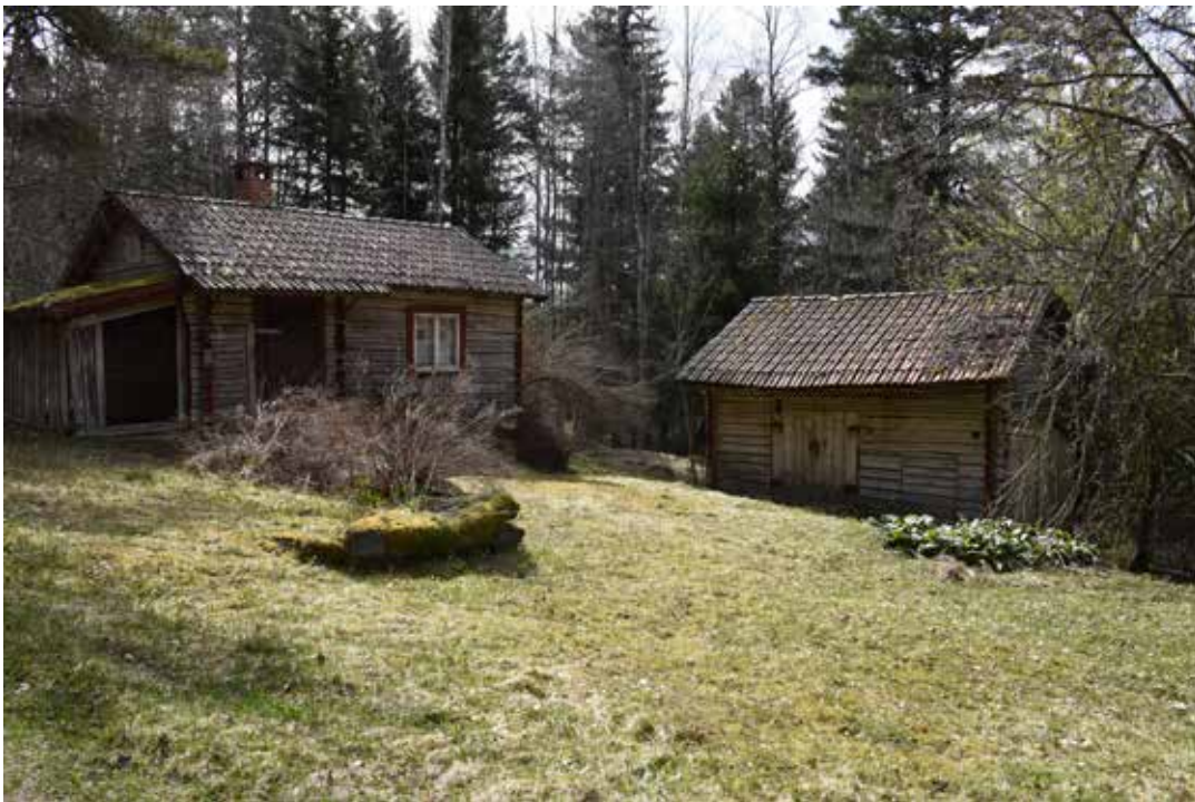
Få gårdar är helt kringbyggda i Norr Bertilsbo. Vanligast är istället att byggnaderna är vinkelställda så som exemplen ovan på fastigheterna Plintsberg 29:16 respektive Laknäs 36:14.