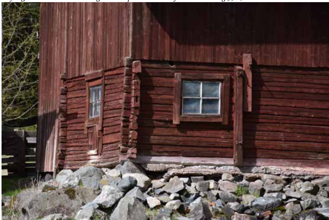
Detaljbild på ladugård. Foder och andra snickerier har lämnats enkla och infärgade i samma kulör som övriga fasadlivet. I förgrunden ses ett stort odlingsröse. Plintsberg 35:17.