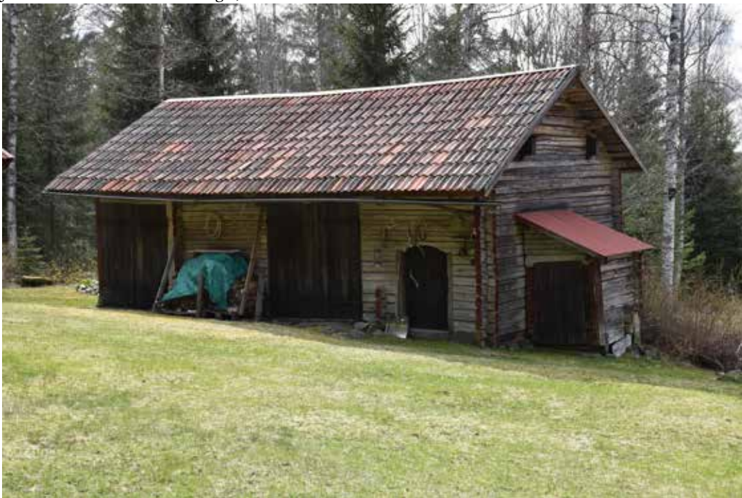
Takfallen är vanligen klädda med tvåkupigt tegel, även om enstaka plåttak förekommer. Här har avträdet på gaveln försetts med rödmälad plåt. Plintsberg 29:16.