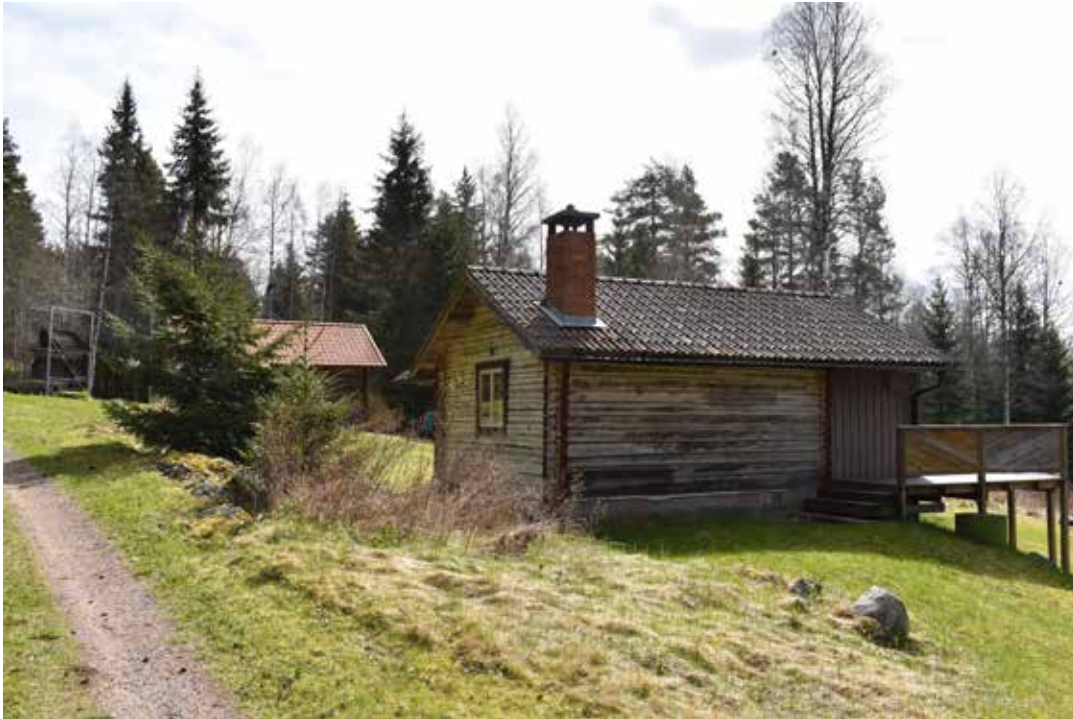
Merparten av byggnaderna i Norr Bertilsbo är låga och smala till formen. Detta hus har sedermera försetts med en terrass. Plintsberg 29:16.