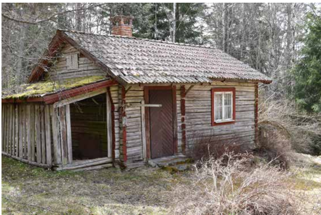
Små enkelstugor har historiskt varit den vanligaste bostadsformen på många av Leksands fäbodrar. Laknäs 36:14.