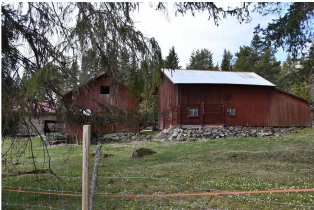
Norr Bertilsbos enda bofasta jordbruksgård. De välbyggda ekonomibyggnaderna är betydligt större än de man vanligen hittar på en renodlad fåbod. Plintsberg 35:17.