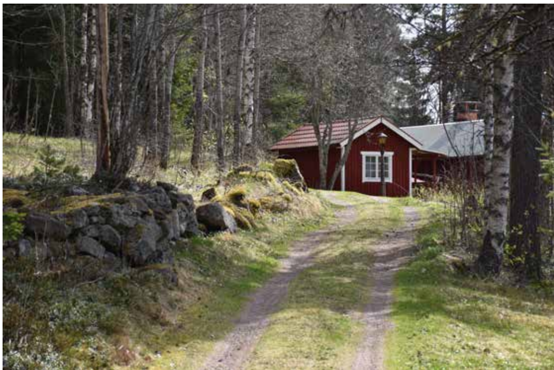
Gårdarna nås över gamla välskötta skogsvägar som inte sällan kantas av stora odlingsrösen eller staplade stenmurar. Plintsberg 21:9