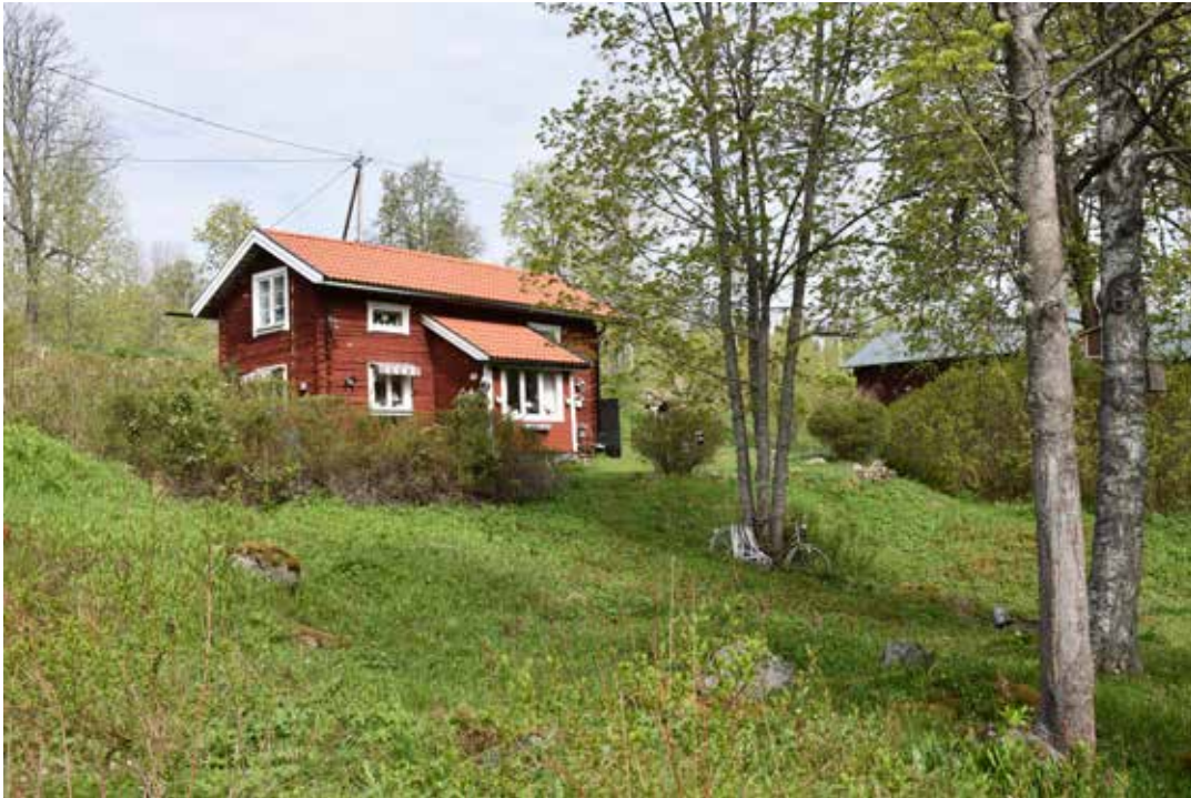
Äldre rödfärgad stuga med senare tillbyggnad. Oxberg 3:5.