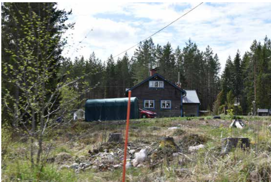
Modern villa i två våningar med liggande grålaserad panel och foder i gråblått. Knäpbodarna 1:6.