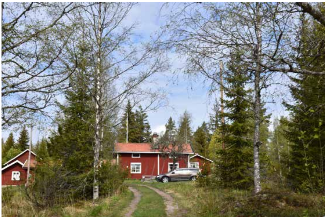
Äldre kringbyggd gård med panelklädd enkel- eller sidokammarstuga. Byggnaderna är något moderniserade men följer ännu en tydlig kringbyggd form. Knäpbodarna 1:2.