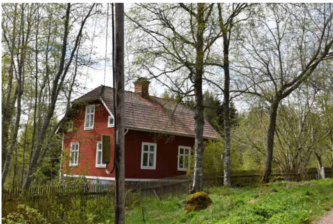
Korsplansvilla med fyrluftsfönster och tillhörande trädgård. Villan är tidstypisk för sekelskiftet 1900 och är snarlik det hus som återfinns på fastighet Oxberg 3:13. Insjön 4:15.