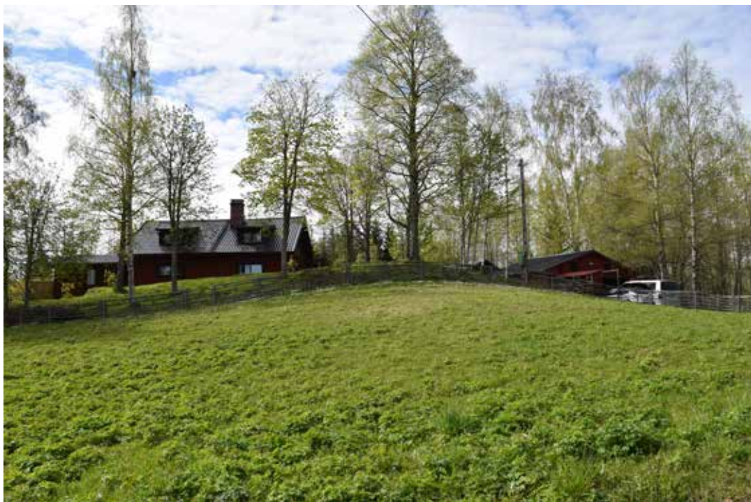
Villa med tillhörande garagebyggnad från 1900-talets senare hälft. Villan är bitvis placerad bakom ett krön, något som gör den mer diskret i landskapet. Oxberg 3:9.