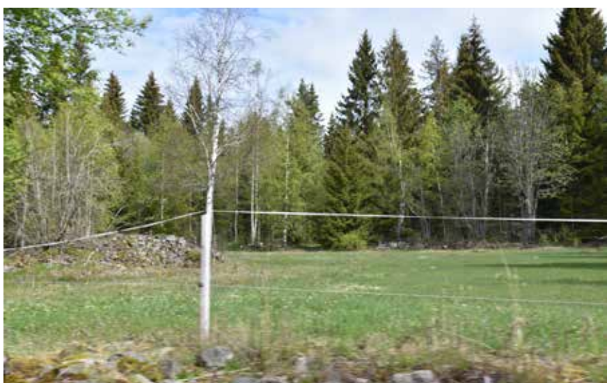
Öppna och hävdade odlingsmarker kring Oxberg. Landskapet kantas av flera odlingsrösen som ger landskapet karaktär och kan berätta om de bitvis mödosamma förhållanden som präglade jordbruket i skogsbyarna.