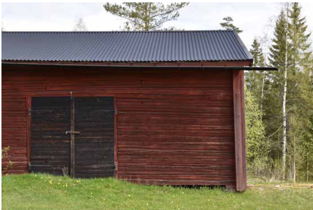
Äldre hölada eller tröskloge med rödfärgat liggtimmer och svartfärgade brädportar. Oxberg 7:4.