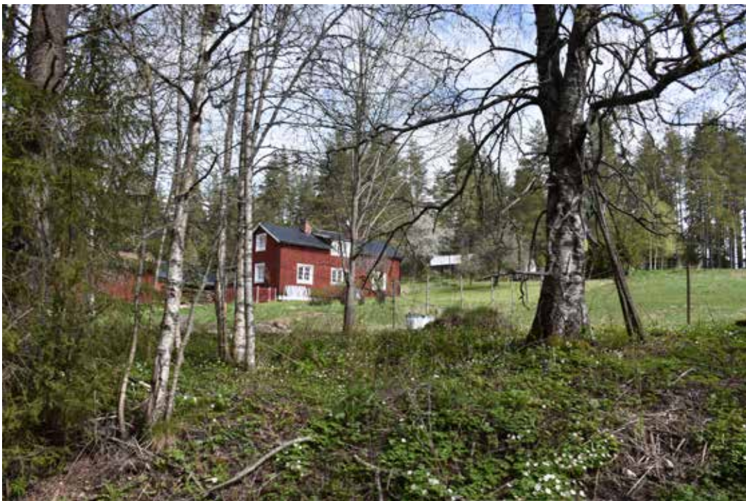
Renoverad äldre stuga med moderna fönster och svart plegeltak. Knäpbodarna 1:5.