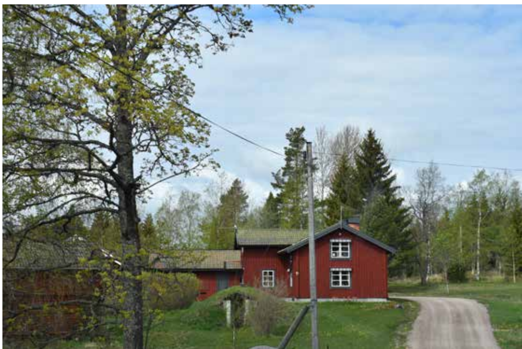
Modern större villa på betonggrund. Delar av huset kan vara äldre och står idag placerat så det smälter in i en kringbyggd gårdsplanlösning. Oxberg 7:4.