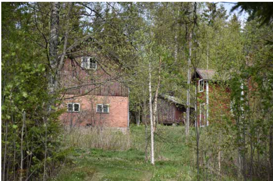
Oförvanskad jordbruksfastighet med sidokammarstuga till höger och ladugård delvis i tegel. Övre Heden 24:22.