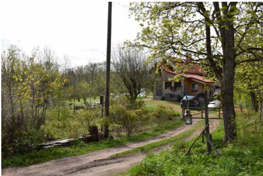
Modernare småskalig villa med flera mindre tillbyggnader. Fasaden är klädd i alternerande stående och liggande panel som lämnats omålad. Oxberg 3:8.