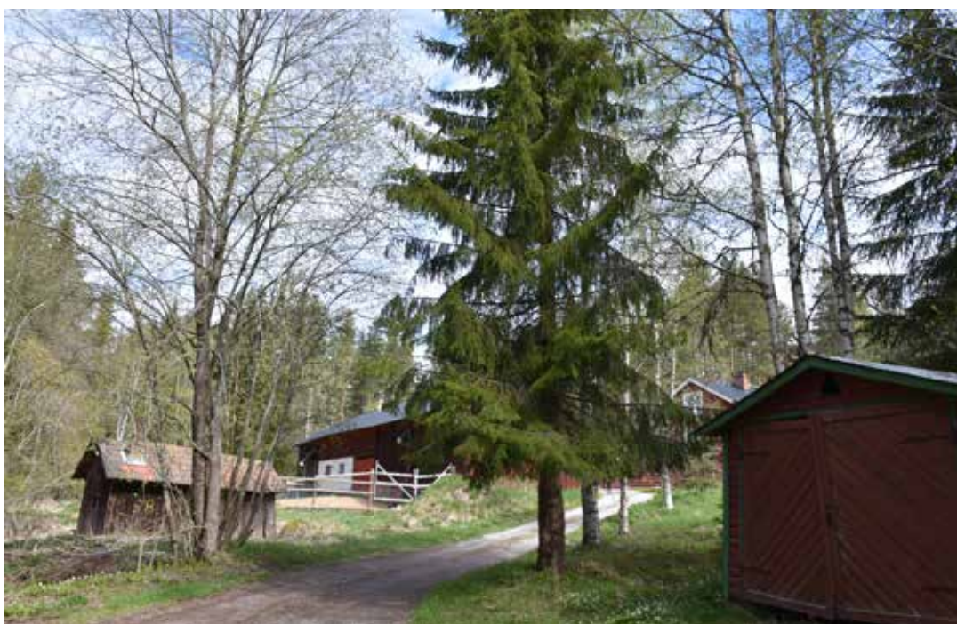
Mitt i bilden syns en ladugårdsänga med tidig 1900-talskaraktär, bland annat i form av vitrappad mur vid djurhusdelen.