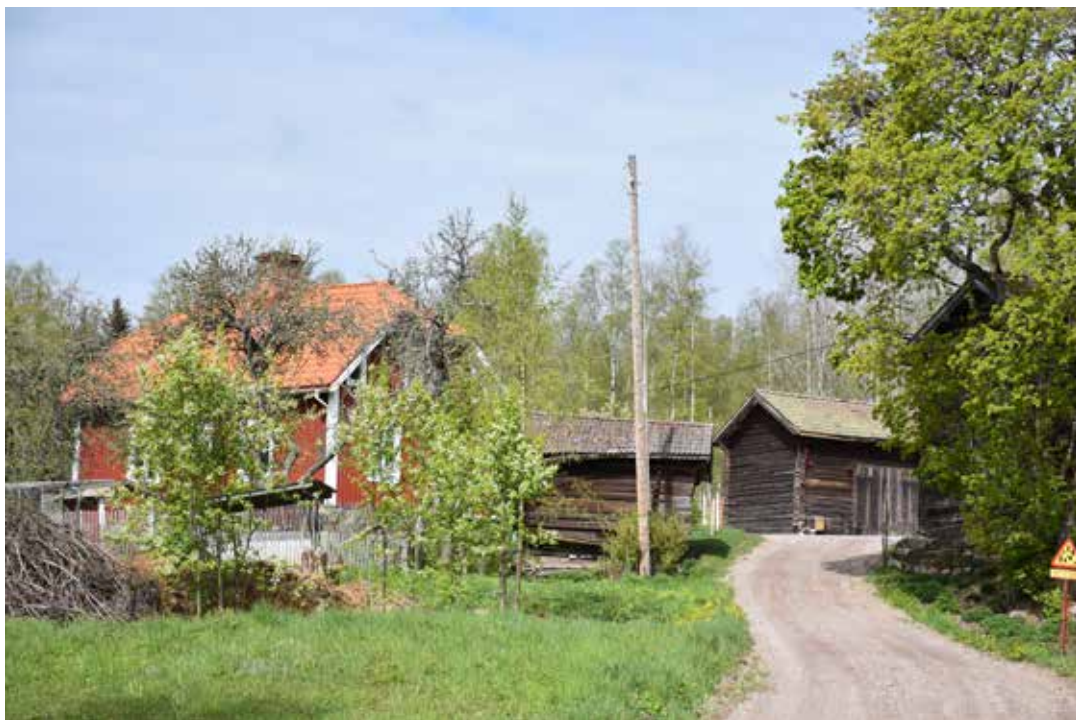
Äldre kringbyggd gård med ålderdomliga ekonomibyggnader. Korsplansvillan med valmat tak tillkom troligen runt sekelskiftet 1900. Innan dess har gården sannolikt varit fyrkantsbyggd. Oxberg 3:13.