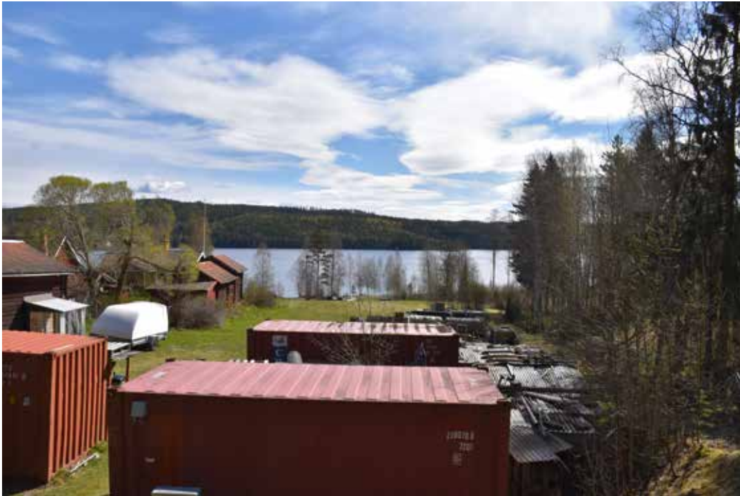
Perhansbodarna med sin öppna sikt ut över Årbojsjön.