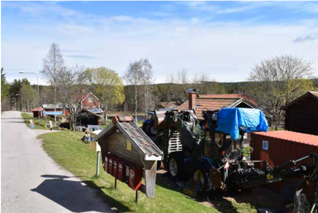
Fäbodstugorna ligger på en smal yta mellan Årbojön och en asfalterad bilväg.