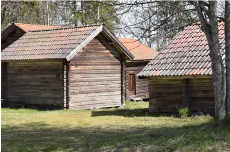
Ålderdomlig och välbevarad fäbodgård med ofärgade naturligt grånade fasader. Ullvi 26:10.