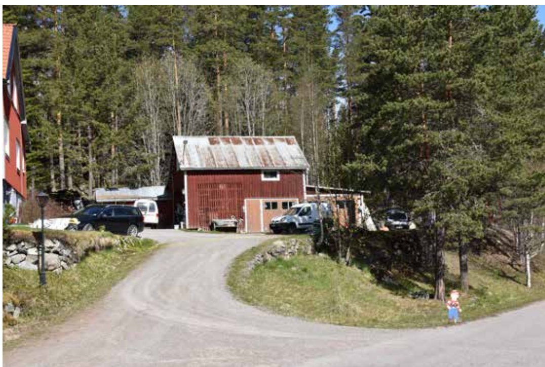
Modernare villa med vy ut över Årbojön och Perhansbodarna. Gården är en av få bofasta fastigheter i området. Ullvi 2:9.