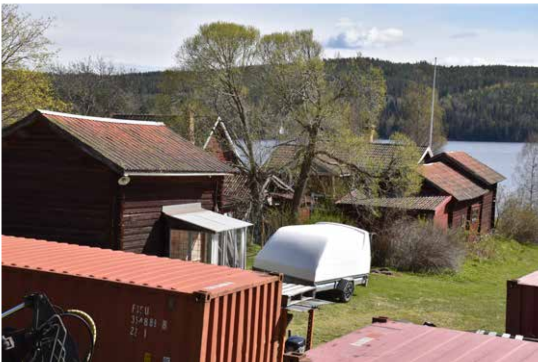
Vy från vägen över tätt stående och kringbyggda fåbodgårdar. Ullvi 2:17 och Ullvi 2:20.