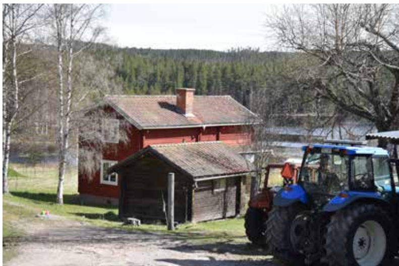
Äldre rödfärgad stuga och bod. En av få fåbodgårdar som inte är kringbyggd eller vinkelställd. 32:12.