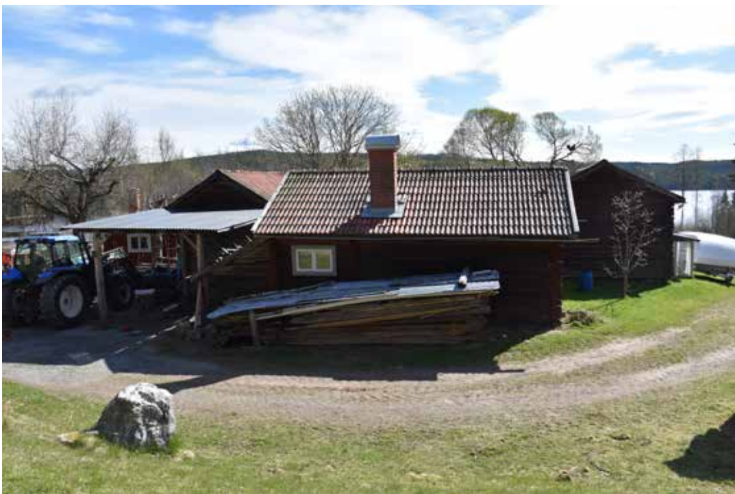
Tydligt kringbyggd gård med delvis moderniserade byggnader. Ullvi 2:17.