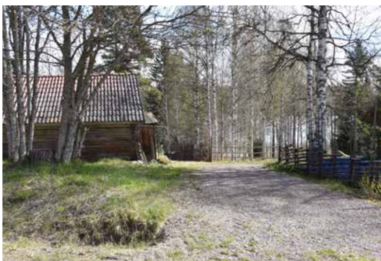
Lertegel är det överlägset vanligaste takmaterialet i Perhansbodarna, där enbart ett fåtal takfall bytts ut mot plåt. Det patinerade teglet är värdebärande för en ålderdomlig karaktär. Ullvi 26:10.