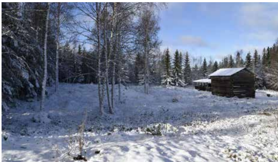
Delvis öppen före detta odlingsmark med odlingsrösen, som dessvärre är översnöade på bilden. Djura 23:25.