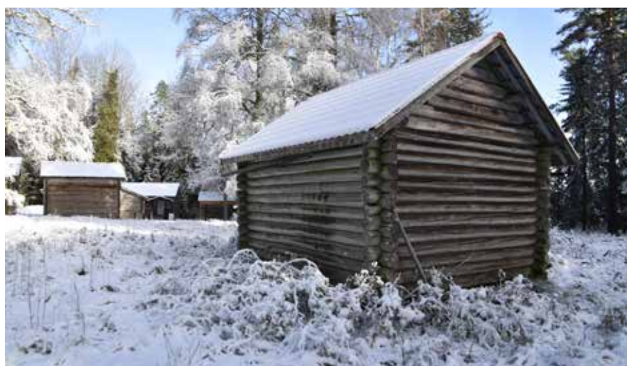
Byggnad i den östra klungan som kan ha nyttjats som lövlada. Djura 24:18.