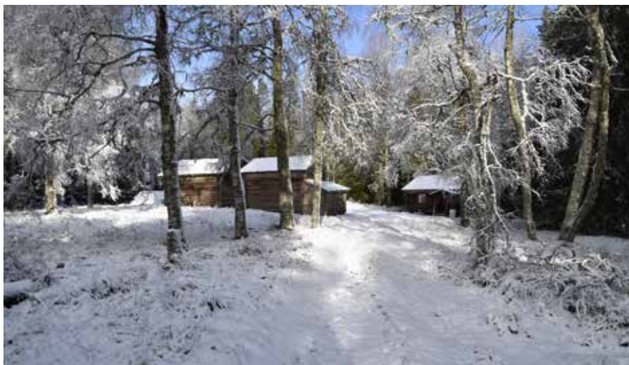
Den östra klungan eller gruppen med två fäbodgårdar fortfarande tätt inbäddad i skogsmark. Här finns en mångfald av lövträd. Djura 24:18 m.fl.