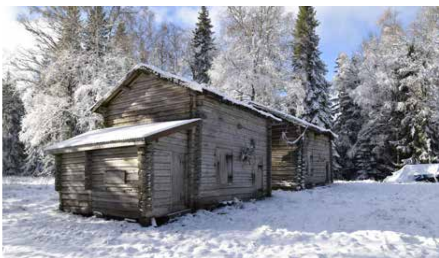
Två stall av ett slag som tycks ha varit särskilt vanliga på fäbodar i Djuraabygden. Djura 24:18.