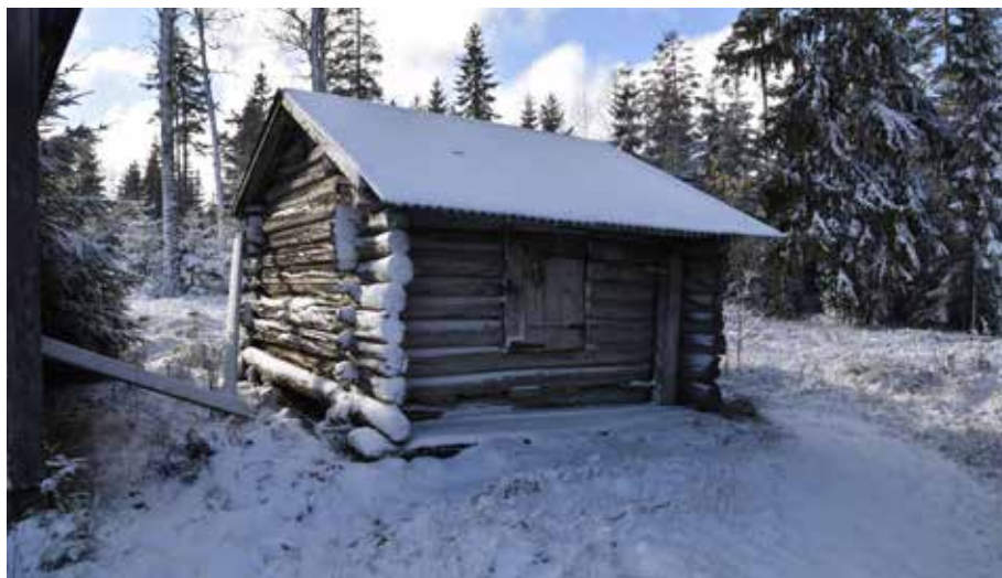
Långsideshärbre som kan vara från 1500-talet. Byggnaden är av ett slag som idag är mycket ovanligt. Djura 6:25.