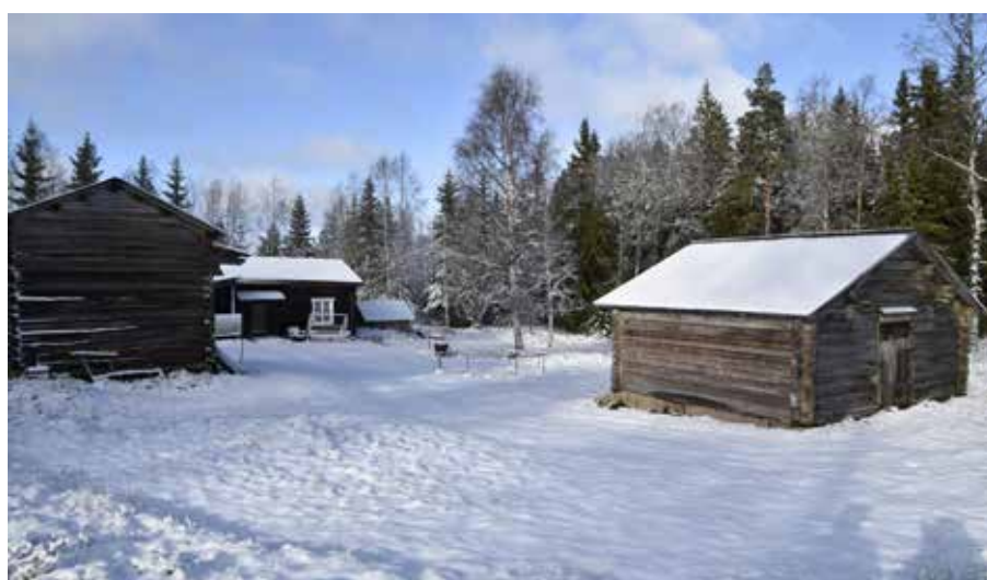
Glest kringbyggd fäbodgård med stuga, stall och fjäls. Djura 23:25.