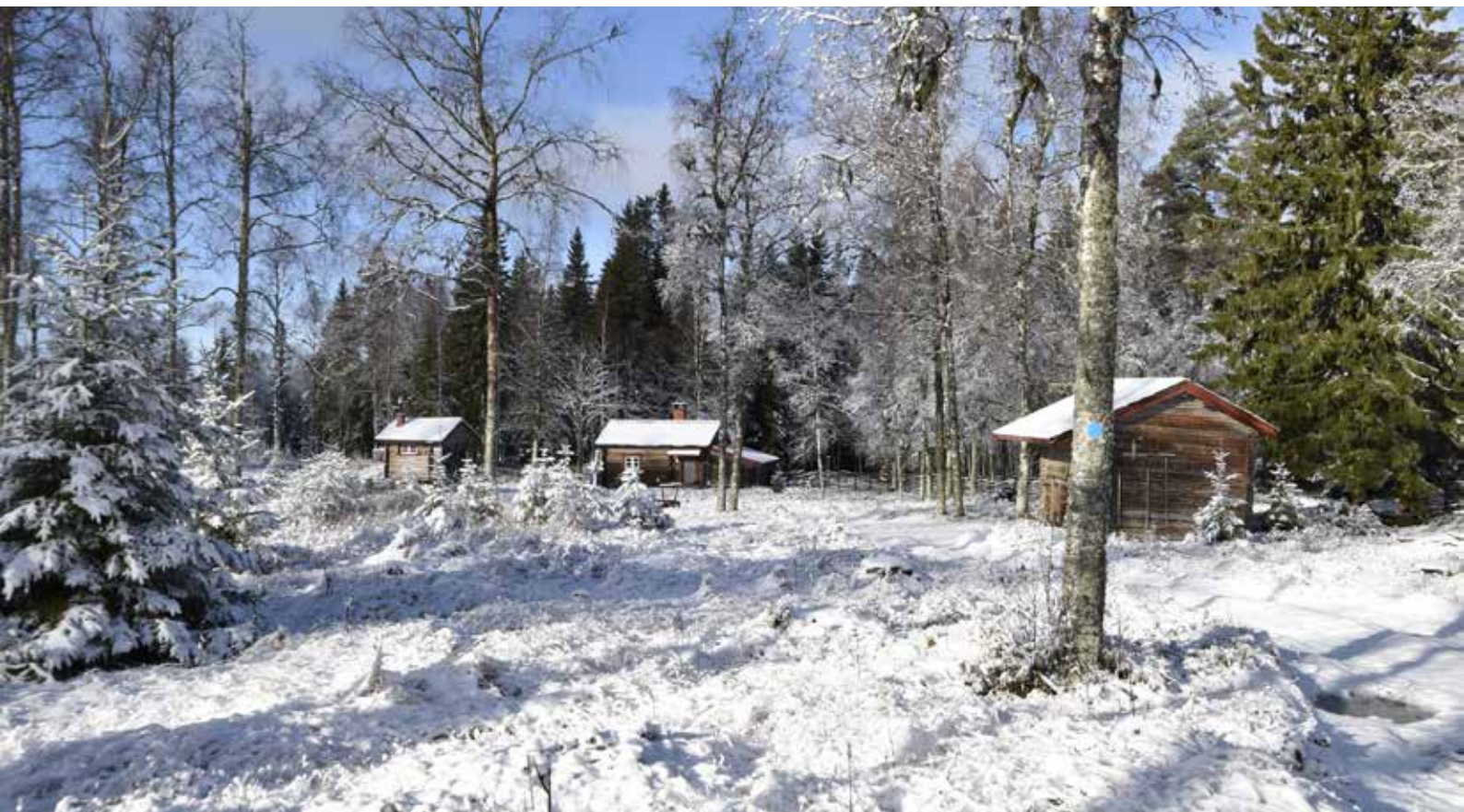
Fäbodgård delvis inhägnad av gärdesgård mot en gammal fägata i den västra delen av Sångberget. Härbret till vänster är ett av de härbren som har laggtak. Djura 42:4.