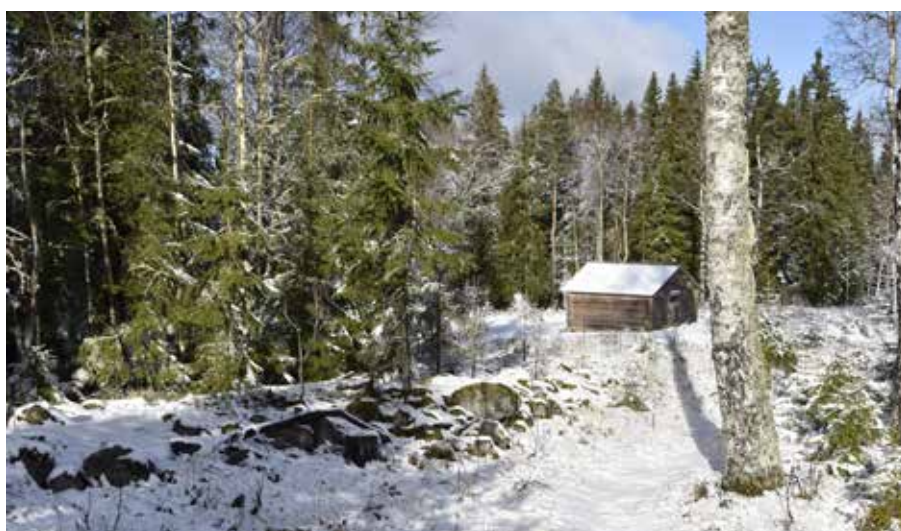
Stengärdesgård eller odlingsröse i den västra klungan. I bakgrunden skymtar ett fjäls. Området är rikt på lämningar från jordbruk och äldre numera försvunna fäbodgårdar. Djura 17:10.