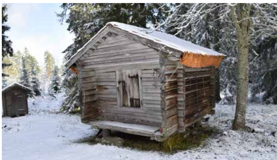
Gavelhärbre med laggtak, möjligen uppfört någon gång under 1700-talet. Djura 24:18.