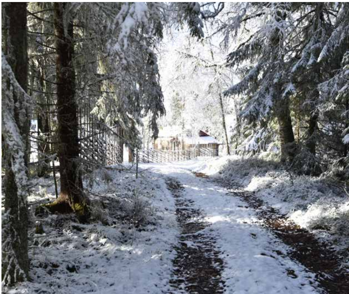
Skogsvägen mot den västra delen av fåbodstället kantas delvis av gärdsgård.