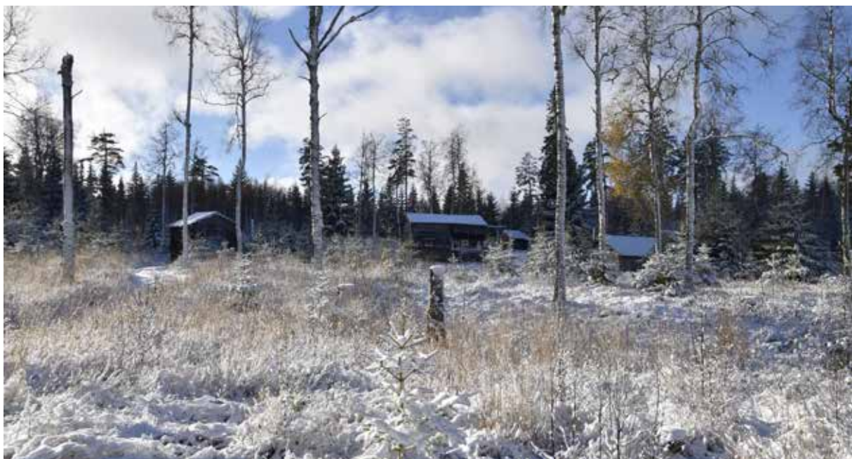
Two fäbodgårdar på den sydvästra delen av fäbodstället. Marken har nyligen avverkats varvid öppen kontakt mellan fäbodgårdarna i den västra klungan eller gruppen återtagits. Djura 30:5 m.fl.