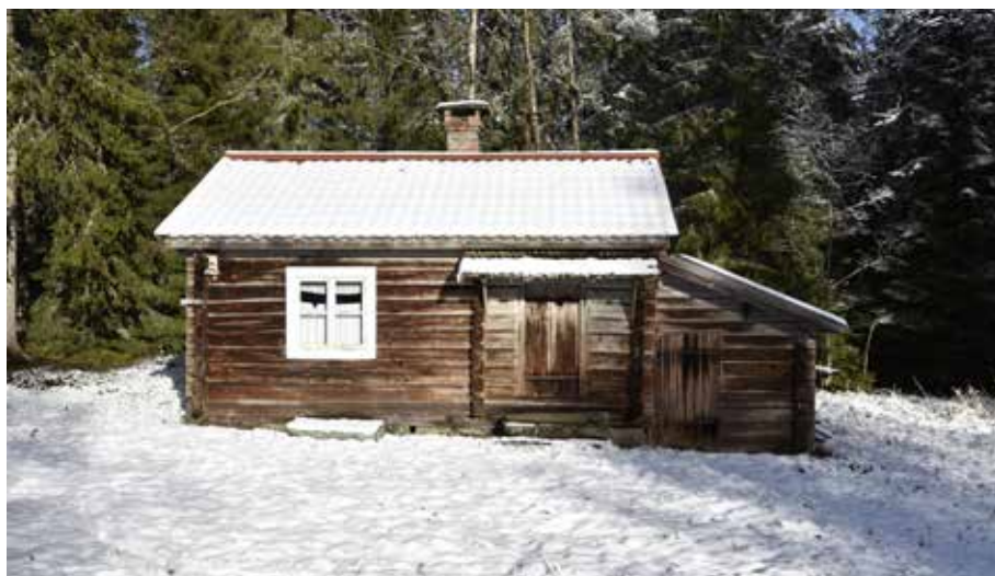
Välbevarad äldre fäbodstuga i form av en enkelstuga med tillbyggt vedlida mot kortsidan. Djura 24:13.