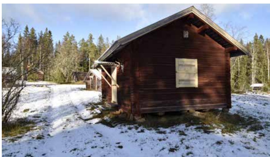
Några enstaka byggnader har i senare tid rödfärgats. Fäbodstuga på fastigheten Alvik 62:8.