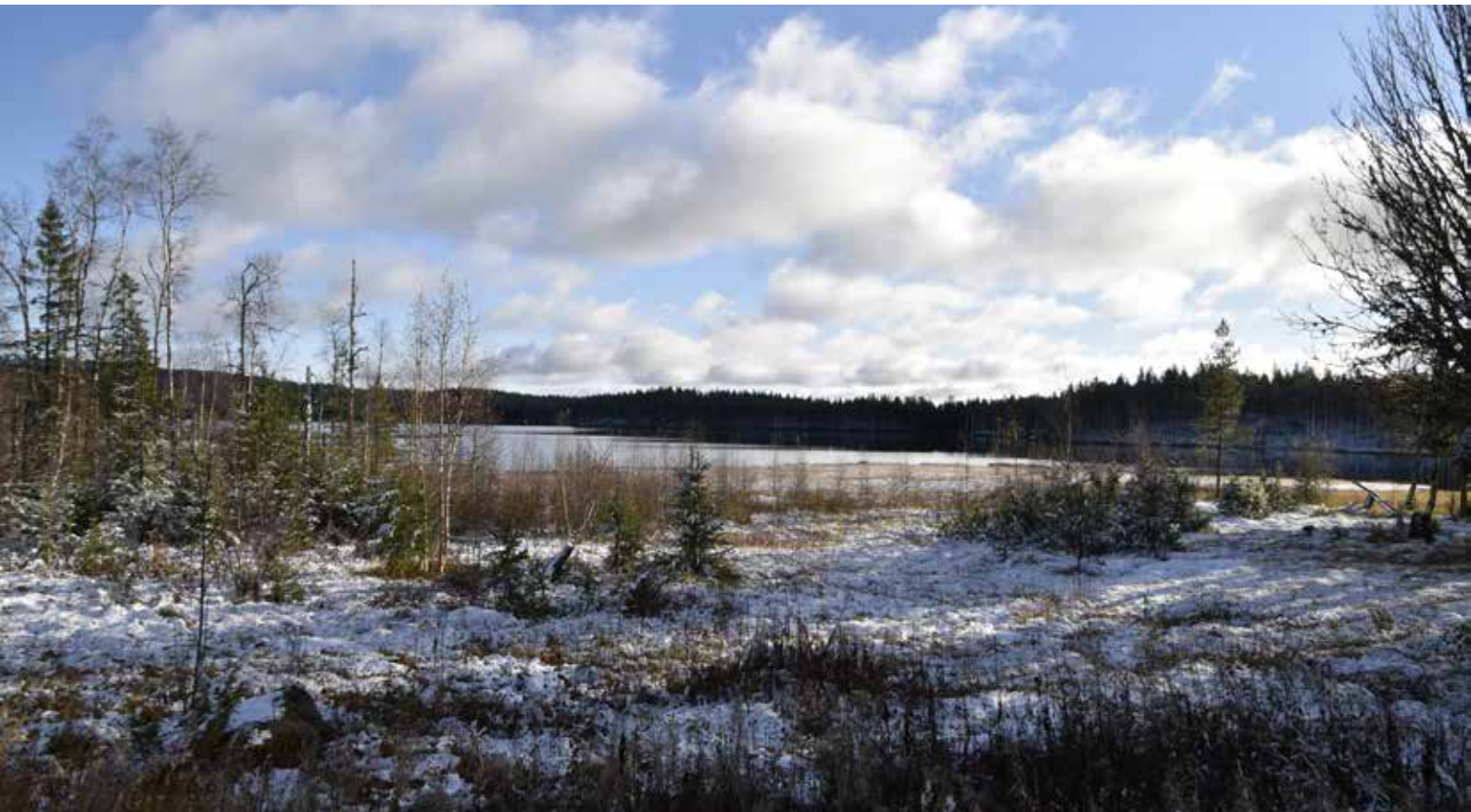
Utsikt över Skäppsjön från fäbodstället.