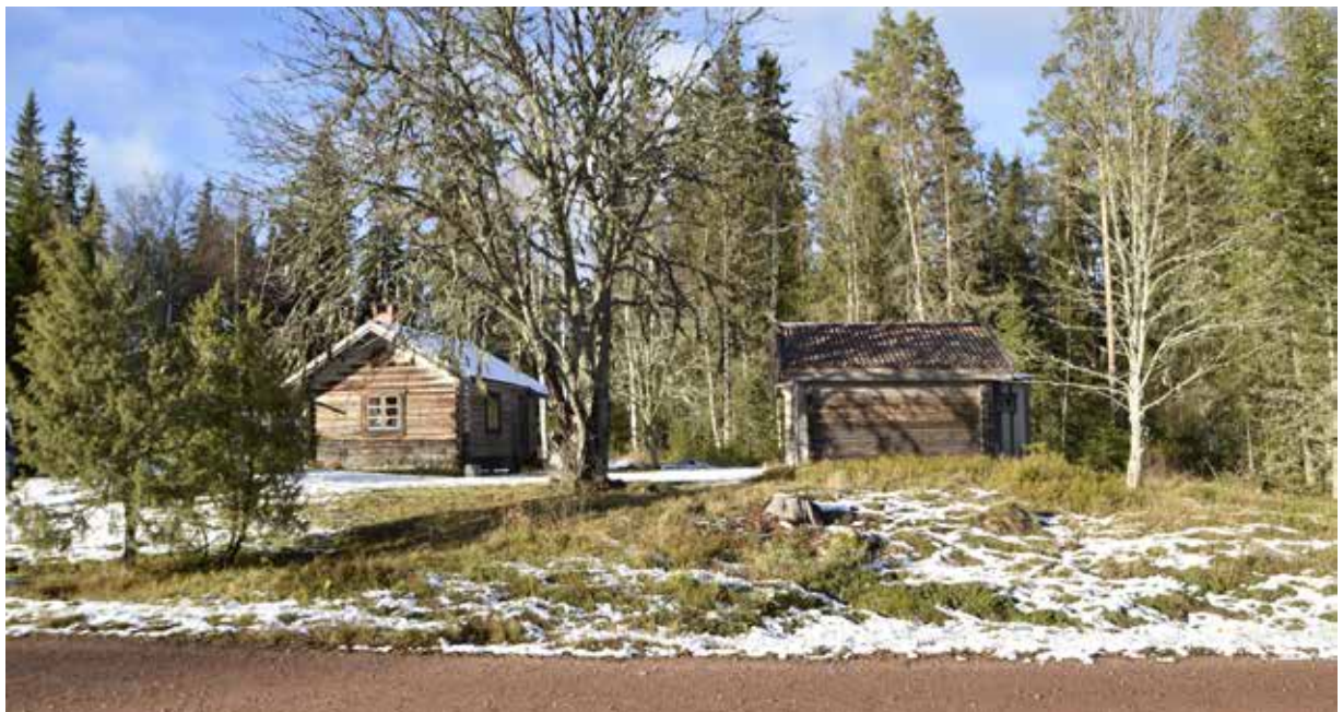
Fäbodgård med stuga och härbre på fastigheten Almo 114:1. Vid fäbodgården finns gamla lövträd från vilka löven kan ha nyttjats som foder i djurhållningen.