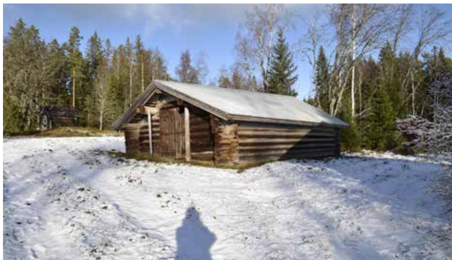
Timrat fäjs på fastigheten Alvik 62:8. Liknande fäjs finns idag nästan enbart bevarade på fäbodarna.