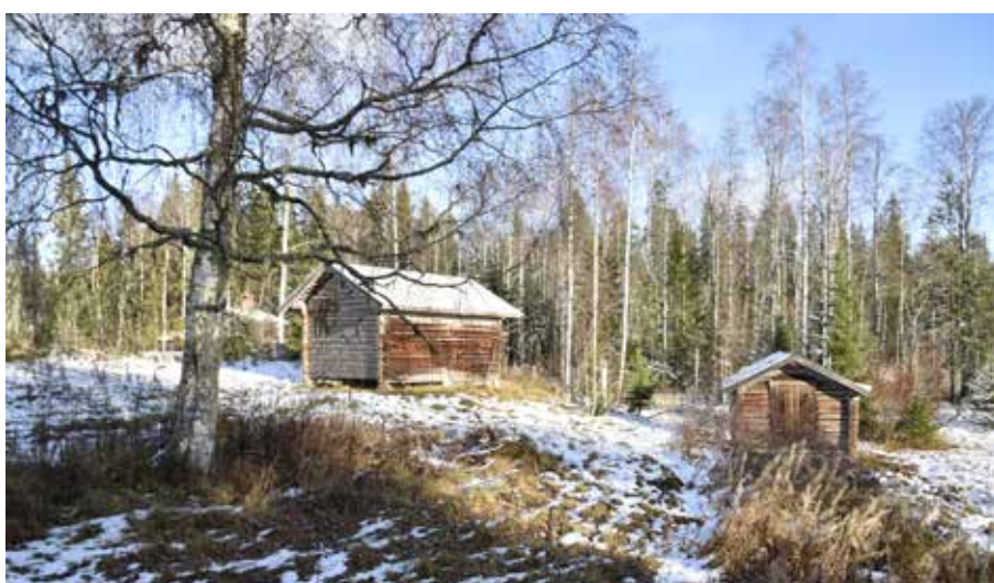
Två bodar eller lador belägna på den södra delen av fåbodstället. Liknande timmerhus nyttjades på oli- ka sätt i arbetet med djuren, exempelvis till förvaring av foder. Alvik 62:8 och Alvik 89:1.