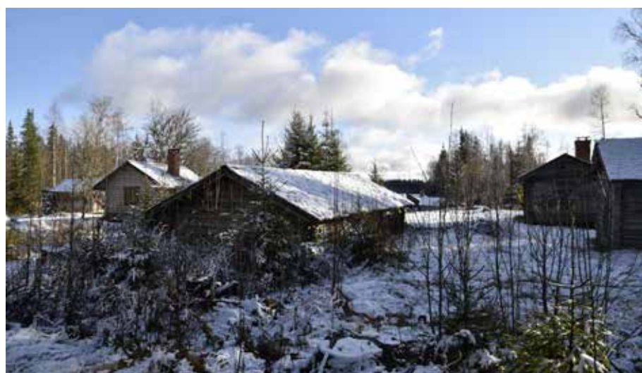
Utsikt över den bitvis tätt grupperade timmerhusbebyggelsen från norr. Fäbodgården närmast i bild är belägen på fastigheten Alvik 54:1.