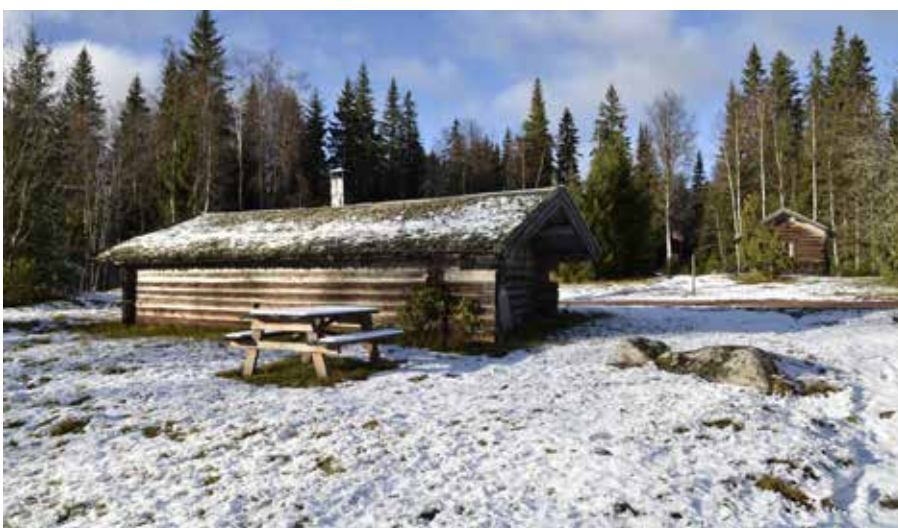
Ovanligt stort timrat fåjs på fastigheten Björken S:20. Byggnaden är idag omgjord till raststuga och har fortfarande stickspånstak, vilket är anmärkningsvärt.