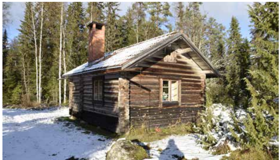
Förhållandevis välbehållen fåbodstuga på fastigheten Almo 114:1.