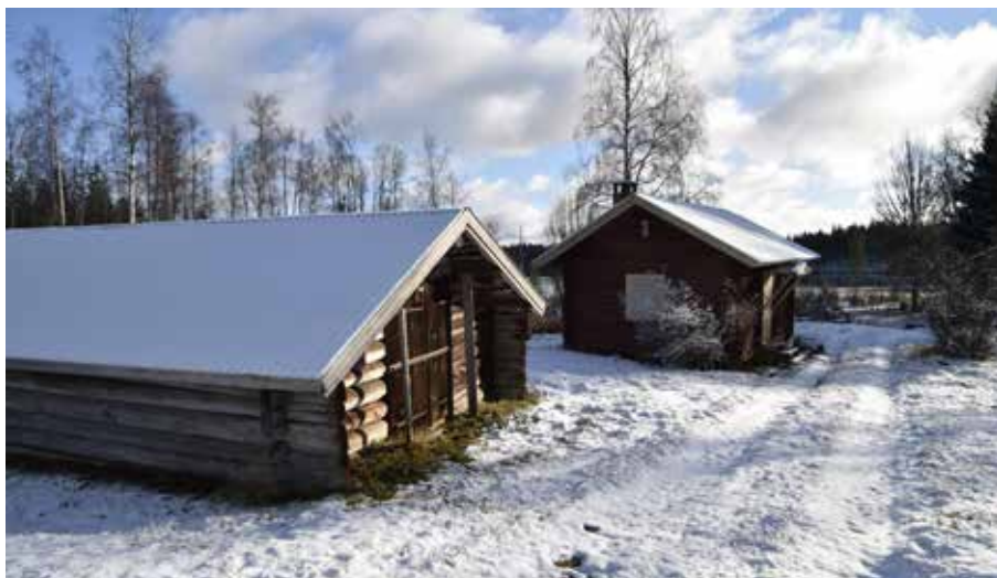
Ålderdomligt timrat fåjs av ansenlig storlek på fastigheten Alvik 62:8. Intill finns en äldre fåbodstuga.