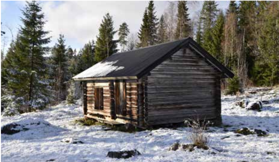
Dubbelbod i timmer på den södra delen av fåbodstället. Almo 80:1.