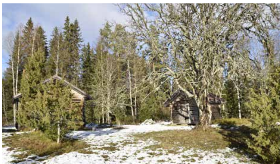
Fåbodstället är tätt in- bäddat i skogsmark. Almo 114:1.