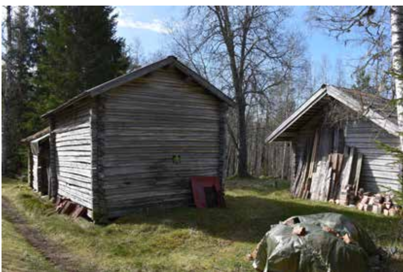
Liten vinkelställd gård som troligen tidigare varit kringbyggd. Fäbodvägen är bitvis igenväxt men är fortfarande framkomlig med bil. Lägg märke till det stora lövträdet på gårdstunet. Västberg 3:15.