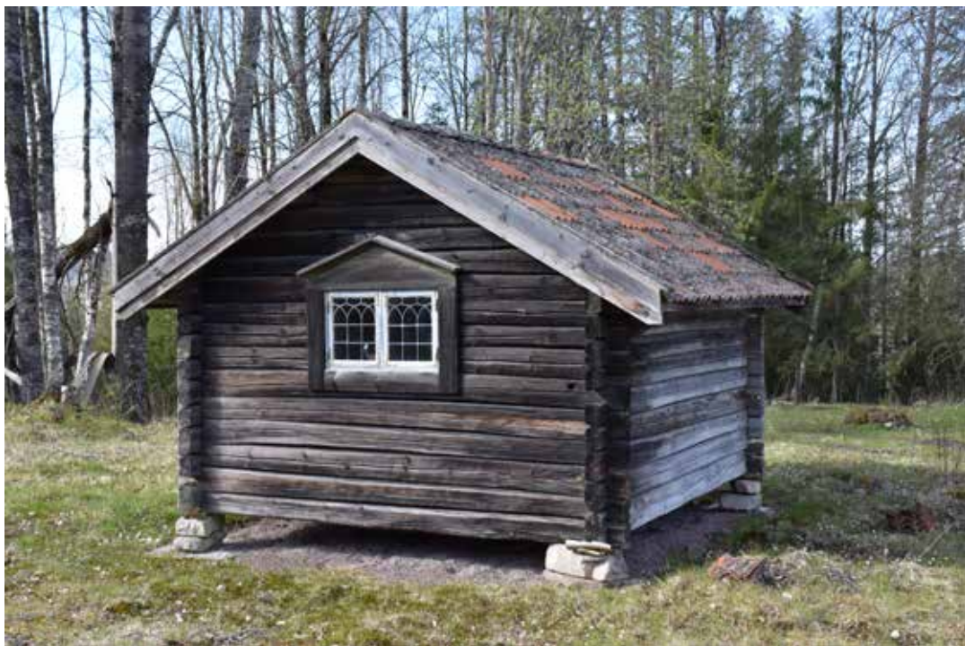
Liten friggebod, troligen tillkommen under 1900-talets senare hälft. Lägg märke till de blyspröjsade fönstren.