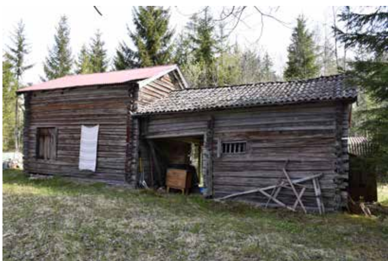
Tröskloge och portlider, båda med naturligt grånade väggar. Logen har senare fått ett tak i korrugerad röd plåt. Västberg 3:15.