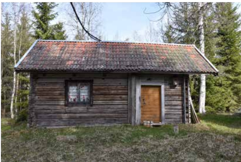
Liten enkelstuga där foder och vindskivor lämnats ofärgade, tillika fasaden. Bräddörren har givits en kulör liknande ljus guldockra. Västberg 3:15.