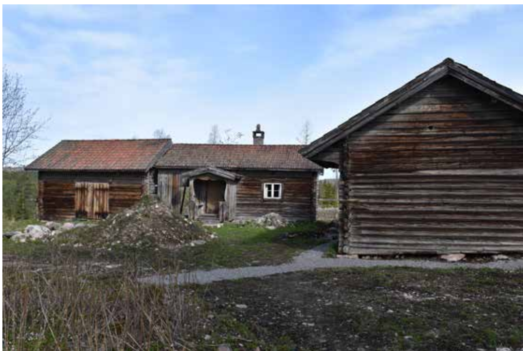
En större kringbyggd gård med enkelstuga, loge, portlider och en mindre bagarstuga. Västberg 3:19.