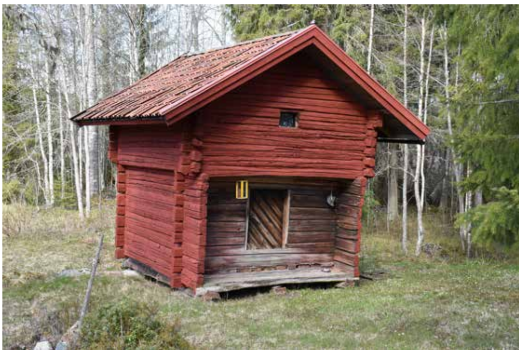
Gammalt härbre som förlorat sitt stolpunderrede. En av få rödfärgade byggnader på Stormos fäbodar. Björkberg 4:10.