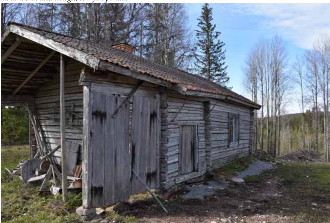
Naturligt grånad bagarstuga med ålderdomlig och orörd patina. Lägg märke till de löst stående portarna i förgrunden. Troligen har det varit ett portlider med ytterligare en numera bortflyttad byggnad mot portarna.