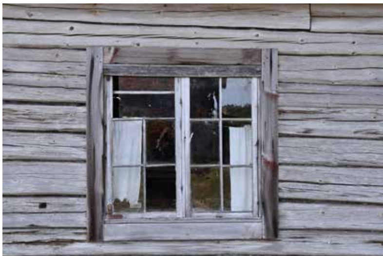
Överlag är stugorna i Stormo enkla. Här ett ofärgat fönster med diskreta foder och spröjs.