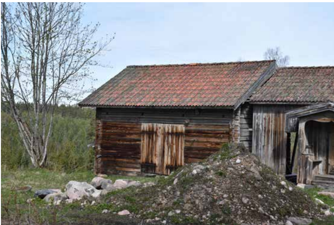
Loge med stora brädportar. Troligen sent 1800-tal. Nästan alla takfall på fäbodarna är täckta med lertegel, som fått patina.