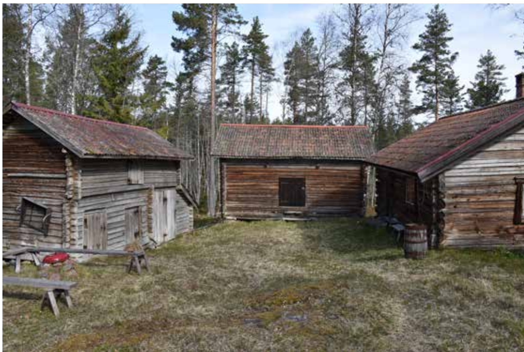
Ålderdomlig och orörd fäbodgård med tydlig kringbyggd karaktär. Björkberg 4:10.