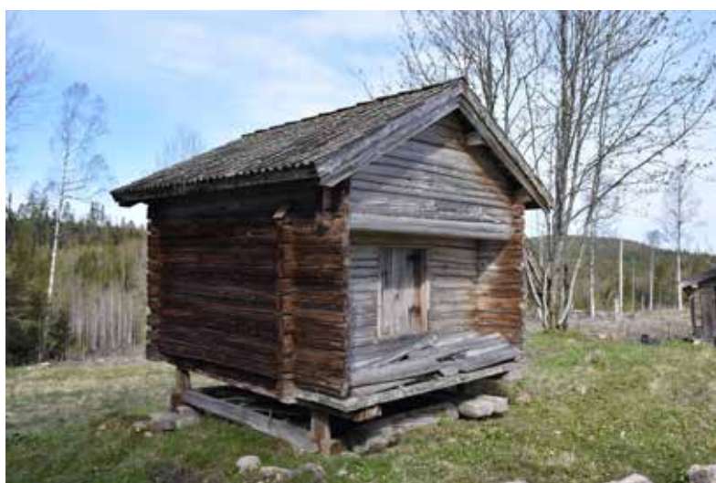
Alla Stormos gårdar har ett flertal ekonomibygnader, vanligen i form av lider, logar och härbren. Ovan syns ett gavelhärbre med stolpunderrede. Västberg 3:19.