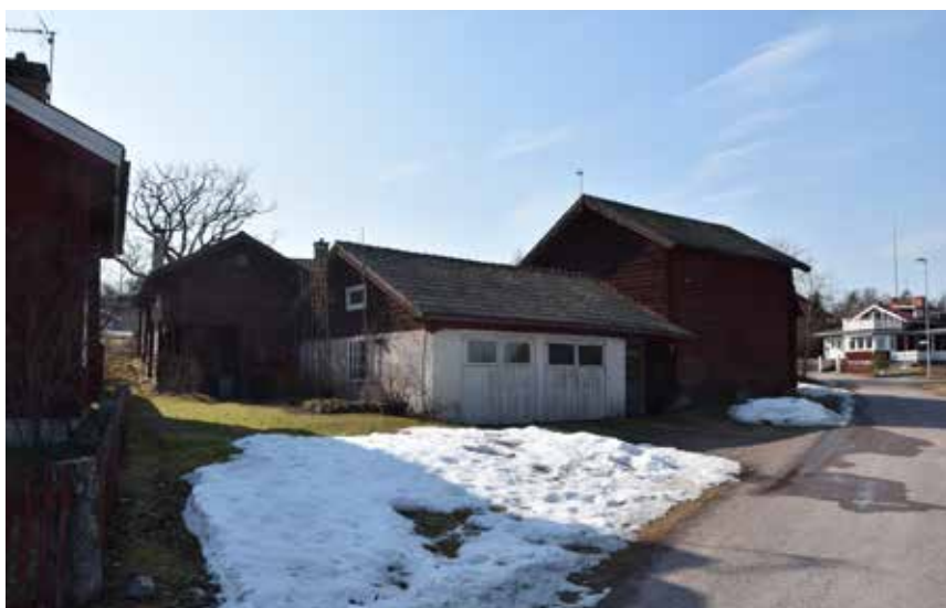
Många gårdar har fortfarande kringbyggd karaktär och fyrkantsform, vilket är särskilt värdefullt. Västanvik 50:12.