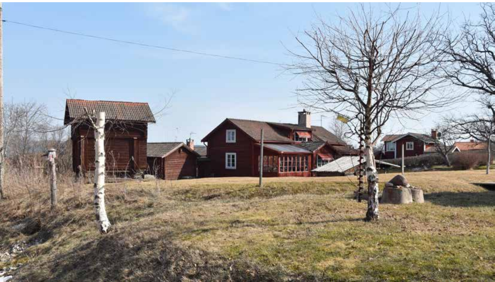
Även om många bostadshus förändrats under 1900-talet finns fortfarande många gårdar med kringbyggd karaktär. Vissa gårdar är kringbyggda i fyrkantsform, vilket är ett älderdomligt karaktärsdrag som härrör från det äldre bondesamhället. Västanvik 50:12.