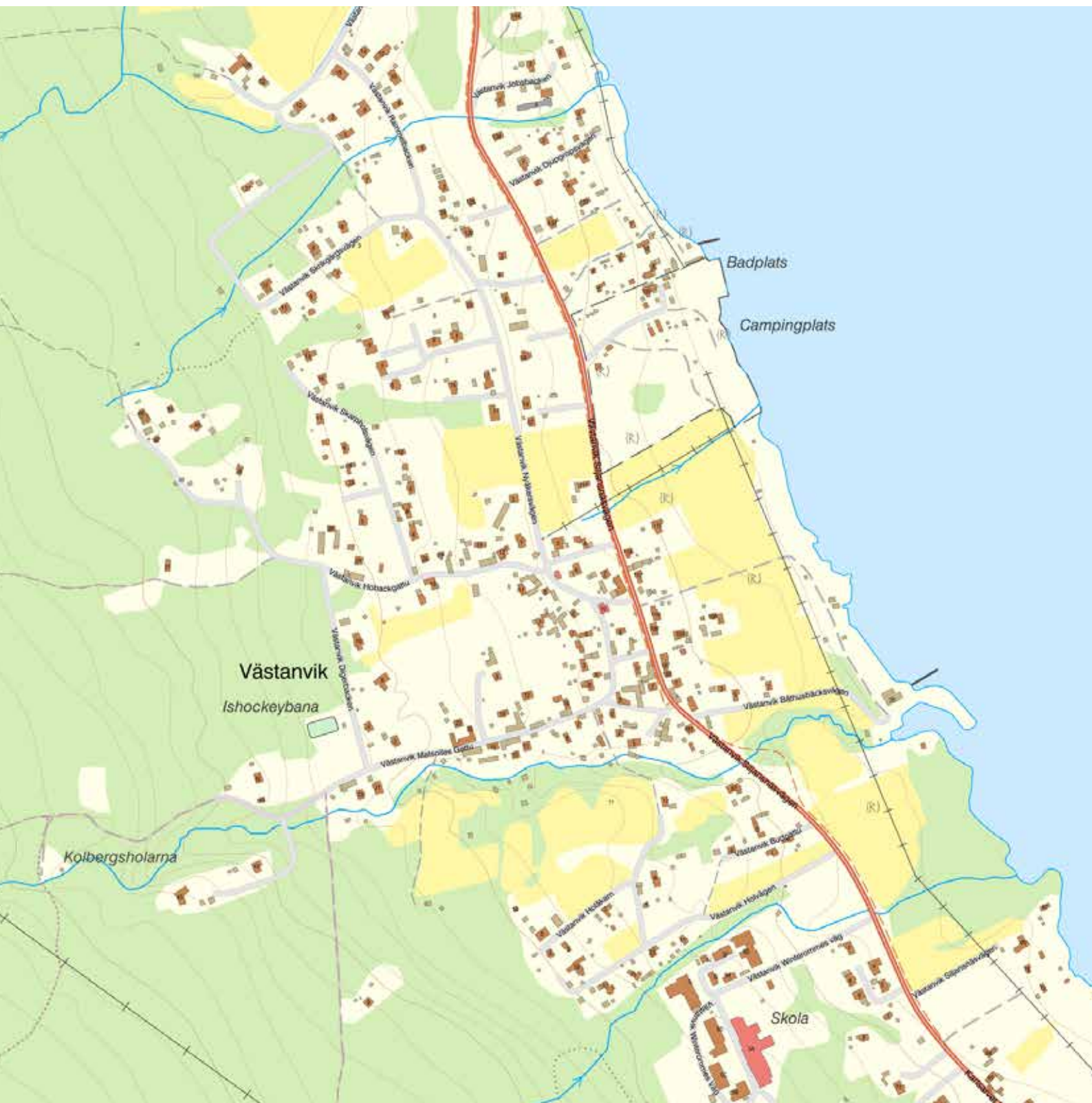
Västanvik med hästskeformad bykärna vid Östervikens strand. Områdena norr och söder om byn har i senare tid bebyggts med bland annat småhus, folkhögskola och en campingplats.