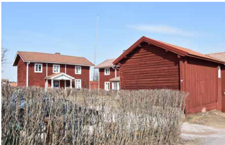
Alla byggnader i byn är rödfärgade och många bostadshus har vita detaljer så som fönsterfoder, vindskivor och knutbrädor. Västanvik 52:1.