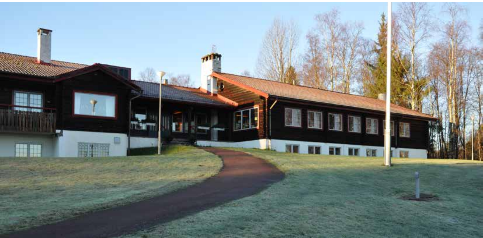
Modernt timmerhus vid Västanviks folkhögskola. Västanvik 109:20.