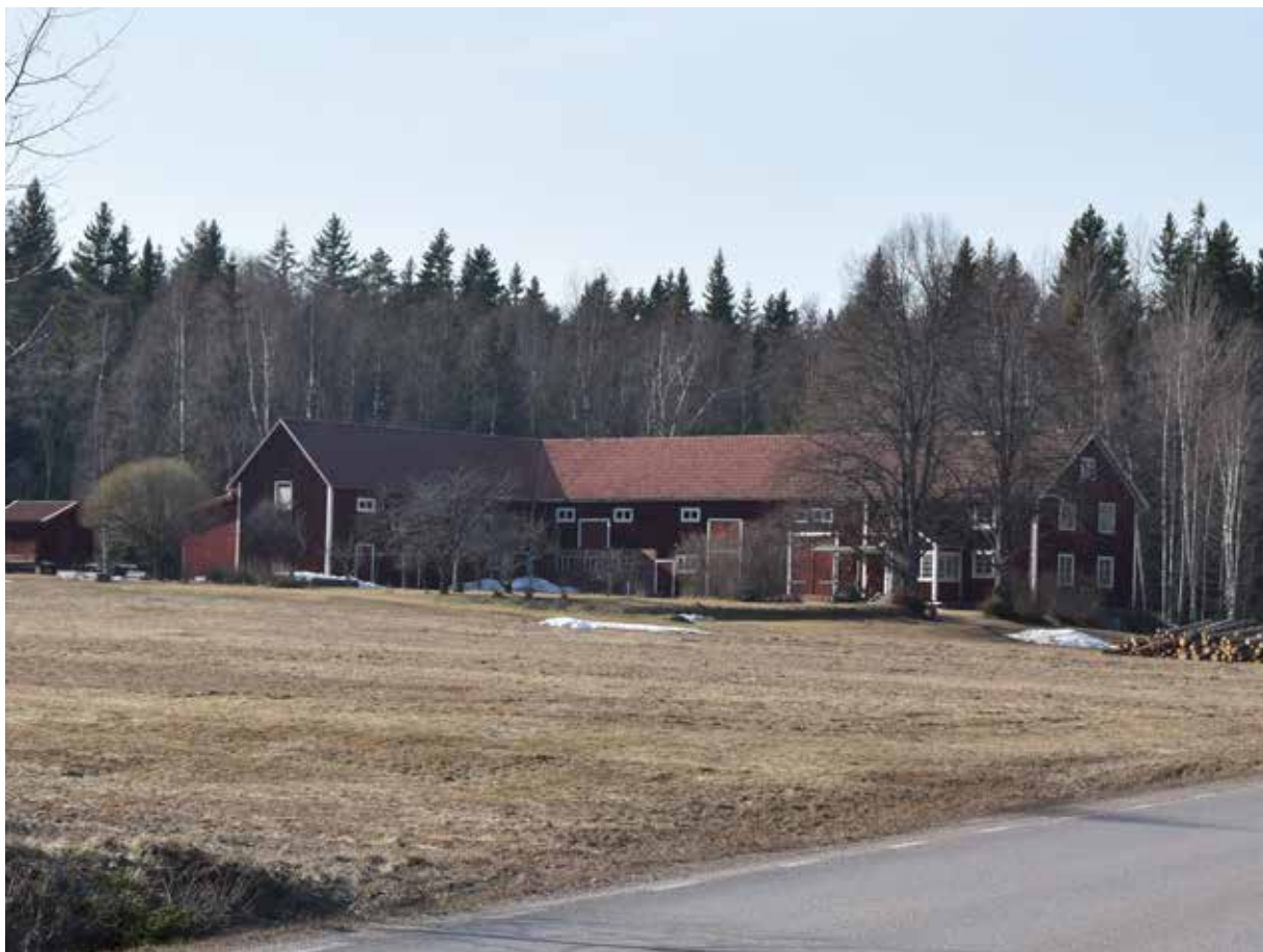
En av de gårdar som tillkommit efter laga skifte i början av 1900-talet. Gården är belägen i byns norra delar. Västanvik III:2.