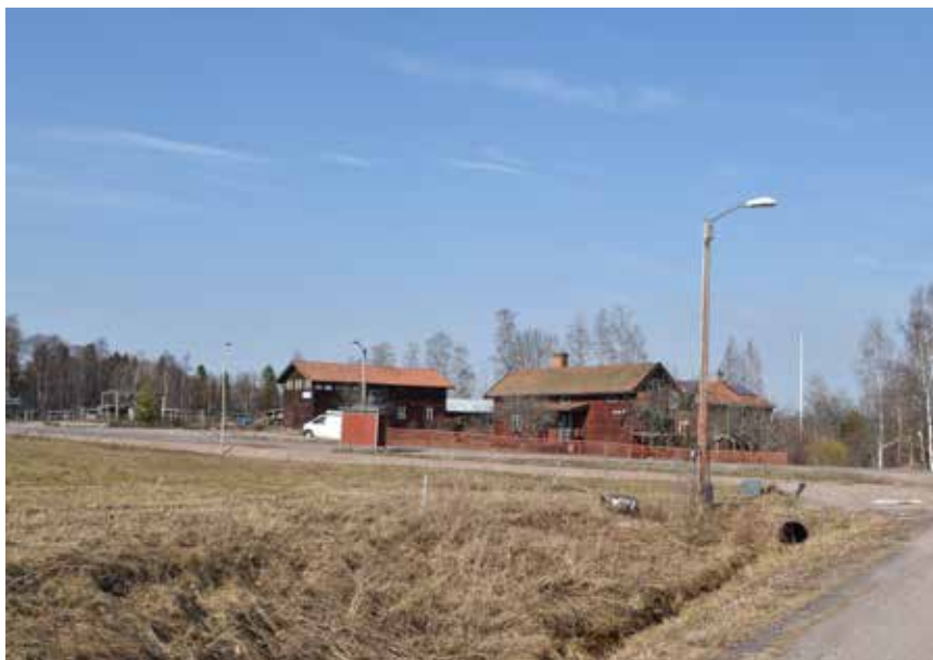
Jobsboden med tillhörande funkislada. Byggnaderna är värdefulla på grund av sin anknytning till de konstnärer som levde och verkade under 1900-talet i Västanvik. Västanvik 57:5.