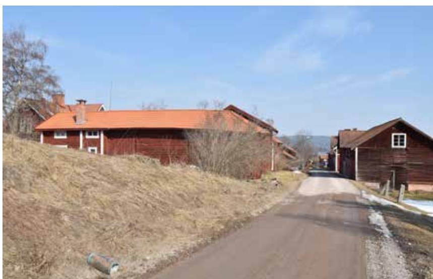
Gård med helt kringbyggd karaktär i byklungans södra delar. Gårdsbilden är älderdomlig men bostadshuset är utbytt mot ett nyare korsplanshus. Västanvik 87:13.