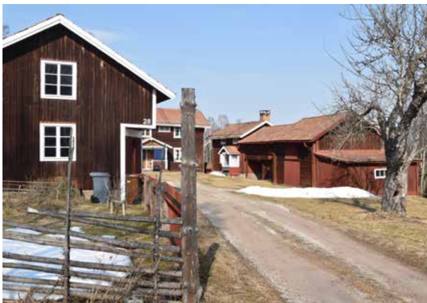
Kringbyggt gårdstun med delvis välbevarad äldre enkelstuga. Var varsam med den kringbyggda karaktären och undvik att ta bort byggnader från gårdstunen. Västanvik 63:1.