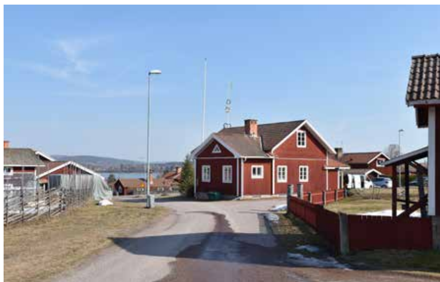
Bystuga som tidigare var byskola. Invid ett av de tre bytorgen. Karlsarvet 15:1.