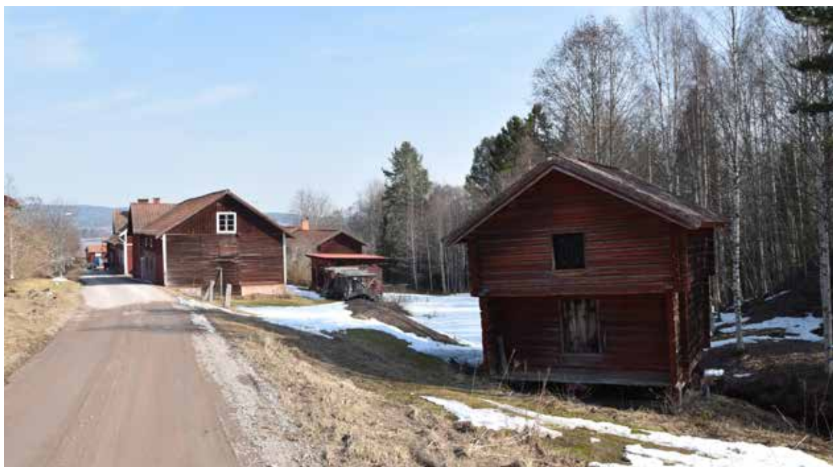
I navinlandskapet vid båtusbäcken (t.h) finns flera äldre ekonomibygnader. Närmast i bilden ett äldre härbre placerat på behörigt avstånd från gårdstunen, smedjorna och torkhusen. Valet av plats hänger samman med skydd mot brand. Västanvik 56:1.