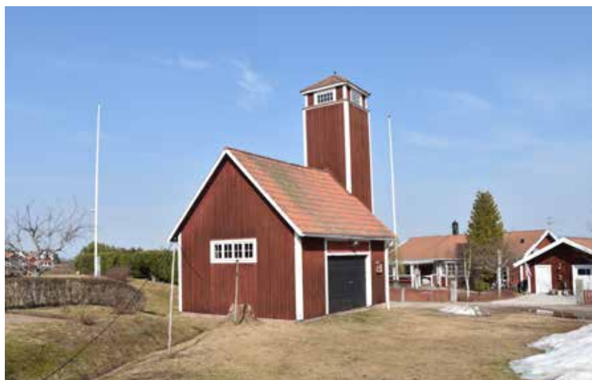
Byns nationalromantiska brandstation med högt slangtorn, röd locklistpanel, små spröjsade fönster och vita detaljer. Västanvik S:15.