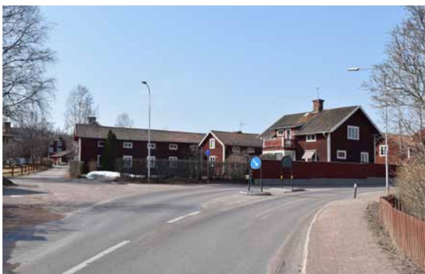
I vissa delar av byn är gårdarna utglesade och äldre eknomibyggnader ersatta av större längor från och med slutet av 1800-talet. Västanvik 69:2.