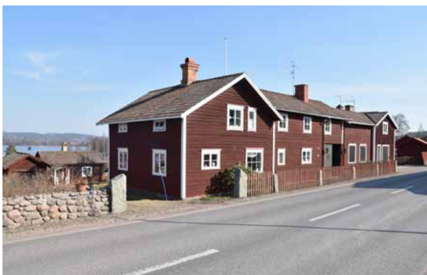
Vid landsvägen som löper genom den gamla bykärnan finns gårdar som haft koppling till turismen i Västanvik under 1900-talet. Västanvik 105:2.