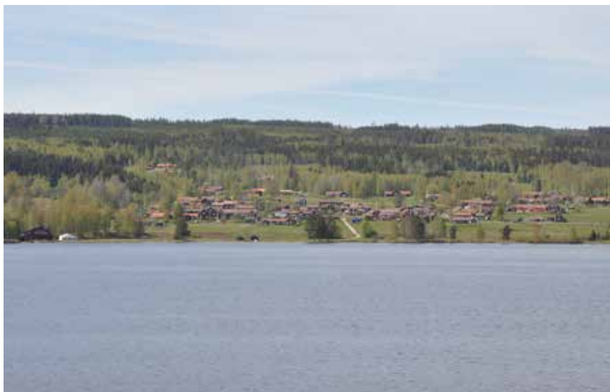
Den hästskeformade byklungan i det öppna odlingslandskapet syns tydligt från kyrkudden.