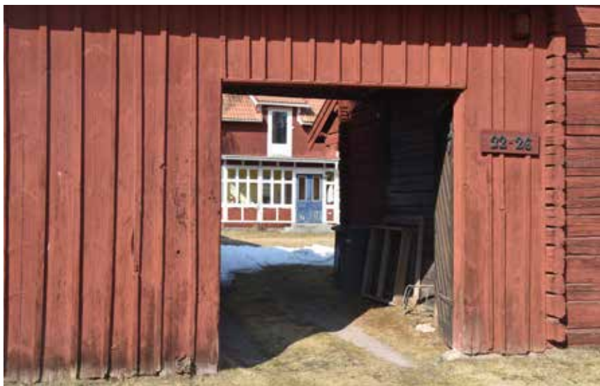
Kilsågad äldre locklistpanel på ett portluder i den äldre byklungans södra del. Västanvik 87:13.