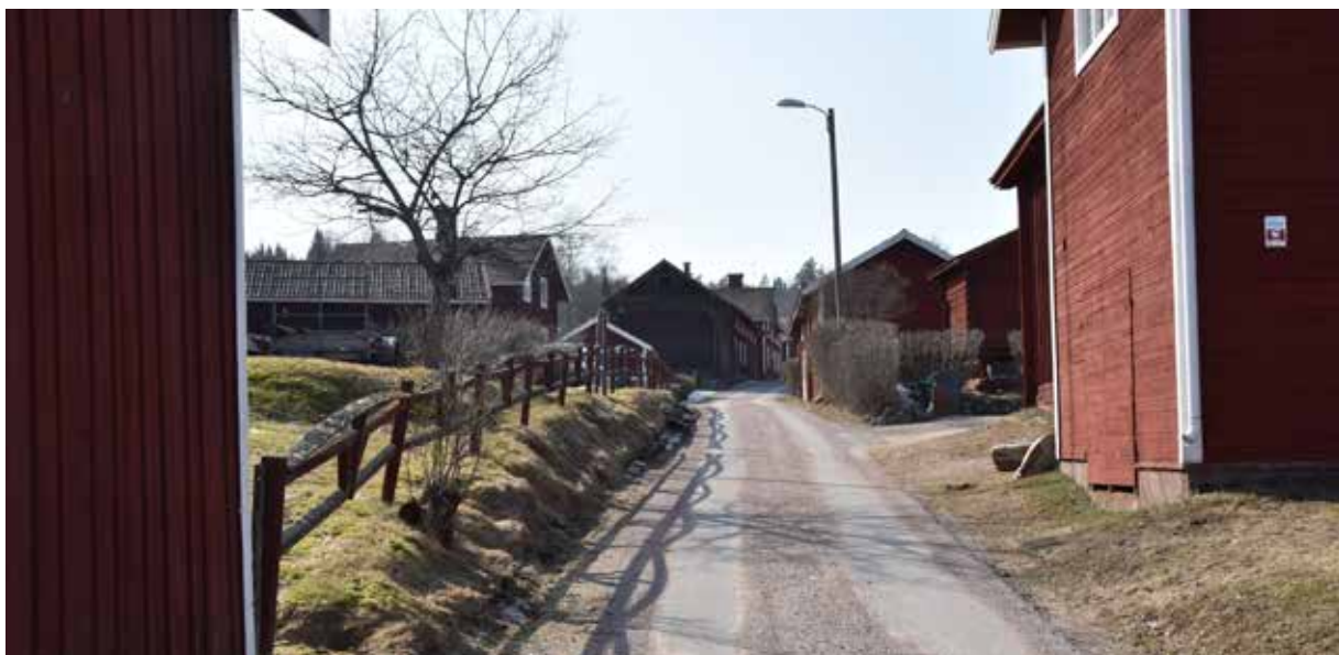
I den södra delen av den äldre byklungan står gårdarna tätt, med bland annat ekonomibygnader nära byvägen. Många gårdar har fortfarande kringbyggd och sluten karaktär, med bevarade äldre ekonomibygnader så som härbren.