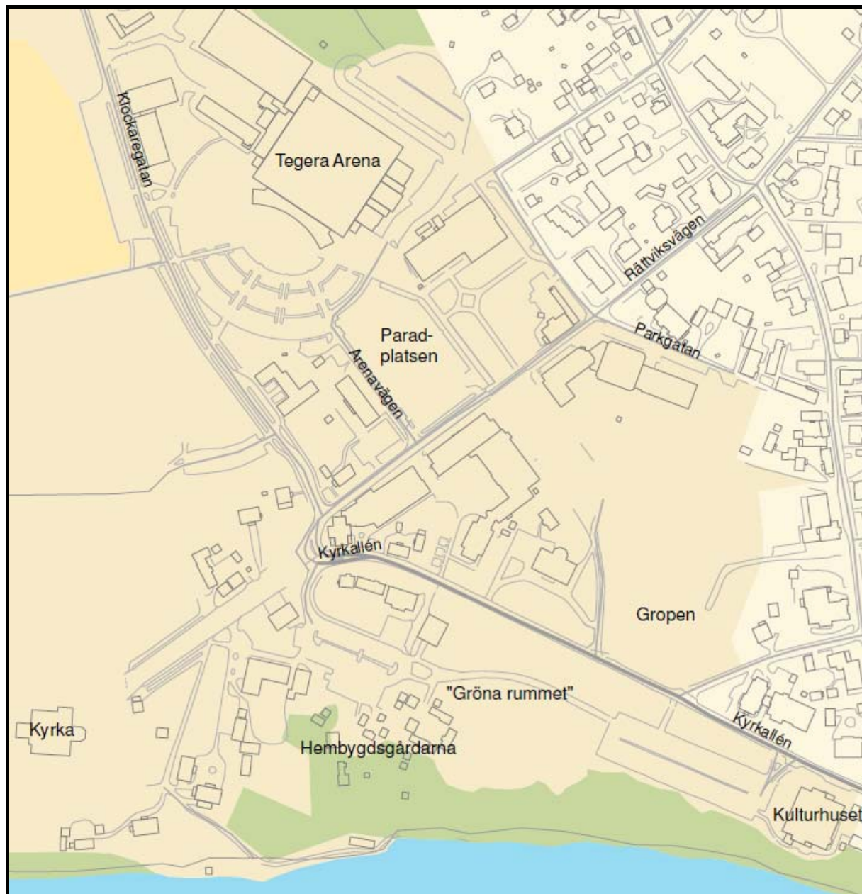
Figur 2) Karta visar var fasta platser är belägna dvs. Gropen, Hembygdsgårdarna, "Gröna rummet" samt Paradplatsen.

Fasta platser: Gropen, Hembygdsgårdarna, "Gröna rummet" samt Paradplatsen.